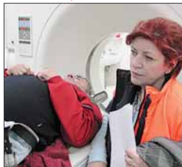
Foto z černé komedie Smrt pana Lazaresca.

V rámci přehlídky budou na Ořechovce uvedeny jak filmy odehrávající se v období Ceaușeskovy režimu a v průběhu protikomunistické revoluce, tak snímky zasazené do současnosti. Do první skupiny spadá např. film Zkouška, který na drsném příběhu ne-