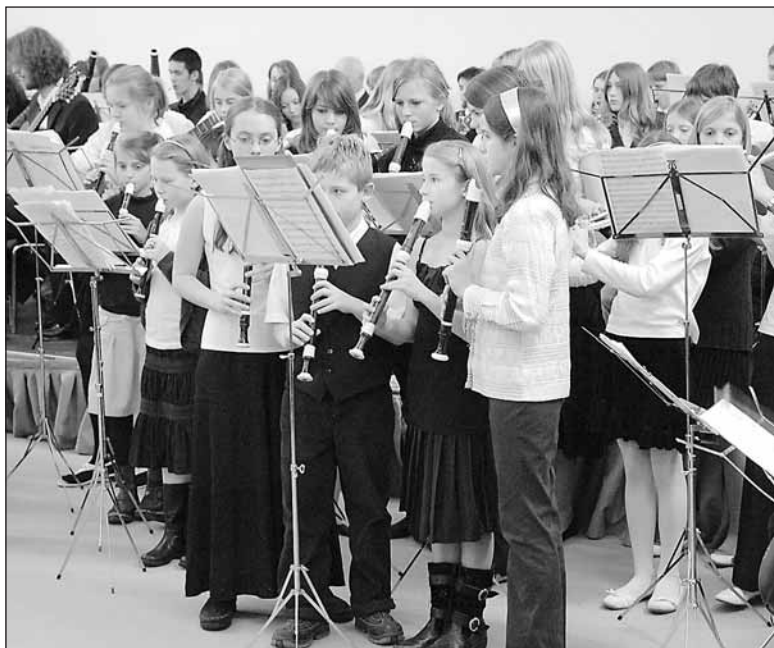
Žáci ZUŠ CH. Masarykové se pravidelně představují na velkých vánočních koncertech v hotelu Crowne Plaza, bylo tomu tak i vloni v prosinci.

Odklad projednávání stavby rozčiluje i rodiče dětí, které uměleckou školu navštěvují a nechápou stížnosti lidí z paneláků. „V situaci, kdy jim z jedné strany hlučí Evropská ulice, z další strany staví věžáky Residence Vokovice a do dvou let má začít téměř pod okny výstavba stanice metra, mi hluchost žáků ZUŠ a nároky na jejich parkování připadají zanedbatelné,“ kroutí hlavou další z rodičů. „Tyto námítky jsou směšné,“ přidává se další. Matky dětí se proto sdružily a nabídly vedení školy jakoukoliv pomoc, která by přesun dětí i stavbu usnadnila a urychlila. „Záleží nám na tom, kde se budou děti učit a chceme nějak pomoci,“ říkají.