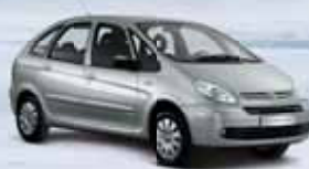
CITROËN Xsara Picasso

2x airbag, ABS, centrální zamykání Vítěz kategorie MPV v anketě Auto roku 2009 v ČR Sleva až 100 000 Kč Možnost odpočtu DPH