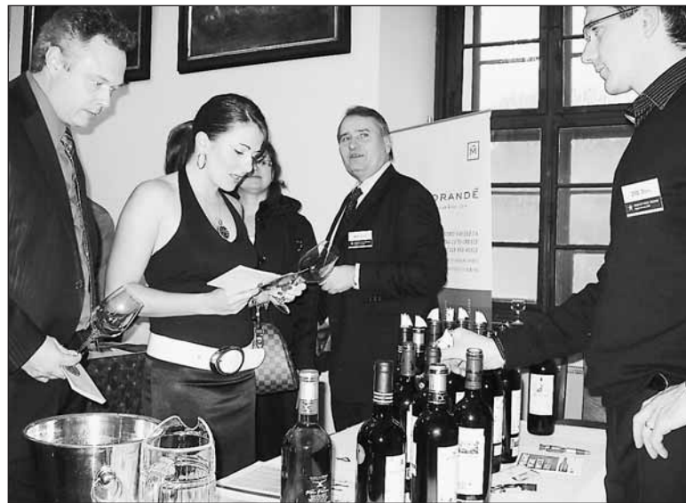
Tisícovka návštěvníků Galadegustace si nechávala poradit od odborníků, jak správně vychutnávat víno a jak si jej vybrat.

V obou patrech kláštera se sešlo více než tisíc návštěvníků vybavených nejen sklenkami, ale i tužkami a katalogem ochutnávkových vzorků. Řada z nich si pak u jednotlivých vzorků pečlivě zapisovala své pocity, aby se k nim později mohla v soukromí vrátit. A bylo z čeho vybírat. „Hosté mohli ochutnávat vína oceněná v rámci soutěže Prague Trophy, které se při slepé degustaci zúčastnilo 718 certifikovaných vinařů z šestadvaceti zemí světa. Celkem bylo