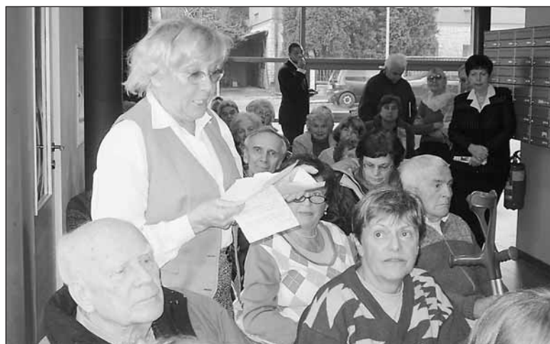
Obyvatelé domu pro seniory Nová Ořechovka mluvili s radními o tom, jak se jim bydlí.

Dům Nová Ořechovka ve Střešovicích s 53 byty nechala postavit radnice Prahy 6. Náklady na jeho výstavbu dosáhly téměř sto miliónů korun. V současné době je v domě volný jeden bezbariérový byt.