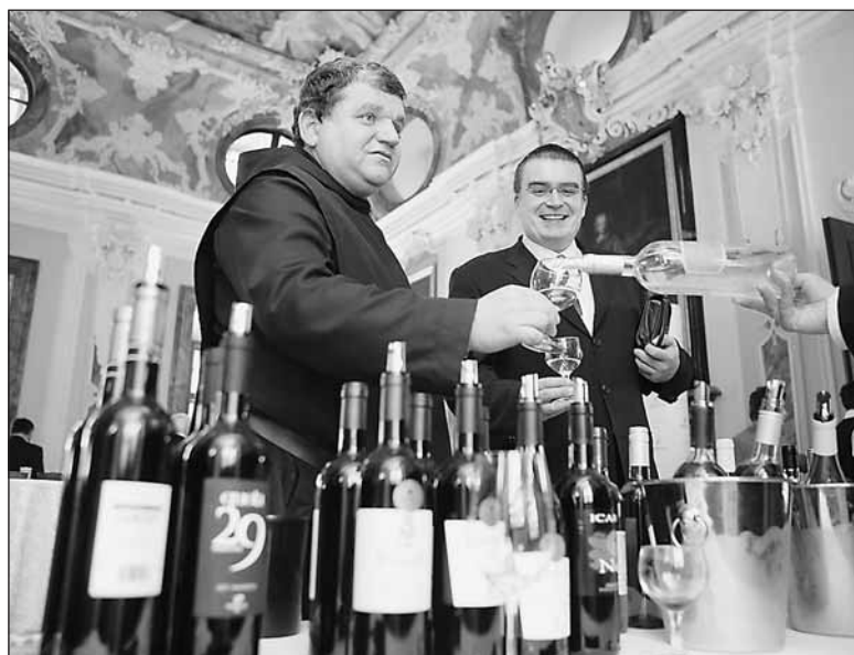
„Genius loci kláštera, který tady žije více než tisíc let, je opravdu značný a působí na všechny,“ nechal se slyšet převor kláštera Siostrzonek.

uděleno 206 medailí a deset ocenění Champion, které získalo i vinařství z Moravy. Vítězná vína jsou pak označena medailí,“ vysvětlila jedna z organizátorek akce Šárka Dušková z časopisu Víno revue.