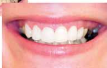
PORCELÁNOVÉ FASETY CEREC

PORCELÁNOVÉ FASETY – CEREC KERAMICKÉ PLOMBY A KORUNKY BĚLENÍ ZUBŮ – ZOOM LÉČBA ZUBŮ OZÓNEM DENTÁLNÍ KOSMETIKA LASEROVÉ VYŠETŘENÍ ZUBŮ LÉČBA PARADENTÓZY – VECTOR DENTÁLNÍ HYGIENA ZUBNÍ IMPLANTÁTY