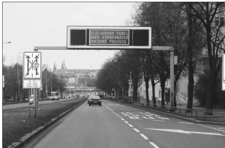
V dohledné době přibudou v Praze 6 další telematické značky.

„Informace pro světelné panely pocházejí z řídicí ústředny, která je napojená na většinu detektorů, které sledují dopravu. Detektory v křižovatkách mo-