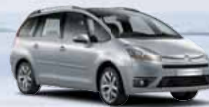
CITROËN Grand C4 Picasso

Manuální klimatizace, 4x airbag, ABS + EBD, el. ovládání oken a zrcátek, centrální dálk. zamykání Sleva až 100 000 Kč Možnost odpočtu DPH