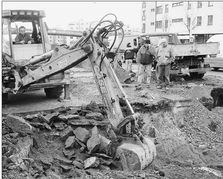
Havárie potrubí na Patočkově ulici. 20 tisíc lidí bez vody. Unikající voda podemlela část vozovky.

Jen o deset dní později postihla podobná nehoda Břevnov na vodovodním