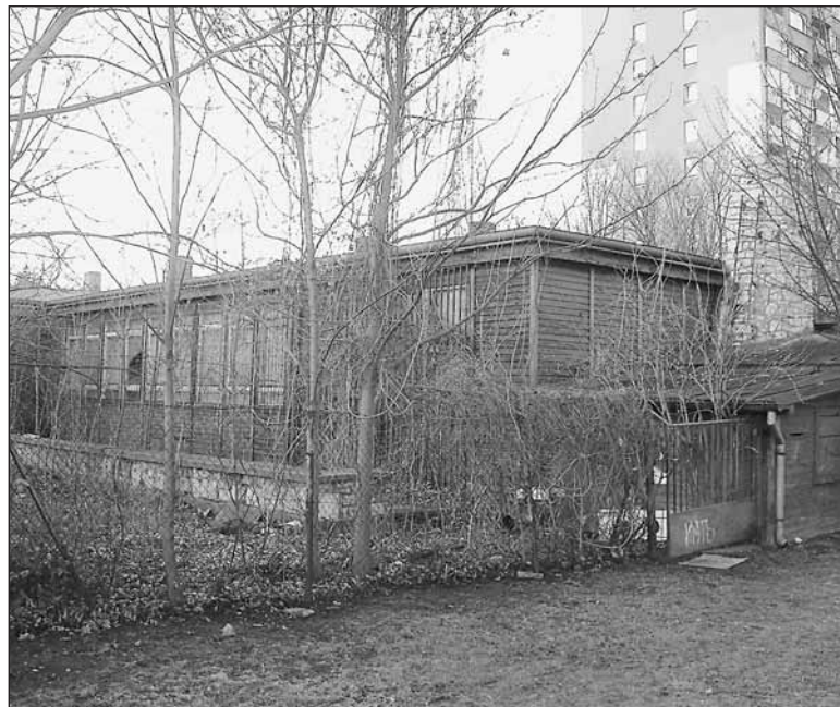
Zchátralý dřevěný pavilon mezi věžáky by mohla v budoucnu nahradit nová budova umělecké školy.

S areálem hudební školy, kde už nefunguje taneční sál ani koncertní sál a budova bude prázdná do konce léta, má developer rozsáhlé plány. Vyrůst by