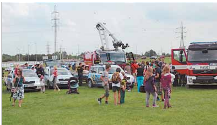
Začátkem září proběhne na dopravním hřišti na Vypichu a přilehlé pláni již 12. ročník akce Vypich.

Září si většina dětí spojuje s návratem do školní lavice a moc se na něj netěší. Konec prázdnin ale znamená konec zábavy, dobrodružství a potkávání nových kamarádů. Dům dětí a mládeže Prahy 6 se snaží všem školákům, předškolákům, ale i dospělým léto prodloužit na celý rok.