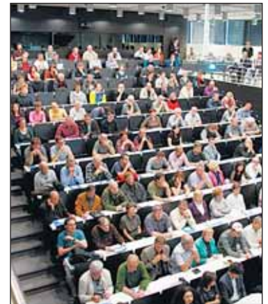
Veřejná debata k projektu modernizace trati do Kladna v Ballingově sále Národní technické knihovny probíhala 22. června.

Investor Praze 6 nedoložil, že podzemní varianta je finančně nerealizovatelná. V celkovém hodnocení efektivit jsou podle podceněny přínosy