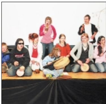
Hosté Zory Jandové, děti s Downovým syndromem vystoupily na podiu, Zora Jandová předčítala pohádky ze své knihy.

Na pobočce městské knihovny v Břevnově pak přihlížely dvě desítky diváků vystoupení studentů spolku Um z Gymnázia Nad Alejí. Tři kluci inspirovaní romantismem a starými texty předvedli své hry Krakonoš umělcem, Poklad nebo Seriál. O nic hůře na tom nebyla dejvická pobočka.