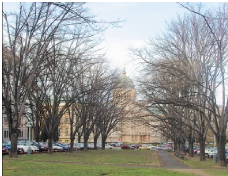
Lípy v Thákurově ulici jsou podle TSK staré a nemocné. Radnice se snaží část z nich od kácení zachránit.

Kácení mělo postihnout i čtyřřadé stromořadí v Thákurově ulici. O povolení pokácet jednatřicet lip požádala Technická správa komunikací. „Podle odborného posudku jsou lípy staré a nemocné, část z nich je napadena plísní,“ sdělil tiskový mluvčí TSK Tomáš Mrázek s tím, že osmdesát let staré stromy jsou nebezpečné svému okolí. „Samozřejmě počítáme s náhradní výsadbou ve stejném množství. Jako náhradní stromy navrhujeme lípu stříbrnou nebo platan,“ dodal Mrázek.