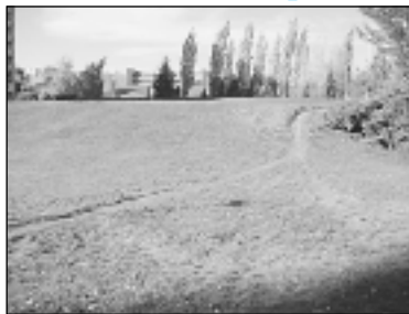
Výšlapané cesty nahradí nové chodníky. Projekt bude dokončen na podzim.

Projekt na revitalizaci sídliště Dědina, který městská část připravuje již dva roky, zahrnuje celé sídliště a akce má přijít na 72 milionů korun. Sídliště má dostat novou a moderní tvář. Vznikne zde centrální náměstí, odpůdková místa, nové chodníky s osvětlením, které budou kopírovat přirozeně vyšlapané cesty, přibudou vodní prvky. Na akci je vybrán dodavatel stavby a práce začaly terénními a sadovými úpravami. Právě zeleň je jedním z cílů revitalizace a měla by plnit svůj smysl a mít jednotný ráz. Přesto kácení některých keřů a stromů vzbudilo na sídlišti hodně emocí. Zejména starší lidé