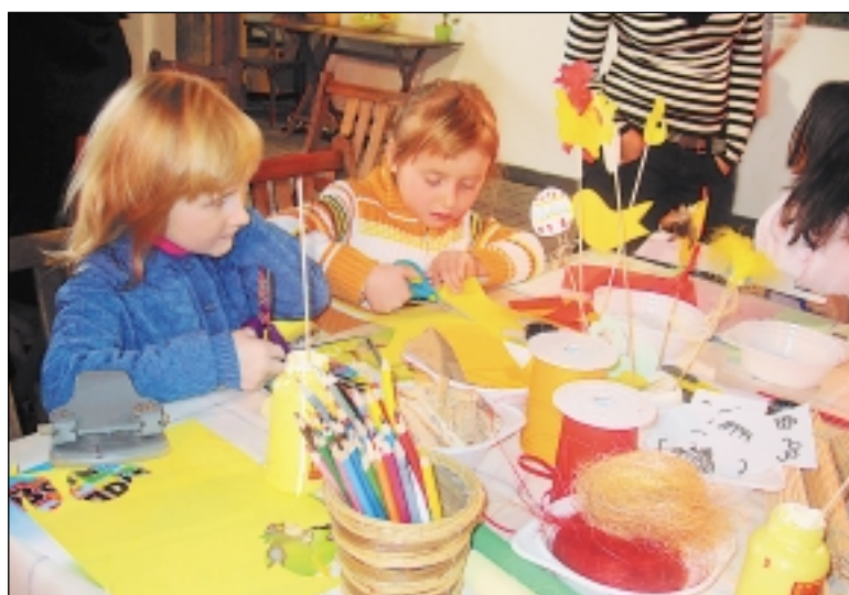
Velikonočním zdobením se bavily děti i na základních školách, např. na Petřinách - sever si vyráběly napichovátka do květináčů.