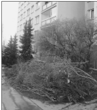
Kácení keřů se lidem z Dědiny nelíbilo.

„Odstranění některých dřevin probíhá podle projektu na oživení sídliště, který má celému prostoru ucelený vzhled. Na likvidaci zeleně bylo vydá-