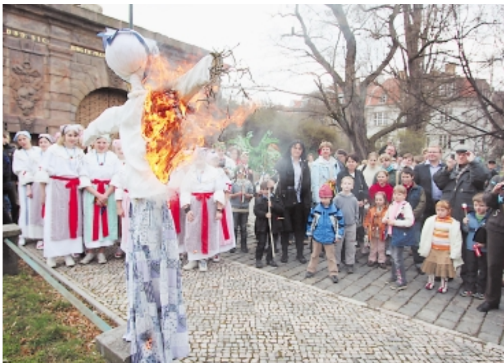
O Smrtné neděli návštěvníci Velikonočního programu v Písecké bráně vynesli symbol zimy – Moranu. Zima se však nedala a následující dny v Praze 6 několikrát sněžilo.