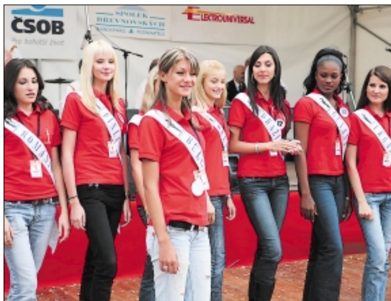
Zajímavým zpestřením byla návštěva finalistek soutěže krásy Miss Europe – Junior, které ke klášteru zavítaly rovnou po splnění soutěžní disciplíny ze ZŠ na Petřínách. Dívky se předvedly divákům a pochutnaly si na koblížcích.