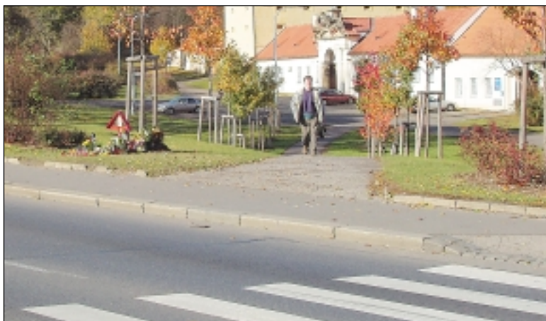
Nebezpečný přechod si vybral svou daň. Tragickou nehodu připomíná pomníček.

V ulici Jugoslávských partyzánů jsou dva shora přisvětlené přechody. K tomu navíc opatřené technologií jako jeden ruzyňský. Ve vozovce jsou zapuštěné LED diody, které za šera svítí. U přechodu je navíc instalován detektor, který světélka rozbliká ve chvíli, kdy se chodec blíží k vozovce. Jeden přechod je u křižovatky s Čínskou, druhý u Delvity. Na oba byly časté stížnosti, že jsou nebezpečné. „Zvláště u Delvity má úprava své důvody, obchod má otevřeno do tří hodin do rána,“ zdůvodnil výběr míst starosta. Přisvětlení hradil prostřednictvím magistrátu BESIP v rámci bezpečnostních programů, instalaci světýlek doplatila městská část. Účet za oba přechody činil milion tři sta tisíc korun. Podobnou úpravu bude mít brzy i přechody u střešovické vozovky a v Patočkově.