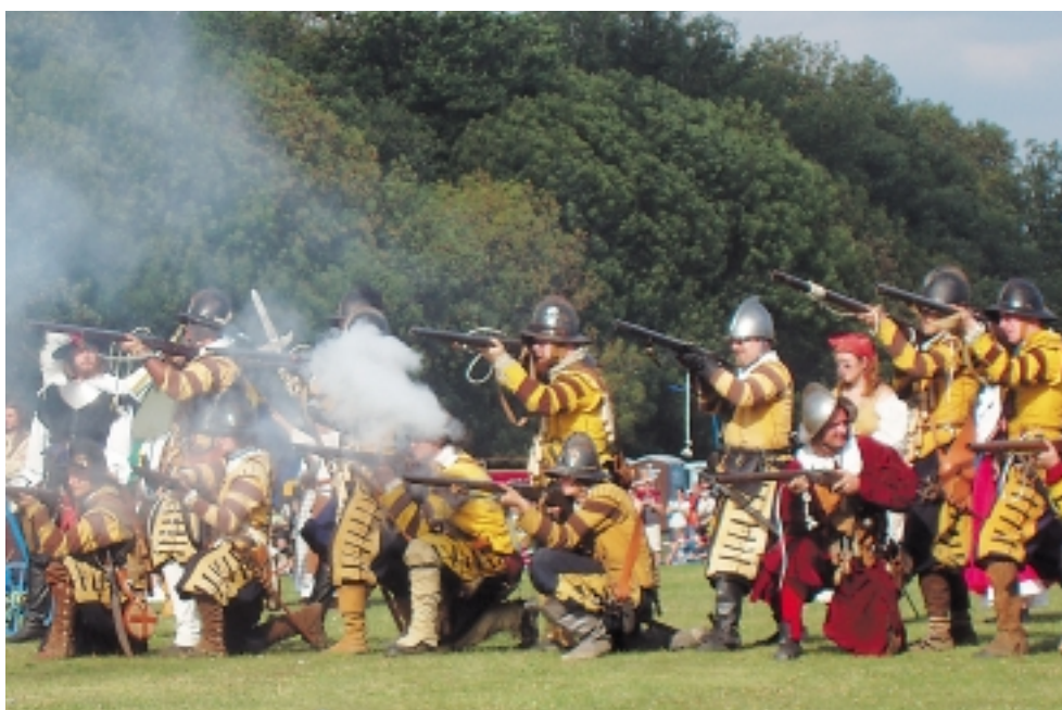
Na tisíc bojovníků v dobových kostýmech připravilo v září divákům strhující podívanou. Šlo o rekonstrukci historické bitvy stavovských a císařských vojsk na Bílé hoře z roku 1620. Připravila ji skupina historického šermu Rytíři Koruny české ve spolupráci s radnicí Prahy 6.