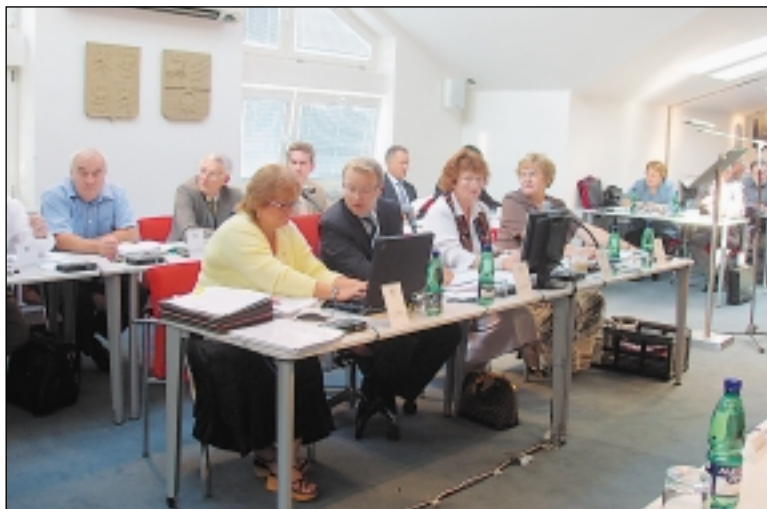
Naposledy ve volebním období zasedli zastupitelé Prahy 6 za hlasovací stoly.