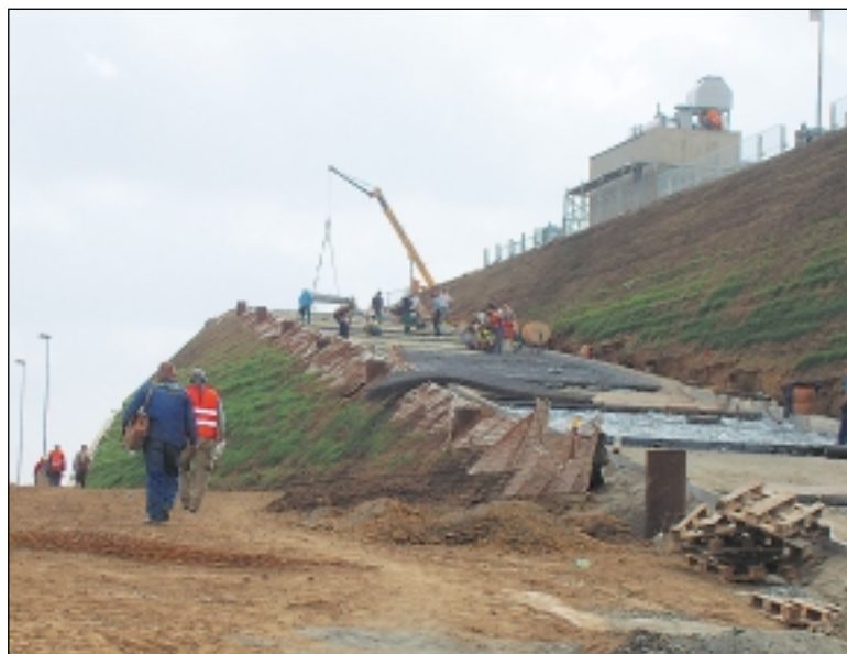
Dělníci pokládají zeminu a trávu na stěny budoucího obchodního komplexu, který je zajímavý tím, že bude vypadat jako zelený kopec.

Nový komplex se může chlubit i zcela nezvyklou architekturou – svažité fasády budou z velké části pokryty zeminou, tím vznikne travnatý svah příjemně splyne s okolním prostředím.