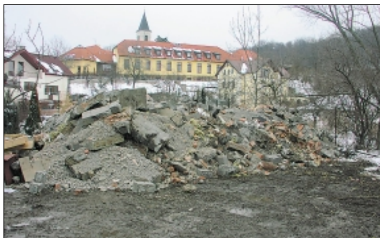
Po demolici. Odstranění stavby se domáhali i lidé ze sousedství.