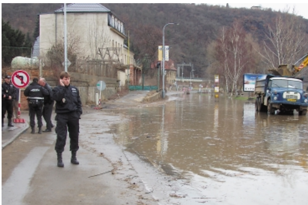
Vltava zaplavila Roztockou ulici v Sedlci. Uzavřenou oblast hlídala městská policie.

„Perfektní webová prezentace pro nás není cíl, ale nástroj k úspěšné komunikaci s veřejností. To, že jde o krok správným směrem, dokazuje stále vyšší počet lidí, kteří řeší své záležitosti pomocí internetu. A pro ně, věřím, nabízí Praha 6 odpovídající webové prostředí,“ hodnotí výsledek starosta Tomáš Chalupa.