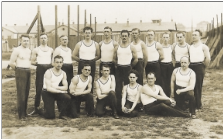
Cvičenci hanspaulského Sokola. Fotografie z roku 1932.

Na IX. všesokolském sletu v roce 1932 cvičilo z hanspaulské jednoty 250 cvičenců všech složek. Roku 1933 byla jednota prohlášena za samostatnou s názvem Sokol Praha–Dejvice II.