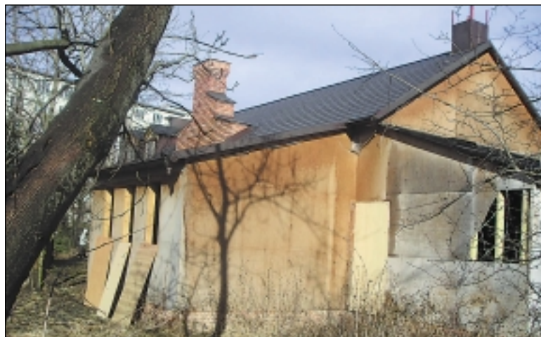
Celodřevěná stavba na betonovém základu stála na černo v zeleni a v zátopovém území. Údajně z ní měla být restaurace.

Z informací stavebního úřadu vyplývá, že pan Levyckij je už z minulosti znám jako opakovaný černý stavebník. Bez předchozího povolení postavil v Praze 6 dvě restaurace.