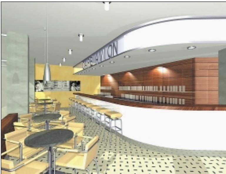
Kavárna ve funkcionalistickém stylu.

Během oprav Skleněného paláce se od 1. dubna stane oddávacím místem vila generála Pellé. Zde se doposud svatby konaly také, ale za poplatek, stejně jako na dalších místech Prahy 6. Bez poplatku se svatby konají pouze v místě, které městská část určuje jako obřadní. „Snoubenci, kteří již mají svatbu plánovanou ve Skleněném paláci, mají možnost se rozhodnout, zda místo ještě změni,“ uvedla Olga Králová, vedoucí odboru vnitřních věcí. Oficiální oddávací doba zůstává stejná, ve čtvrtek a v pátek a první sobotu v měsíci. „Svatby se budou odehrávat buď uvnitř vily, nebo v přilehlé zahradě,“ řekla ředitelka galerie Jiřího Andrlého, která v této vile sídlí. Ředitelka Jana Titlbachová se domnívá, že vila generála Pellé i prostředí galerie je pro uzavření sňatku pěkné i důstojné místo. Kromě oficiálních míst si mohou snoubenci vybírat za úřední poplatek tisíc korun i jiná místa. „Musí být důstojné, veřejně přístupné a schválené matrikou,“ vysvětluje Králová. Oblíbeným prostorem se stává v poslední době Písecká brána, v létě pak svatby pod širým nebem.