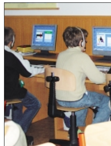
Další učebny s počítači a připojením na internet přibudou díky grantu na čtyřech základních školách.