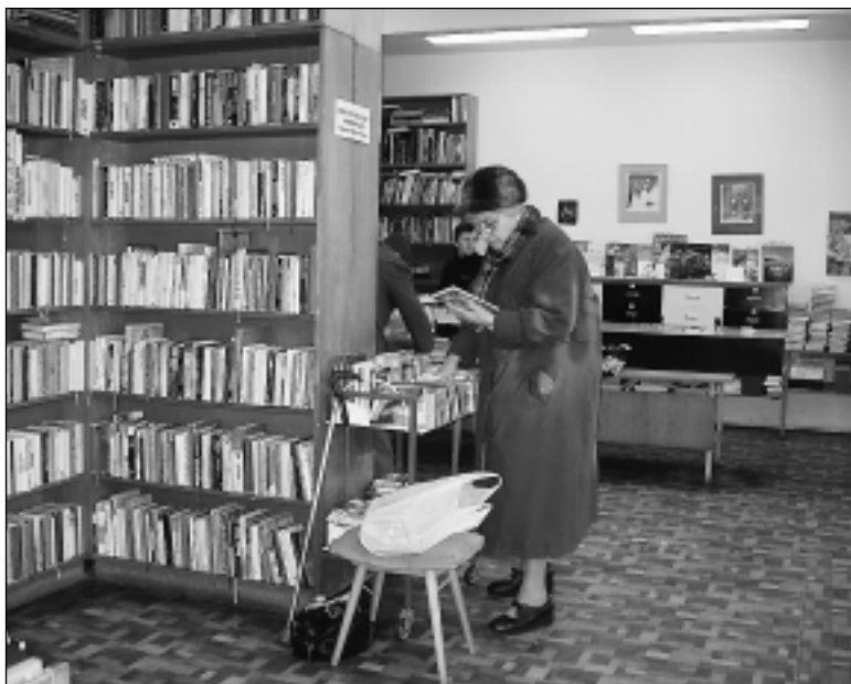
Dejvická knihovna má k dispozici pouze omezené prostory, přesto ji navštěvuje téměř pět tisíc čtenářů. Ti využívají nejen bohatý knižní fond, ale také čítárnu novin a časopisů. Dejvická knihovna má zvlášť i oddělení pro dětské čtenáře.

Termíny setkání: 7. března, 11. dubna a 17. května.