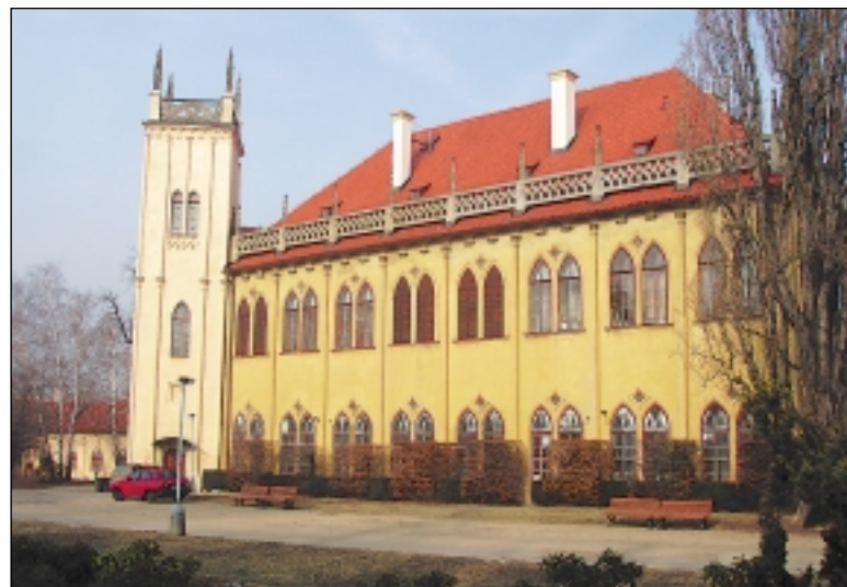
Lovecký letohrádek v Královské oboře má své základy někde ve 13. století a pod svou novogotickou úpravou skrývá dosud blíže neprozkoumané gotické jádro. Dnes se v objektu nachází archiv Národní knihovny.

tehdy provedla stavební huť Benedikta Rejta, působící na pražském hradě. Dodnes se z té doby zachovala okna i schodištvá věž s plastikou českého lva a iniciálou krále Vladislava (W).