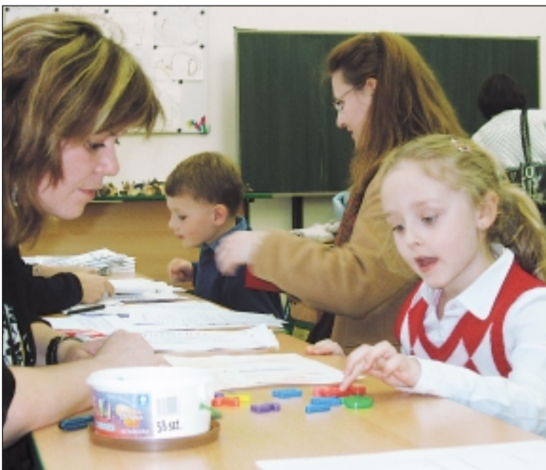
Na ZŠ E. Destinové mohly děti u zápisu předvést, zda již umí číst nebo počítat.

První a druhý únorový den se vydali k zápisům rodiče s budoucími prvňáčky. Na řadě škol čekalo děti příjemné uvítání. Na Hanspaulce je, aby se nebalý, čekal Ferda Mravenec, na Červeném Vrchu byli jako v pohádkovém hradu.