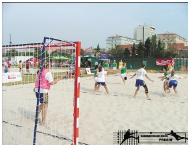
Stále atraktivnější plážová házená se hraje obvykle venku. V lednu se na Strahově uskutečnil první halový turnaj. V červenci se zde bude konat mistrovství republiky

Jak se beachhandball hraje? Plážová házená je venkovní verzí slavnějšího stejnojmenného olympijského sportu. Osmičlenné družstvo do hry vysílá tři hráče a brankáře. Protože pohyb na písku je fyzicky náročný, střídání hráčů probíhá podobně jako v hokeji za hry. Samozřejmě dribling na písku nepřipadá v úvahu a ostatní pravidla jsou podobná házené. Výsledkem je divácky atraktivní sport, který se podobně jako beachvolejbal může jednou stát olympijským. „Filozofií soupeřících týmů je totiž předvést divácky přitažlivé kombinace,“ říká Toufar a dodává, že o zajímavé momenty nebyla při lednovém halovém turnaji nouze. Smíšeným týmům bylo nutně upravit pravidla, dámské góly platily za dva body.