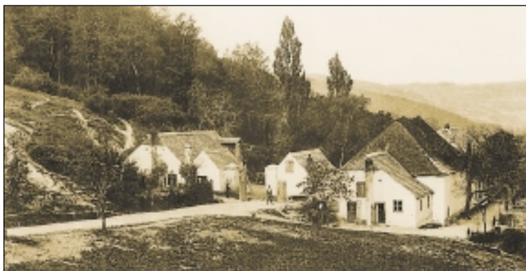
Usedlost Zlatnice vyrostla na místě tři vinic. Dnes z ní zbývá pouhé torzo.