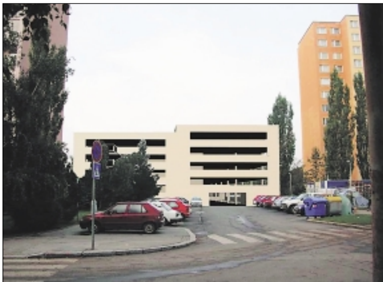
Garážový dům pro téměř 300 aut v ulici U Valu poměrně nenásilným způsobem zapadá do okolního prostředí.

Poslední fází obnovy sídliště je komplexní rekonstrukce základní školy. Tu plánuje městská část v příštím roce. Předběžný odhad celé investice je 130 milionů korun. Za ně by se měla opravit školní jídelna a kuchyně, škola dostane nová okna, zateplení fasádu. Vymění se otopný systém a kolem školy budou opraveny všechny sportovní plochy. Základní škola na Dědině je další školou v Praze 6, kde radnice řeší všechny nedostatky najednou.