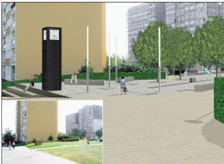
Sídliště Dědina podle architektů postrádá orientační body. Na nově vzniklém náměstí před obchodním centrem si lidé brzy budou dávat sraz například „u hodin“.