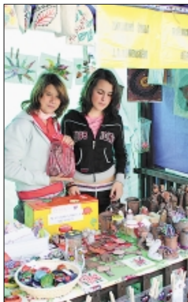
Školy i školky na stáncích nabízejí výrobky svých šikovných dětí. Leckdo jim rád něco přihodí do kasičky.