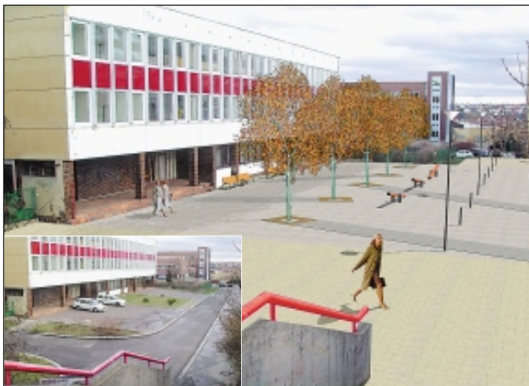
Málo využívaná ulice vedoucí k základní škole v příštím roce zmizí. Místo ní vznikne školní náměstí, na kterém budou mít školáci více prostoru a bude bezpečnější.