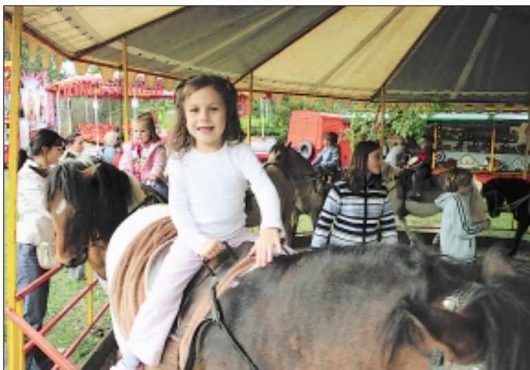
Přestože před branami kláštera každý rok přibývají nové atrakce, tradiční pouťová zábava vítězí. Jízda na ponících nebo střelba ze vzduchovky své kouzlo neztrácí.