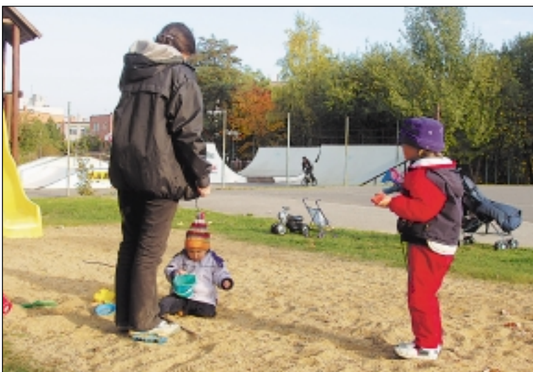
Hřiště na Babě jde do rekonstrukce, bude i nový skatepark.

chy vznikne zcela nové travnaté hřiště, které bude svými rozměry vyhovovat pravidlům pro malou kopanou. „Pokud to počasí dovolí, nové ošetření bychom mohli stihnout ještě letos,“ domnívá se radní.