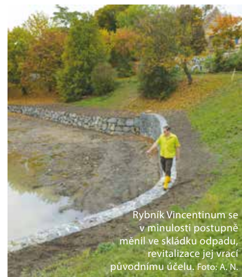
Rybník Vincentinum se v minulosti postupně měnil ve skládku odpadu, revitalizace jej vrací původnímu účelu.

Břevnovský rybník Vincentinum, který se nachází na potoce Brusnice, byl vybudován až v šedesátých letech 20. století na místě původního parčíku. Jeho břehy byly obezděny kamennou zdí. „Revitalizace by měla umožnit propojení vodního a suchozemského prostředí, což je důležité zejména pro mladé vodní ptáky, žáby a další, kteří se z vodní hladiny těžko dostávají,“ dodává radní.