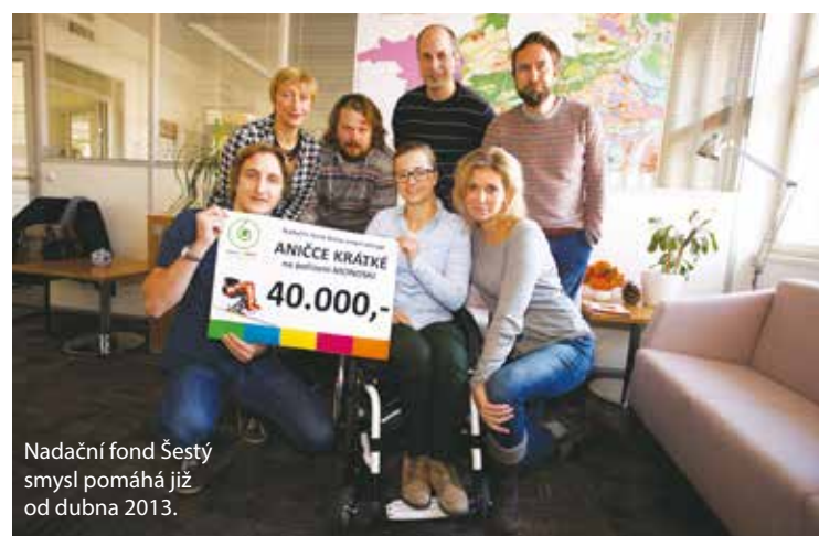
Nadační fond Šestý smysl pomáhá již od dubna 2013.

Jeho třetí ročník je připraven na 11. a 12. prosince v prostorách divadla SEMAFOR. Na návštěvníky čeká bohatý kulturní program, který si budou moci ZDARMA užít po oba dny. Součástí této akce je prodej předmětů od obyvatel Prahy 6, které mohou v mnoha rodinách obohatit štědrovečerní nadílku. Výtěžek z prodeje pomůže dětem umístěným v dětských domovech.