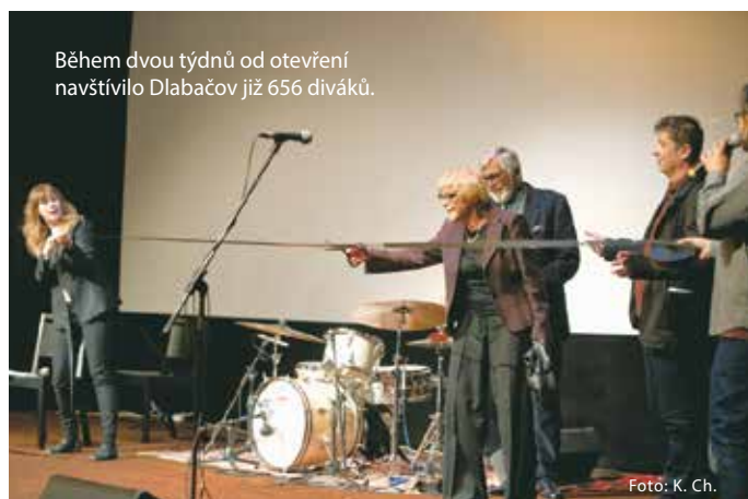
Během dvou týdnů od otevření navštívilo Dlabačov již 656 diváků.

„Filmovou nabídku rozšiřujeme o speciální projekce pro seniory za speciálně upravené vstupné, navazujeme dlouhodobou spolupráci se základními školami v Praze 6 projektem „filmových akademií“. Listopad je opravdu nabitý, program neustále „ladíme“ a šijeme divákům na míru dle jejich potřeb a kritérií,” dodává Charvátová.