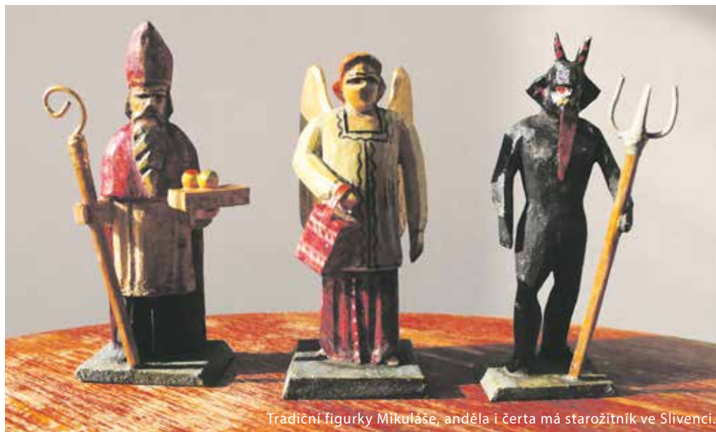
Tradiční figurky Mikuláše, anděla i čerta má starožitník ve Slivenci.