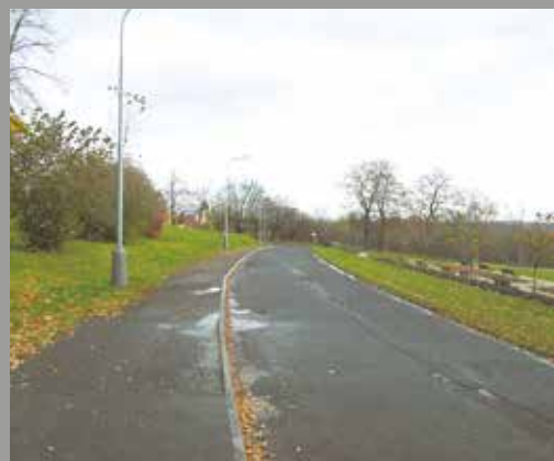
Stávající stav – Turkovská, pohled směrem k Šárecké