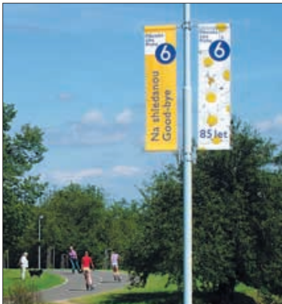
Cedule na hranicích Prahy 6 připomínají, že městská část letos slaví 85. výročí svého vzniku.