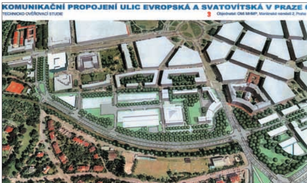
Plánovaný obchvat Vítězného náměstí povede Gymnazijní ulicí od hotelu Diplomat směrem k Pevnostní. Pokračuje po jižní hraně areálu Ministerstva obrany a ústí u Prašného mostu. Tam později naváže na budoucí městský okruh.

Hospodaření je průběžně kontrolováno metodami a postupy dle zákona o finanční kontrole ve veřejné správě. Působí zde vnitřní kontrolní systém úřadu, jehož účinnost mimo jiné sleduje interní auditor. Současně je pravidelně přezkoumáváno hospodaření odborem kontrolních činností magistrátu. Kontrolní výbor zastupitelstva městské části Praha 6 si v plánu své činnosti vyhrazuje prostor pro zařazení kontroly některých významných operací. Veškerá dosavadní zjištění, včetně závěrů externích kontrol mi dovolují konstatovat, že všechny hospodářské procesy jsou transparentní a vykazované výsledky jsou správné.