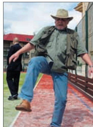
Písničkář Wabi Daněk otevíral hřiště Zvláštní školy ve Vokovicích.