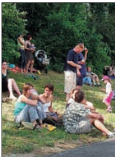
Na festivalu se sešli příznivci muziky snad všechny věkových kategorií.

Pestrou nabídkou hudebních stylů a žánrů přilákal návštěvníky Hanspaulský hudební festival. Ten letos již popáté zorganizovala ZŠ Hanspaulka. Na blízkém hřišti Sokola se sešli milovníci hudby všech věkových kategorií.