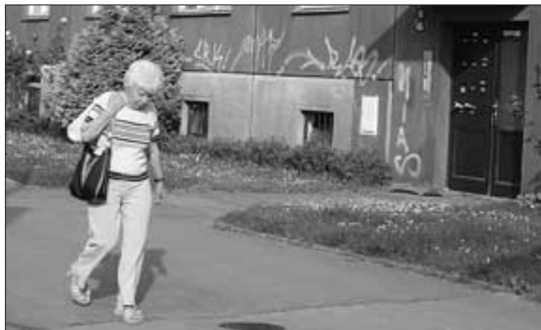
Radnice proti sprejerům dělá, co může. Zapojit se však musí také vlastníci domů.

Už rok po zavedení obecního programu se ukázalo, že počet ploch pomalovaných graffiti poklesl, ale kresby se objevovaly zejména na domech soukromých vlastníků. Radnice jej proto rozšířila i pro ně. „Dnes má každý soukromý majitel nemovitosti možnost přihlásit se do antisprejerového programu. S radnicí podepíše smlouvu, na jejímž základě může firma pověřená radnicí do domu vstoupit, pomalovanou plochu odstranit a ošetřit speciálním nátěrem,“ vysvětluje starosta s tím, že to vše probíhá na náklady městské části. Díky programu tak není důvod, aby sprejerské výtvo-ry na do-