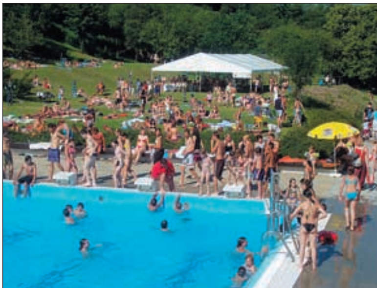
Na Petynce byla po celý den hlava na hlavě. Děti využily možnost koupání zdarma.

Jeden z nejoblíbnějších dnů před začátkem prázdnin strávily děti z Prahy 6 na koupališti Petynka, které bylo celý den zdarma otevřeno hlavně pro ně.