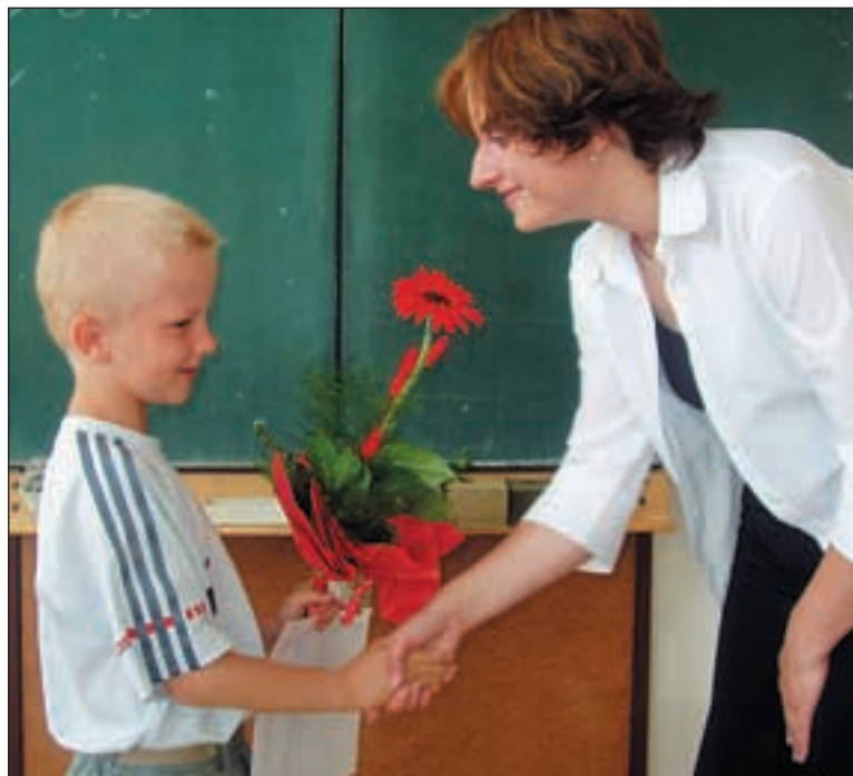
Školáček dostal vysvědčení a míří na prázdniny. Na ZŠ Hanspaulka kvůli rekonstrukci končil školní rok o týden dříve.