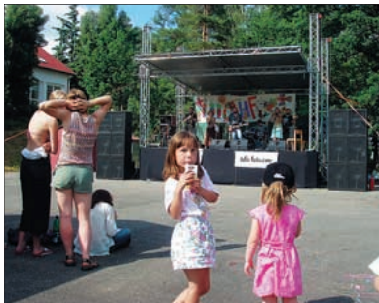
Původní Bureš, skupina z Prahy 6, byla jednou z šesti účinkujících na festivalu. Všechny kapely hrály zadarmo.

některé speciální pomůcky,“ říká ředitelka Pojerová. Akci podpořila radnice, která přispěla na zaplacení zvukaře a půjčení pódia.