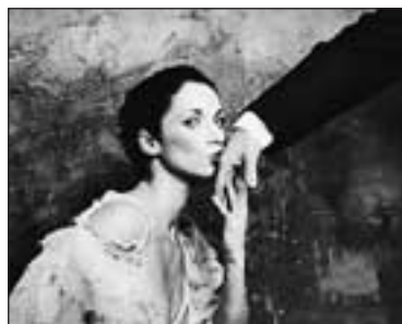
Filmovou komedii Román pro ženy natočil režisér Filip Renč podle stejnojmenného románu Michala Viewegha.