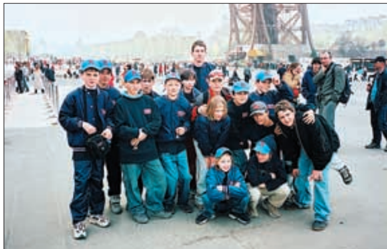
Na turnaj do francouzského Rouen vyjeli basebalisté Kotlářky s dvoudenním předstihem, a tak se výprava podívala na pařížskou Eiffelovku.

kem 2:2. Druhý den turnaje začal boji o postup do odpoledního finále. První proti třetímu, Mannheim proti Paříži, se štěstím zvítězili kluci z Tornados. Druhé semifinále s přehledem vyhrála Kotlářka. Přes nepřízeň počasí byly při finále tribuny obsazené diváky. Jméno po jménu vbíhají do hřiště hráči Kotlářky, po nich hosté z Tornados. Modří z Prahy proti bílým z Mannheimu. Zápas je velmi vyrovnaný, bod po bodu přibývá na obou stranách. Poslední hra v poli, kdy je třeba uhájit skóre 5:5 před závěrečnou dohrávkou se zdařila. Následuje dohrávka při které je třeba získat vítězný bod. Nastupuje pálkař a odpalem se dostává na metu, druhou a třetí „krade“. Nakonec se daří doběhnout domů pro vítězný bod. „Astaslavista, olé!“, zní vítězný pokřik z tribun na počest Kotlářky. První vítězství na mezinárodním turnaji je báječnou zkušeností a cenným skalpem děvčat a kluků z Prahy. Noví kamarádi z francouzského Rouen se na Kotlářku chystají napřesrok.