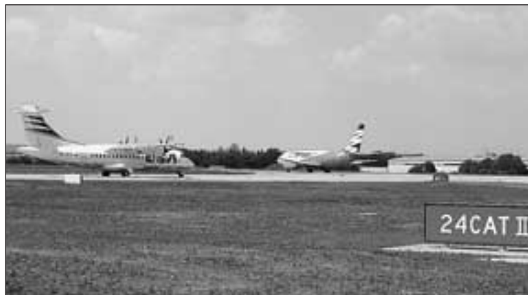
Rychlé výjezdy z přistávací dráhy zvednou počet pohybů letadel o tři za hodinu.

Ruzyňské letiště rok od roku zvyšuje svoji kapacitu. V červnu uvedlo do provozu tzv. rychlé výjezdy z hlavní dráhy.