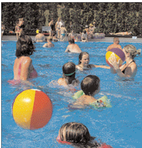
Petynka rozšířila otevírací dobu. Ranní plavci mohou přijít už v 7 hodin ráno, bazén zavírá až ve 21 hod. O horkém květnovém víkendů koupaliště zvládlo nápor 5 a půl tisíce návštěvníků.