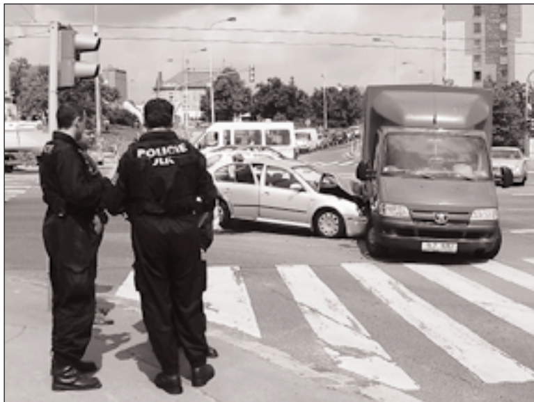
Bouřáčky na Evropské jsou vidět každou chvíli. Ani u této nehody nemusela být škoda tak velká, kdyby řidič dodržel maximální povolenou rychlost. Dopravní policisté průběžně zvyšují kontroly rychlosti v ulicích Prahy 6. V loňském roce zjistili téměř sedm tisíc přestupků při jejím překročení. Řidiči na pokutách za rychlost zaplatili přes pět milionů korun.

Magistrátní průzkum pocitu bezpečnosti zjistil, že ke zlepšení bezpečnosti v Praze by podle jejích obyvatel nejvíce přispělo, kdyby v ulicích bylo více policistů. Více než dvě pětiny občanů by byly ochotny každý měsíc přispívat na zlepšení bezpečnosti ze svého.