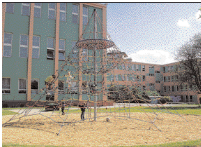
V rámci komplexní rekonstrukce Základní školy Petřiny-jih nechala šestková radnice opravit i venkovní sportoviště. K němu patří i téměř sedm metrů vysoká provazová pyramida za školou, která je veřejně přístupná a děti na ní rády tráví odpoledne.

Z mateřských škol byla letos do rekonstrukce vybrána MŠ Motýlek. „V poslední době stoupá zájem o školky a Motýlek je jedna z těch větších, navíc má hezké zázemí. Současné úpravy by nám v budoucnu umožnily řešit eventuelní zvětšení prostor,“ zdůvodňuje místostarostka s tím, že nyní jde o rekonstrukci kuchyně, topení a úpravu vstupu do školky.