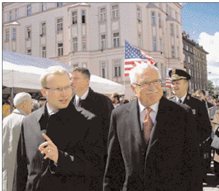
Květnové oslavy šedesátého výročí konce 2. světové války přilákaly na Dejvickou tisíc lidí. Mezi nimi i prezidenta Václava Klause, který v doprovodu starosty Tomáše Chalupy přišel program zahájit.