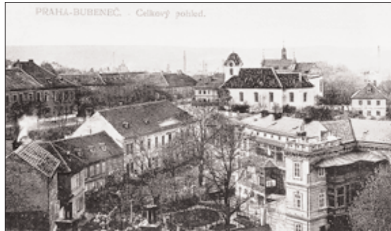
Historické centrum Bubenče s kostelem sv. Gotharda, za ním budova radnice. Uprostřed Schweigerovo nám., vpravo zaniklé pavlačové budovy.

došlo k neblahému zásahu do urbanistního celku. Na náměstí a v jeho okolí vznikly obytné objekty a škola pro sovětské občany a jejich rodiny, kteří zvláště po násilné okupaci 1968 ve stále větším počtu působili v Praze. Tomuto „sovětskému městečku“ padly za obět zdejší historické stavby.