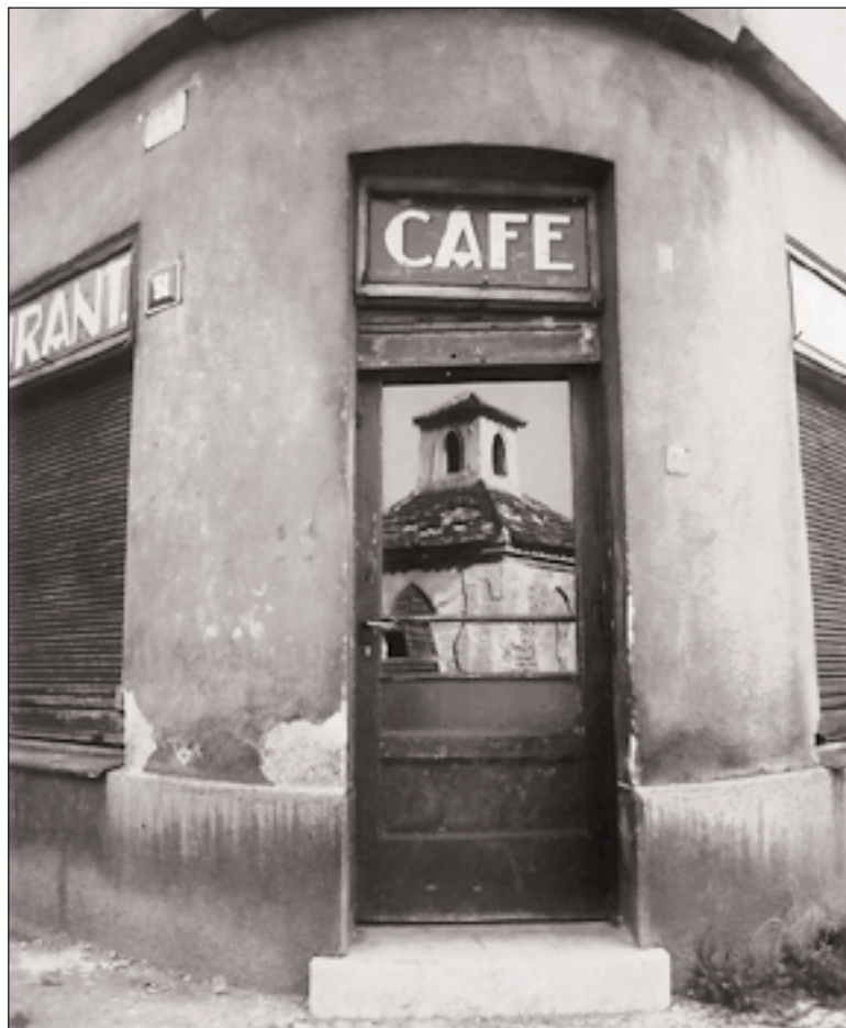
Pohled do zaniklého světa baráček ve Starých Střešovicích otevírají fotografie Jiřího Machta v knize o Praze 6, které jsou na webu radnice.

Radnice Prahy 6 kromě fotografické knihy „Praha 6“ vydala ještě „Knihu o Praze 6“, která poprvé vyšla v roce 1999. Od té doby, také pro velký zájem, proběhly dvě reedice, a to v roce 2002 a 2004. Vloni radnice také vydala knihu u příležitosti oslav 100 let města Bubenče.