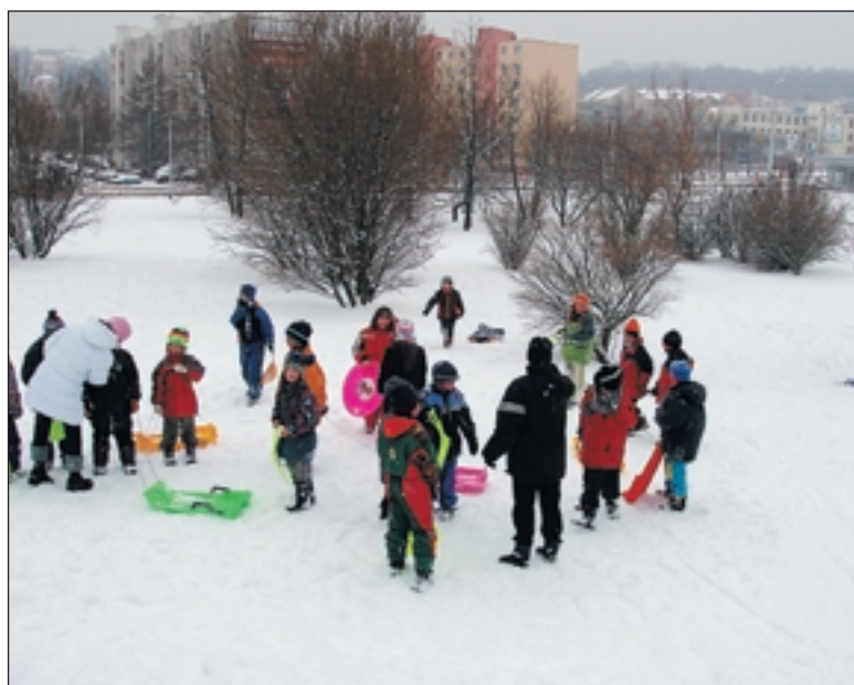
Ježděním „na pekáčích“ si děti mohly zpestřit skoro celý únor. Stačil i malý kopeček jako například u konečné tramvaje na Červeném Vrchu.