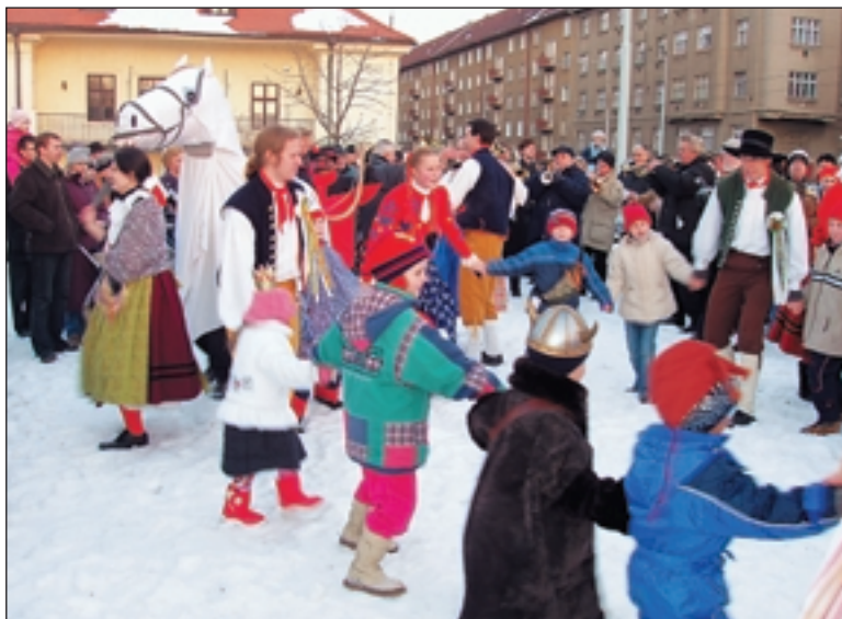
Na louce za Kaštanem se děti zahřívaly tancem, dospělí dali přednost teplému svařáku a jitrnicím od Huderů.

Příležitost nastrojit se do masek nevynechali v žádné škole ani školce.