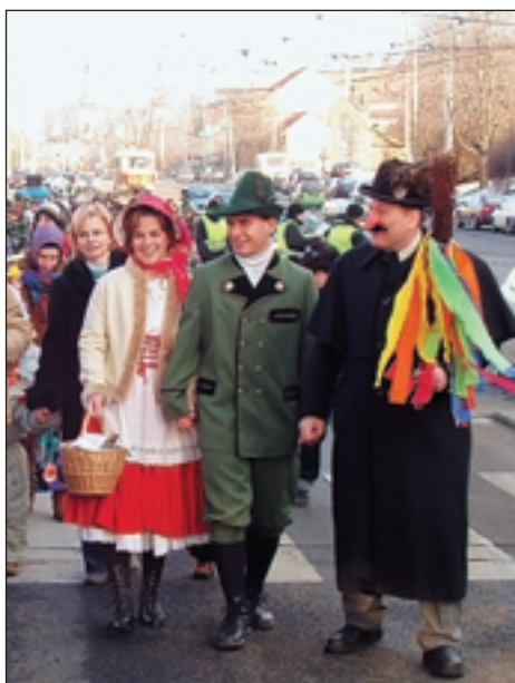
Masopust ovládly pohádkové masky. Průvod se rozrůstal cestou po Bělohorské.

Sněhová nadílka byla letos v Praze opravdu bohatá. Děti si užívaly jako na horách.