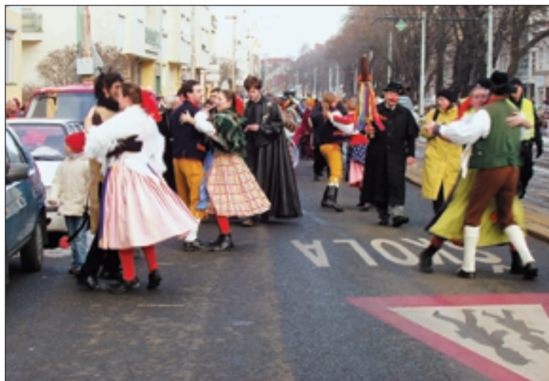
Jak velí tradice, o masopustu musí být veselo. Se souborem Mateník si poskočili i náhodní kolemjdoucí.

Masopust je veselý svátek a poslední příležitost pořádně se najíst masa do zásoby. Hned po něm začínalo období čtyřicetidenního půstu, které končí o Velikonocích. Zahájení masopustu závisí na datu Velikonoc, a proto může masopustní neděle připadnout na kterýkoliv den od 1. února do 7. března. Tučný čtvrtek býval den zabijaček a vepřové pečeně s knedlíkem a zelím. Kdo o Tučném čtvrtku hodoval, zajistil si dostatek sil na celý rok. Vrcholem masopustu bývalo úterý. Kdo měl smysl pro humor, nasadil si masku a vyrazil s průvodem maškár do ulic. Maškary byly všude vítány, pohoštěny a byla kolem nich spousta legrace. Rej masek končil „pochováním basy“ na znamení toho, že si muzikanti delší dobu nezahrají. K masopustu patří koláče, a to především koblihy. Jsou totiž kulaté a zlatavé jako slunce. A slunce, to je jaro, teplo a záruka bohaté úrody.