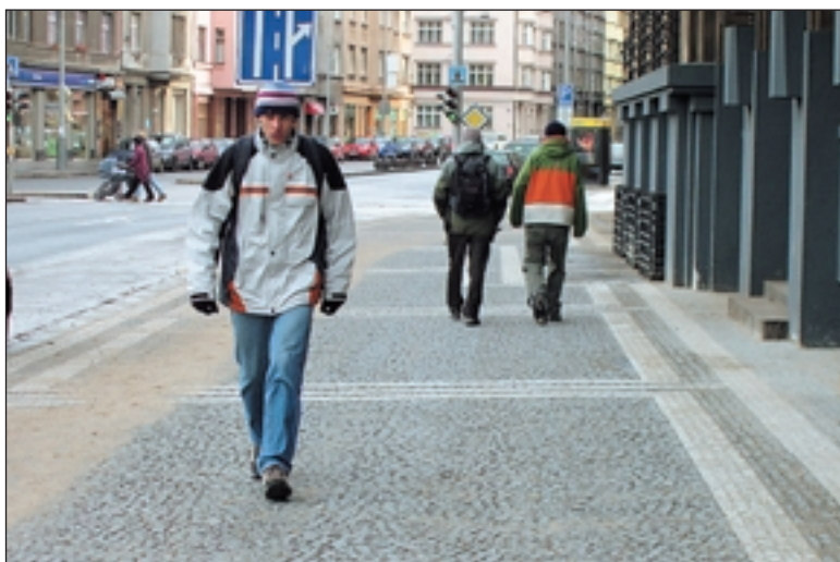
Chodník podél ulice Čs. armády byl opraven koncem loňského roku, a to díky výměně kabelu světelné signalizace. Tu prováděla TSK.