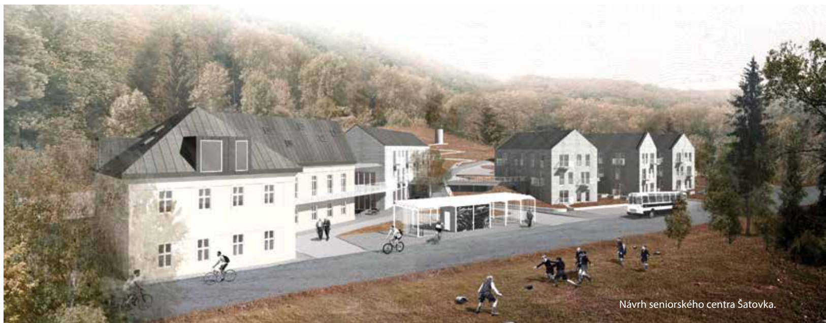
Návrh seniorského centra Šatovka.

NA ÚZEMÍ PRAHY 6 MÁ SÍDLO NĚKOLIK STOVEK ZAPSANÝCH SPOLKŮ – TEDY DOBROVOLNÝCH SDRUŽENÍ NEJMÉNĚ TŘÍ OSOB, JEJICHŽ POSLÁNÍM JSOU VZÁJEMNĚ NEBO VEŘEJNĚ PROSPĚŠNÉ CÍLE. ŘADÍ SE MEZI NĚ KULTURNÍ A SPORTOVNÍ KLUBY, MYSLIVECKÁ SDRUŽENÍ A MNOHO DALŠÍCH. SPECIFICKOU SKUPINU MEZI NIMI TVOŘÍ SPOLKY, OVLIVŇUJÍCÍ VEŘEJNÝ PROSTOR, ROZVOJ ÚZEMÍ A BUDOUCNOST MĚSTSKÉ ČÁSTI.