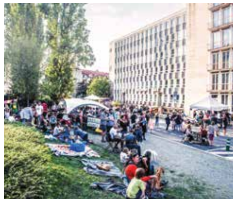
Loňské Zažít Břevnov jinak před břevnovskou poliklinikou.