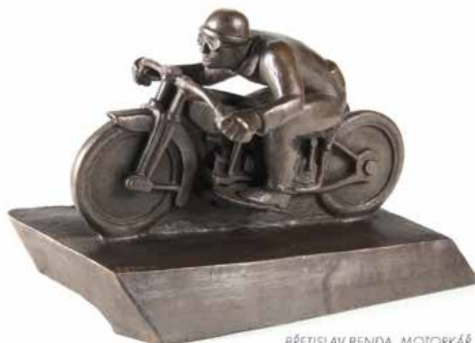
BŘETISLAV BENDA, MOTORKÁŘ Vývolávací cena: 55 000 Kč Dosažená cena: 190 000 Kč

PŘIJÍMÁME UMĚLECKÁ DÍLA A STAROŽITNOSTI DO NAŠICH AUKCÍ