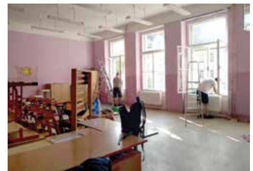
Na Základní škole Marjánka proběhla modernizace topného systému za více než sedm milionů korun.