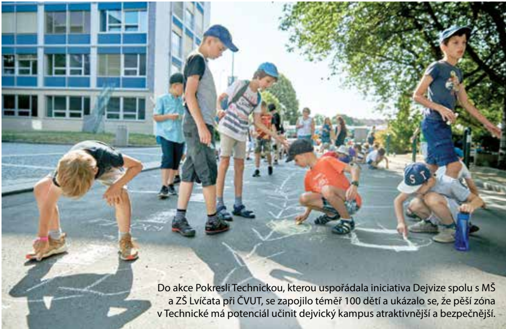
Do akce Pokreslí Technickou, kterou uspořádala iniciativa Dejvice spolu s MŠ a ZŠ Lvičata při ČVUT, se zapojilo téměř 100 dětí a ukázalo se, že pěší zóna v Technické má potenciál učinit dejvický kampus atraktivnější a bezpečnější.