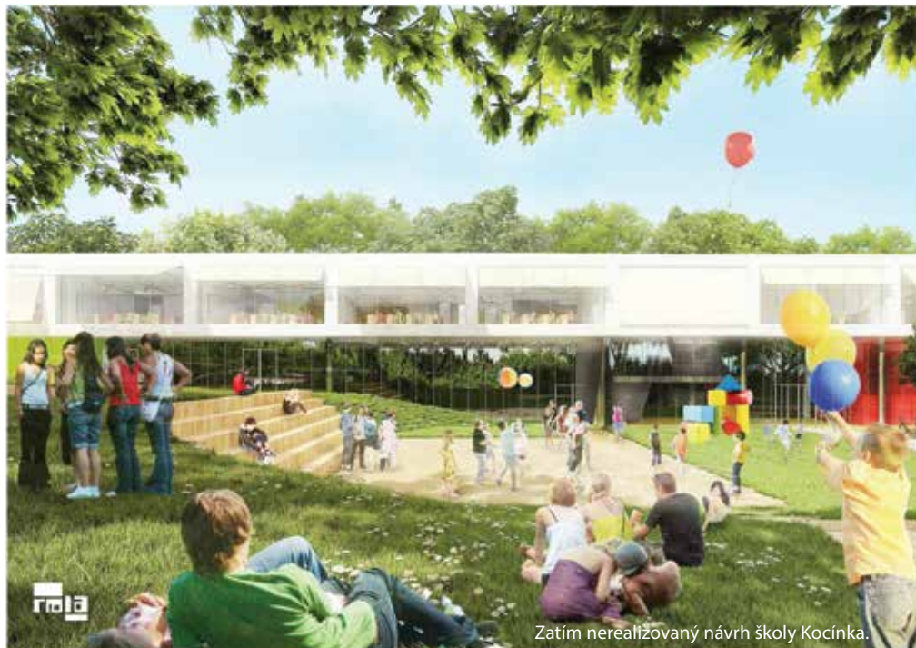
Zatím nerealizovaný návrh školy Kocínka.

Anketa, setkávání s občany, zapojení spolků i sportovních a volnočasových organizací – zhruba rok trvající proces vedl v roce 2017 k vytvoření dokumentu Plán pro Ladronku, strategického dokumentu, který obsahuje sedmnáct opatření, jak v následujících deseti letech toto místo vylepšit a zkvalitnit. Na začátku ovšem byly obavy hlavně lidí z okolí, z dalšího zvyšování kapacity bez toho, aby tomu odpovídalo zázemí nebo přibývalo parkovacích míst. Uživatelé parku zase viděli jako problém sníženou bezpečnost pohybu. Mnozí se báli rozšíření cest na úkor zeleně. Spokojen nebyl nikdo. Radnice proto zahájila proces participace, vytvořila pracovní skupinu pro Ladronku a začala o budoucnosti volnočasového parku diskutovat se spolky i dalšími subjekty, aby vznikl plán, jehož životnost bude delší než jedno volební období. Povedlo se najít shodu, kdy vedení městské části deklarovalo, že nechce na místo přilákat další tisíce návštěvníků, ale že jí jde o zvýšení komfortu,