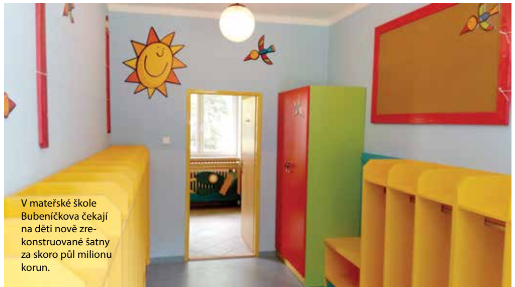
V mateřské škole Bubeníčková čekají na děti nové zrekonstruované šatny za skoro půl milionu korun.

V zařízeních spravovaných Prahou 6 se letos v létě takto prostavělo zhruba čtyřicet milionů korun bez DPH. K největším investicím za téměř dvacet milionů korun patřilo dokončení rekonstrukce mateřské školy Charlese de Gaulla. Probíhala tam sanace obvodového a střešního pláště, modernizace sociálních zařízení, výměna rozvodů a topení, pokládaly se nové podlahy, dělaly omítky a malovalo se. Další větší či menší