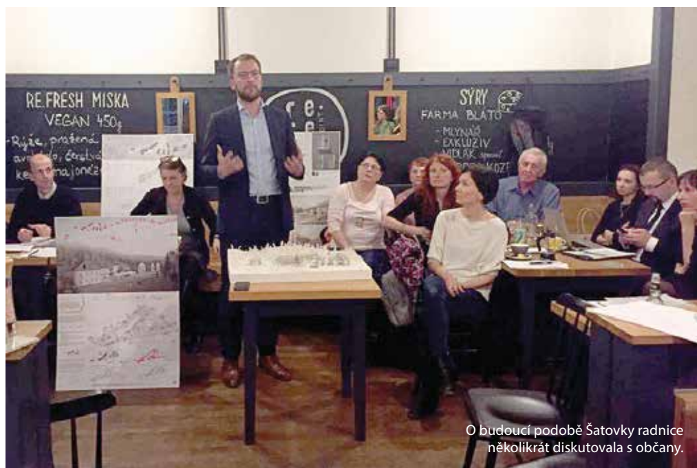
O budoucí podobě Šatovky radnice několikrát diskutovala s občany.

Příklad z posledních týdnů a měsíců. Radnice sedm let čekala na změnu územního plánu, aby místo chátrající usedlosti Šatovka vytvořila seniorské centrum pro své občany. Původní usedlost Šatovky by měla sloužit jednak jako administrativní prostor seniorského areálu, kolem má nově vzniknout zhruba padesátka malometrážních bytů v pěti objektech, k tomu nová budova s technickým zázemím, autobusová zastávka... Místním občanům se projekt nelíbí, vyjadřují názor, že Šárecké údolí je cennou