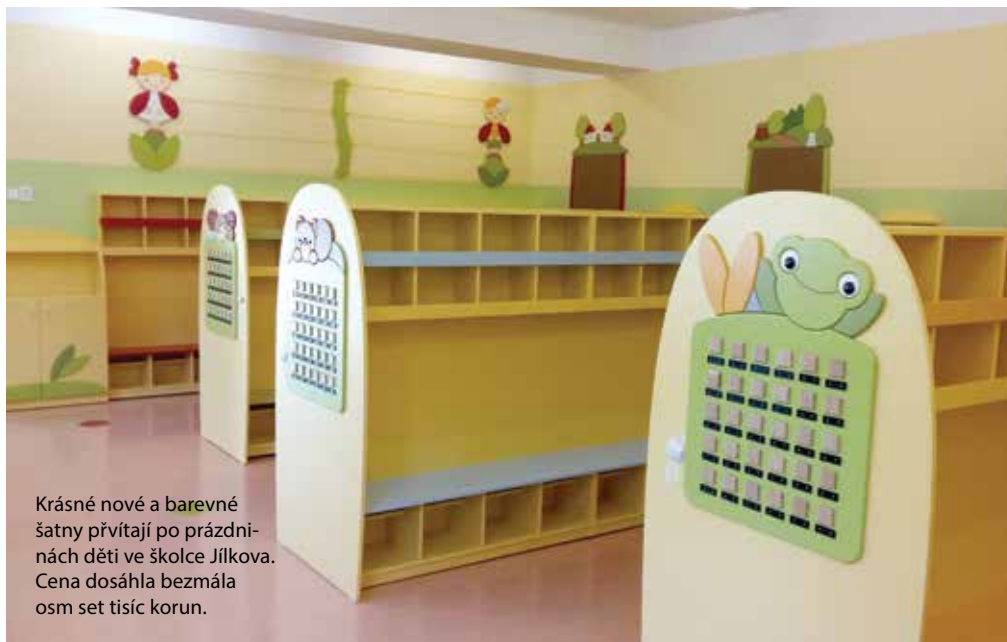
Krásné nové a barevné šatny přivítají po prázdninách děti ve školce Jílkova. Cena dosáhla bezmála osm set tisíc korun.

časový harmonogram a zároveň i kvalitní zpracování,“ říká radní pro školství Marie Kubíková (ODS).