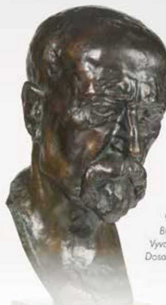
VINCENC MAKOVSKÝ BUSTA T. G. MASARYKA Vývalovací cena: 35 000 Kč Dosažená cena: 250 000 Kč

PŘIJÍMÁME UMĚLECKÁ DÍLA A STAROŽITNOSTI DO NAŠICH AUKCÍ