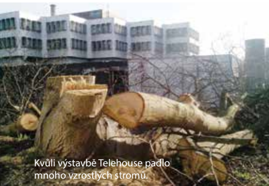
Kvůli výstavbě Telehouse padlo mnoho vzrostlých stromů.

Všichni ještě pamatujeme horké letní dny, v nichž ulice sálaly a byli jsme rádi za každý strom, který dával stín. Radnice Prahy 6 v červnu vyhlásila stav klimatického ohrožení, jako základní opatření uvádí zelené střechy, vyšší trávu a lepší hospodaření s dešťovou vodou. Také hodlá zakázat jednorázové plasty, podpořit elektromobilitu a zvýšit počet vodních prvků. V první řadě by ale měla Praha 6 chránit vzrostlou zeleň, kterou nám tu zanechaly předcházející generace a která přirozeně plní funkci přírodní „klimatizace“.