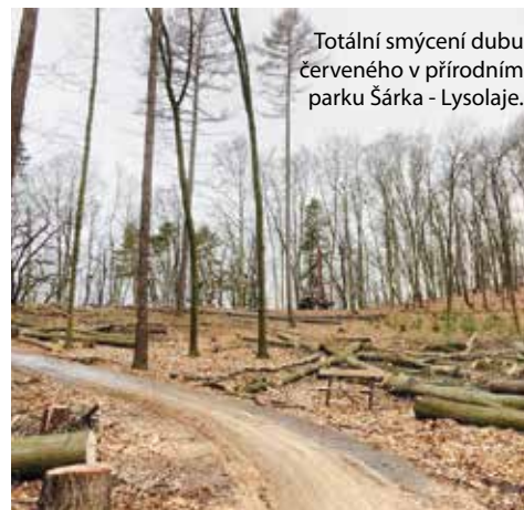
Totální smýcení dubu červeného v přírodním parku Šárka - Lysolaje.