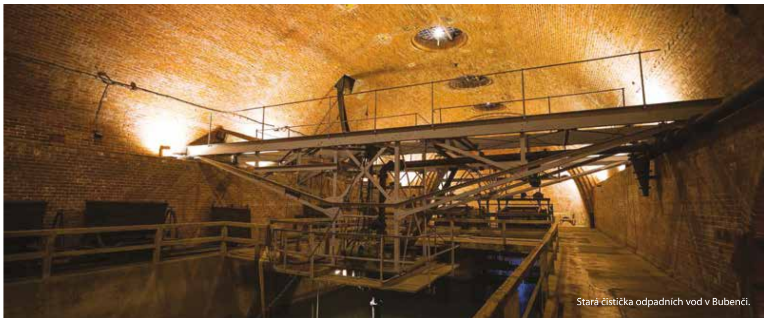
Stará čistička odpadních vod v Bubenci.