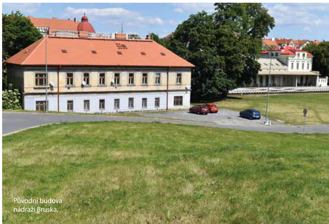
Původní budova nádraží Bruska.