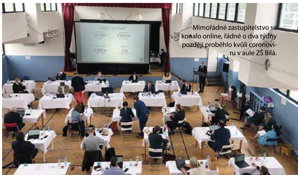
Mimořádné zastupitelstvo se konalo online, řádné o dva týdny později proběhlo kvůli coronavirovu v aule ZŠ Bílá.

Zastupitelé měli na jednání zařazený pouze jeden bod, a to využití nabídky předkupního práva na odkoupení jedné šestiny domu včetně pozemku v Dejvické ulici od dvou vlastníků. Tento bod už se na jednání i v komisích objevil poněkolkrát. Stalo se, že už zastupitelé jednou