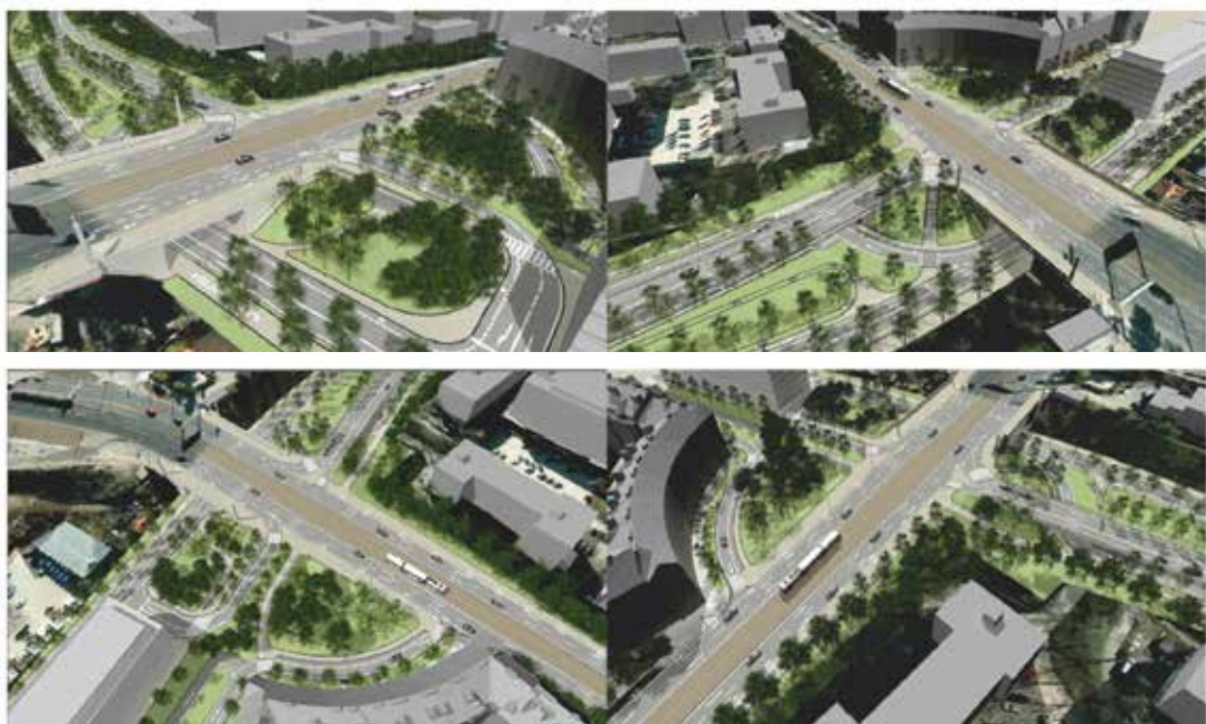
▲ Vizualizace možného budoucího řešení křižovatky Svatovítské a Václavkovy ulice.

Institut plánování a rozvoje hlavního města Prahy je příspěvková organizace, hlavní koncepční pracoviště v oblasti architektury, urbanismu, rozvoje a tvorby hlavního města. Spolupracuje na významných rozhodnutích v těchto oblastech, zpracovává a koordinuje dokumenty v oblasti strategického a územního plánování a rozvoje, veřejného prostoru a dokumenty dopravní, technické, krajinné a ekonomické infrastruktury.