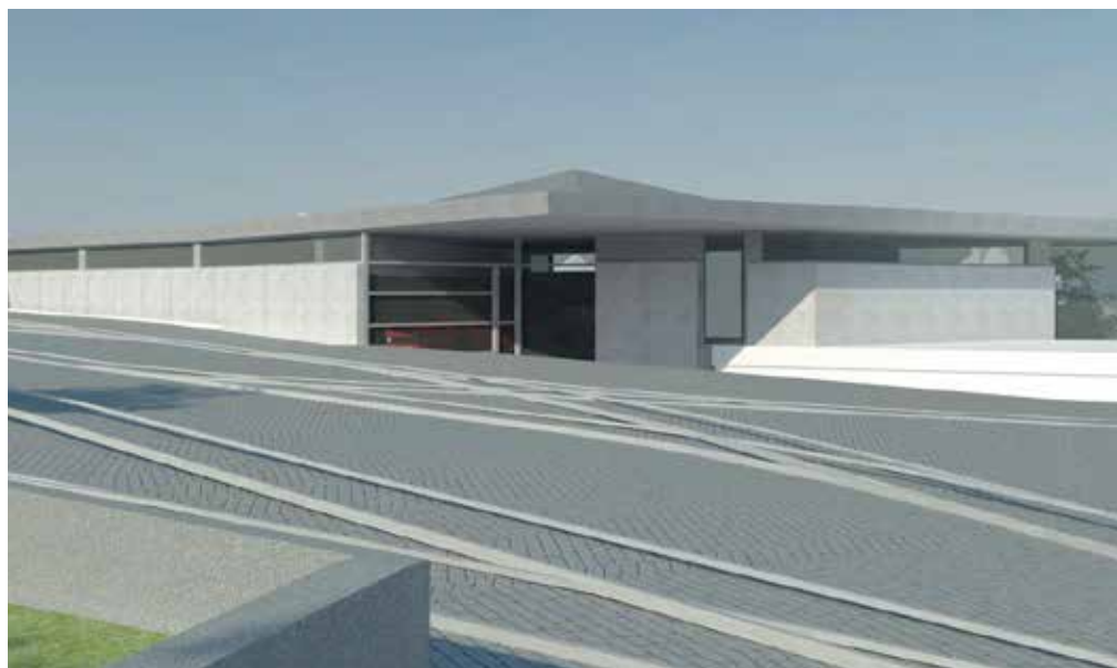
▲ Pohled z kolejiště vozovny na novou halu muzea / zdroj: bomart.

V současnosti probíhá příprava výběru zpracovatele projektové dokumentace včetně zajištění všech potřebných povolení pro realizaci stavby. Pokud nedojde k neočekávaným komplikacím, stavět by se mělo v letech 2022 až 2023.