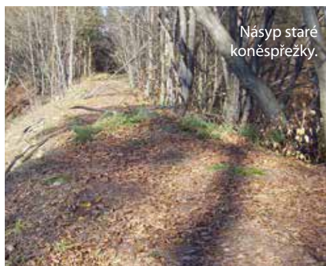
Násyp staré koněspřežky.

Rozvoj těžby uhlí na Kladensku v polovině 19. století, kterým se tehdy vytápěly tisíce domácností v Praze, si vyžádal i výkonnější dopravní prostředek. Z tohoto důvodu byla v roce 1852 založena Buštěhradská železniční společnost, která 1. ledna 1855 obdržela od císaře Františka Josefa I. koncesi k provozování parostrojní železnice. Jako první byla zmodernizovaná část Staré Kladno – Kralupy nad Vltavou. Na jaře roku 1963 podala žádost o provozování lokomotivní trati Vejhybka – Bruska a už na podzim téhož roku po trati projely první vlaky. Při tom těleso koněspřežné železnice se využilo zhruba z poloviny, ostatní úseky dráhy byly postaveny nově. Původní trasa se zároveň napřímila, tím také zkrátila, a navíc došlo k upravení sklonu, hlavně mezi Bruskou a Veleslavínem. Tam se postavilo nové nádraží a přibyla i trasa v Liboci. Za další čtyři roky se pro lokomotivy zmodernizovala i část do Lán. Tak zanikla jedna z prvních koňských drah v Čechách.