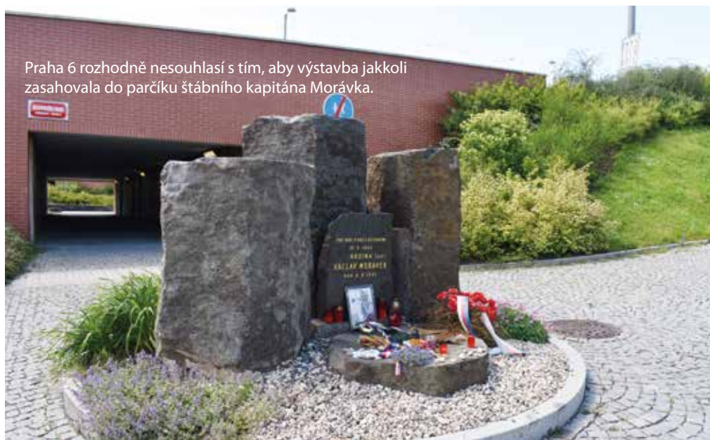
Praha 6 rozhodně nesouhlasí s tím, aby výstavba jakkoli zasahovala do parčíku štábního kapitána Morávka.