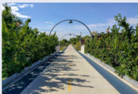
Bývalá železniční trať Bloomingdale Line v americkém Chicagu.