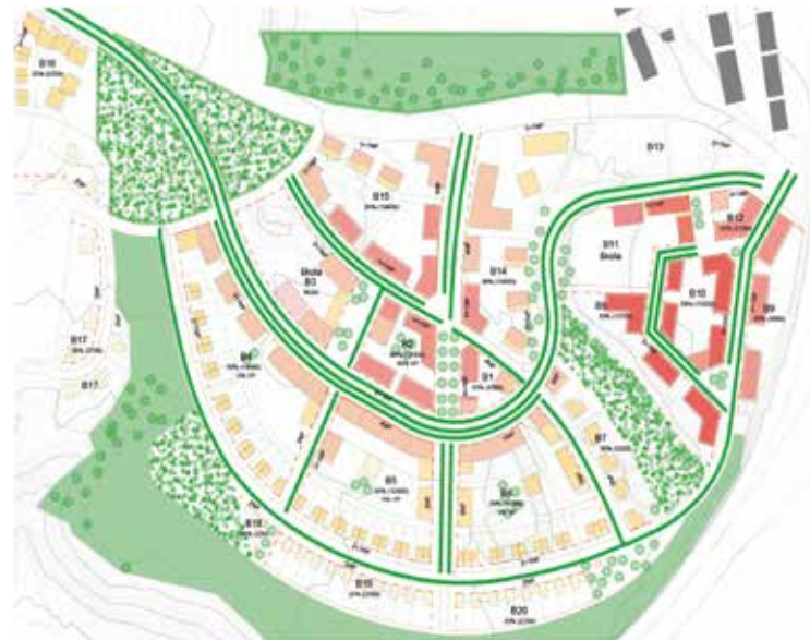
▲ Pracovní verze řešení komunikací v Novém Sedlci, vpravo navíc s návrhem možné zástavby