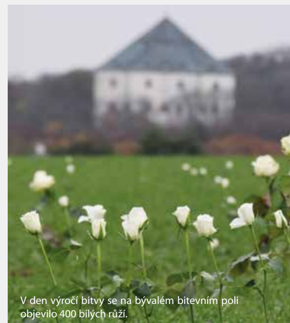
V den výročí bitvy se na bývalém bitevním poli objevilo 400 bílých růží.