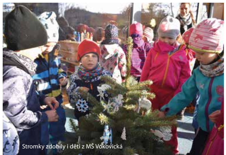
Stromky zdobily i děti z MŠ Vokovicová