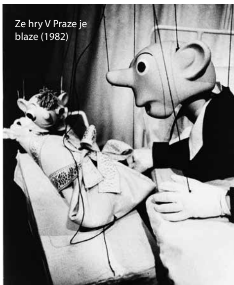
Ze hry V Praze je blaze (1982)

Pro děti hraje divadlo S+H hry v takzvaném kukátku. Konstrukce, kde stojí vodiči a vodí loutky, je zcela vykryta okýnkem a také kulisami, děti tak vidí pouze loutky a děj na scéně. Protože je konstrukce poměrně vysoká a vodiči na ni stoupají po schůdcích, i nitě loutek jsou