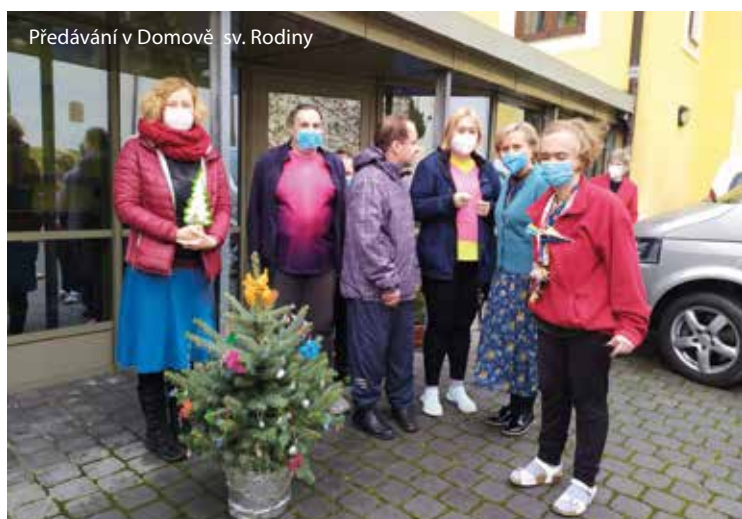
Předávání v Domově sv. Rodiny

ly jen u zdobení a do domovů poslaly dopisy, obrázky nebo perníčková přáníčka. Stromky už ode dneška dělají radost v Domově sv. K. Boromejského, v domě seniorů Elišky Purkyňové, v DPS Šlejnická, LDN Chittussiho, ale také třeba v Azylovém domě pro muže K srdci klíč nebo v Domově sv. Rodiny.