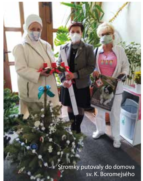
Stromky putovaly do domova sv. K. Boromejského

Iniciátorem celého nápadu byla mateřská škola v Liboci, která svůj stromek zdobila pro nedaleký dům s pečovatelskou službou. Zapojily se také MŠ Čínská, Červený Vrch, Sbíhavá, Vokovicová, E. Destinové a waldorfská školka. Všechny stromečky jsou nazdobené originálními, dětmi vyráběnými ozdobami. Školky často nezusta-