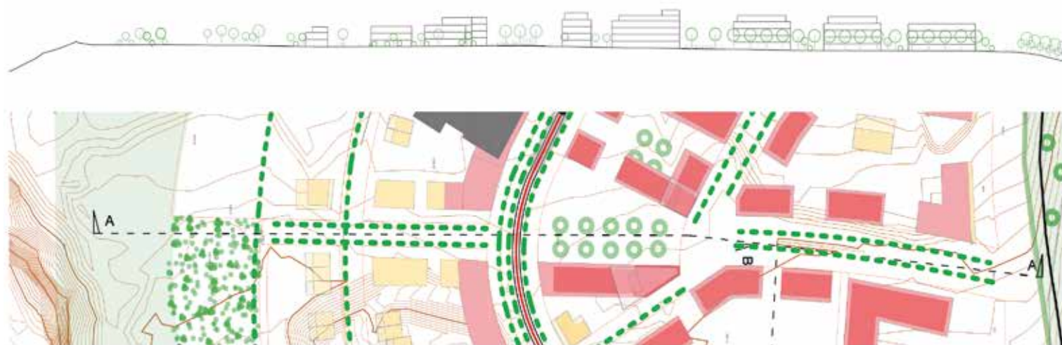
Návrh výškové úrovně domů v části Nového Sedlce