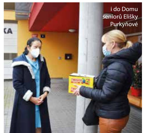
i do Domu seniorů Elišky Purkyňové

ly jen u zdobení a do domovů poslaly dopisy, obrázky nebo perníčková přáníčka. Stromky už ode dneška dělají radost v Domově sv. K. Boromejského, v domě seniorů Elišky Purkyňové, v DPS Šlejnická, LDN Chittussiho, ale také třeba v Azylovém domě pro muže K srdci klíč nebo v Domově sv. Rodiny.