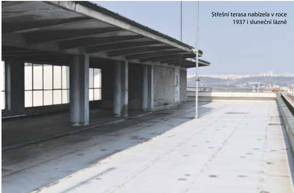
Střešní terasa nabízela v roce 1937 i sluneční lázně

se schylovalo k válce, je součástí společných prostor i podzemní kryt, do nějž se vešli všichni nájemníci. Pro případ zavalení měl druhý vchod, který vedl doprostřed zahrady.