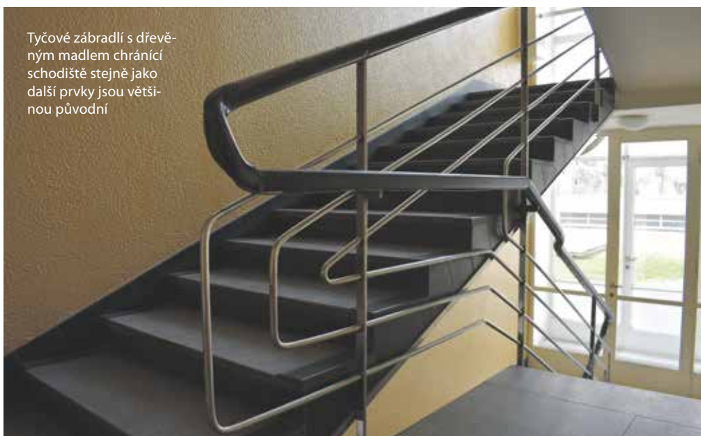
Tyčové zábradlí s dřevěným madlem chrání schodiště stejně jako další prvky jsou větší původní