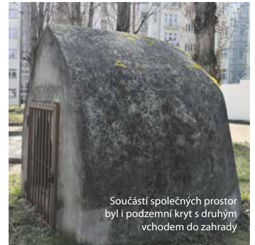
Součástí společných prostor byl i podzemní kryt s druhým vchodem do zahrady