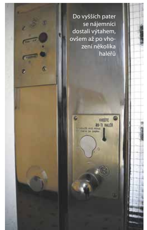
Do vyšších pater se nájemníci dostali výtahem, ovšem až po vhození několika haléřů