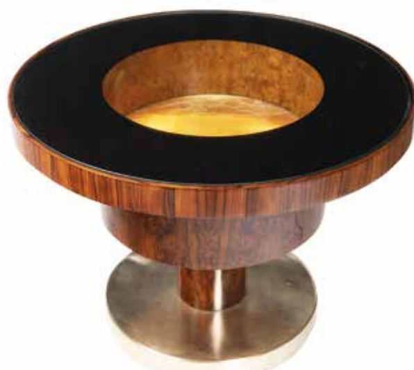
KULATÝ STOLEK ART DECO / ZAHRADNÍ AUKCE 2020 / Dosažená cena 93 000Kč

PŘIJÍMÁME UMĚLECKÁ DÍLA A STAROŽITNOSTI DO NAŠICH AUKCÍ