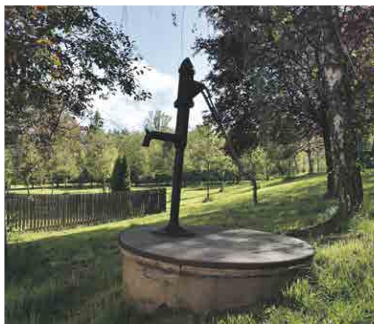
Ulice Sartoriova, Břevnov