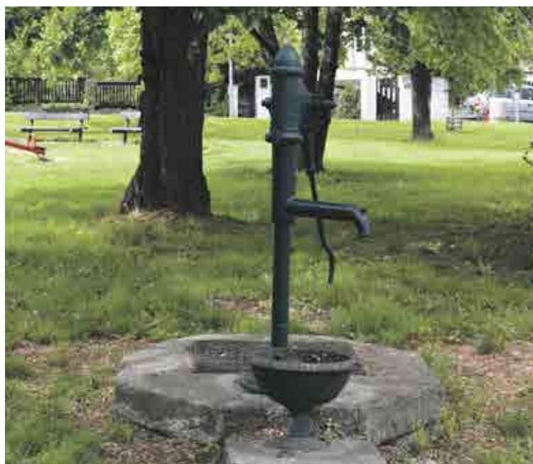
Na Čihadle, Dejvice