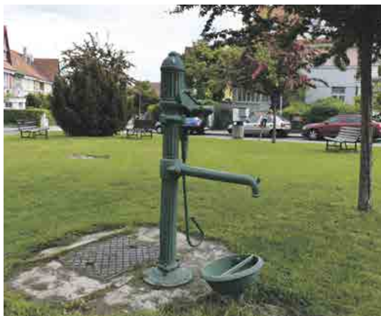
Ulice Klidná, Střešovice