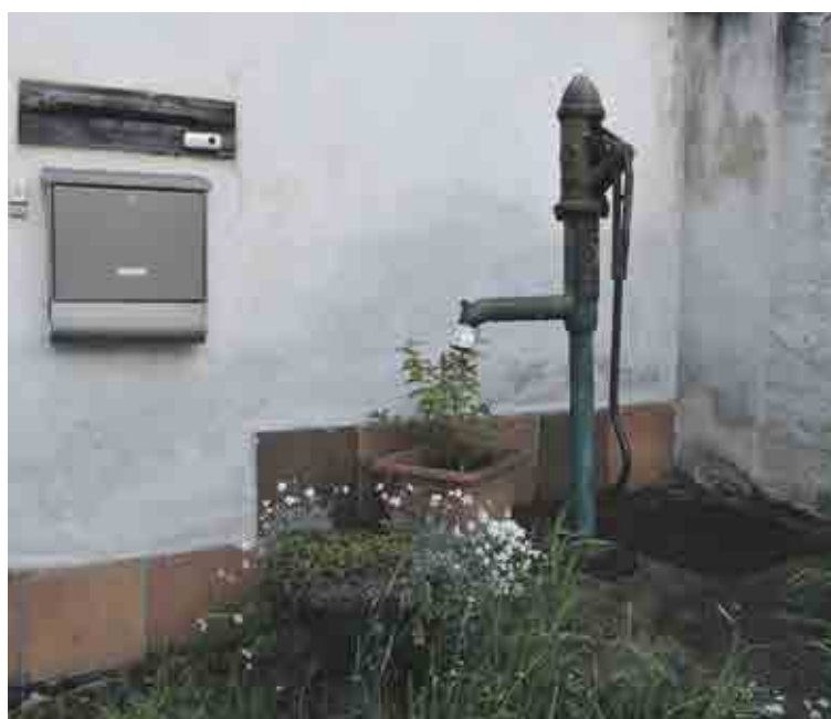
Na Kocourkách, Střešovice

byly jich vyrobené stovky tisíc kusů a repliky se dají koupit dodnes. Je zajímavostí, že se vyráběly jen v modré a zelené barvě. Vyměnit kus za kus není tolik složité. Problematičtější je renovace starých litinových pump, zpravidla zdobených různými motivy, například hlavami zvířat. Na území Prahy 6 se jich nachází asi sedm. „Mají-li roztrhané horní hlavě, rádla či