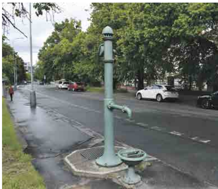
Ulice Kolejní, Dejvice

Proměny na pítko se zřejmě dočká pumpa ve Východní ulici. „Nachází se blízko Macharova náměstí, kde se připravuje rekonstrukce zázemí pro tenisové kurty. Proto mě napadlo pumpu, která je tam poměrně skrytá, přenést blíž k tomu areálu, napojit ji na vodovodní řad a udělat z ní pítko, kde by sloužilo dětem i sportovcům,“ vysvětluje Karel Fronk, iniciátor této změny, který se mechanickými pumpami zabývá nejen na svých stránkách studne-pumpy.webnode.cz .