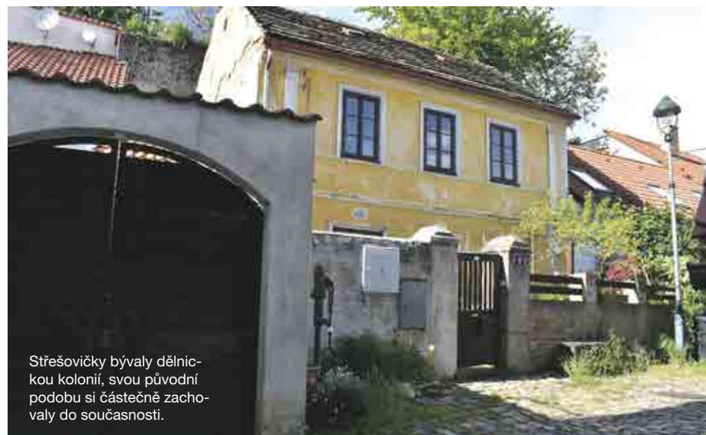
Střešovičky bývaly dělnickou kolonií, svou původní podobu si částečně zachovaly do současnosti.