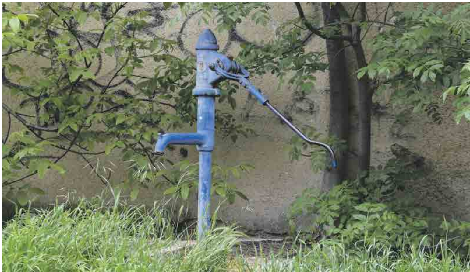
Pumpa v ulici Nad Šárkou v Dejvicích