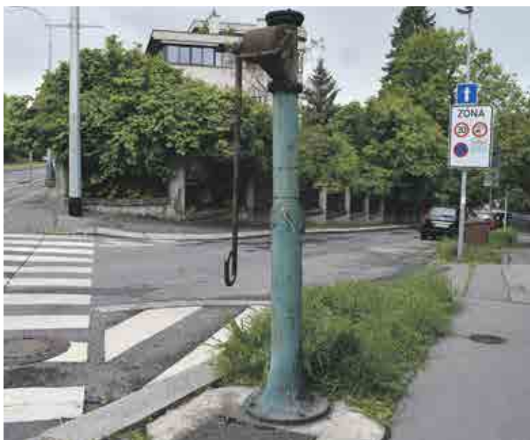
Na pěkné vyhlídce, Střešovice