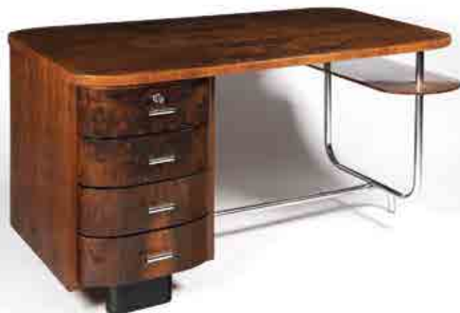
JINDŘICH HALABALA / PSACÍ STŮL / ZAHRADNÍ AUKCE 2021 / Vytolávací cena: 50 000 Kč

PŘIJÍMÁME UMĚLECKÁ DÍLA A STAROŽITNOSTI DO NAŠICH AUKCÍ