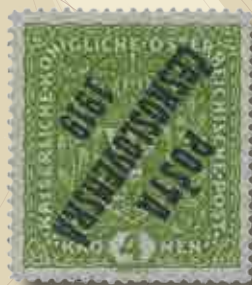
1919, Znak 4K žilkovarý papír s převráceným přetiskem PČ 1919. Nejvzácnější československá známka. Prodáno za rekordní cenu: 9.300.000 Kč

DO NAŠICH PRESTIŽNÍCH AUKCÍ PŘIJÍMÁME VZÁCNÉ POŠTOVNÍ ZNÁMKY, AUTOGRAFY, BANKOVKY A VYZNAMENÁNÍ.