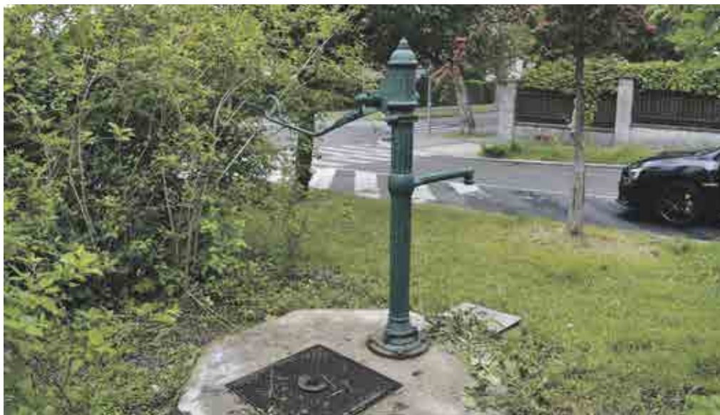
Ulice Východní, Střešovice

jiné části, musí se najít kovář, který umí pracovat s litinou, což je velmi náročné. Ale tyto firmy tady existují, a i taková umělecká díla dokážou krásně opravit, jak dokazují příklady z jiných městských částí,“ doplňuje Karel Fronk, který za nejkrásnější z šestkových pump považuje tu u Bílkovy vily. Podobná, jen na jiném místě Prahy, už je označená za kulturní památku a chráněná. Zajímavým doplňkem jsou i nádoby, které pumpy většinou doplňovaly. Zpravidla se odlévaly a vyráběly spolu s nimi.