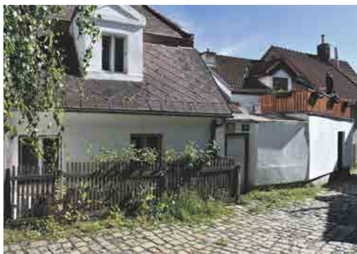
Památková zóna Střešovičky