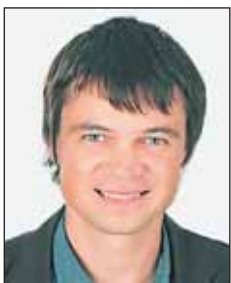
MUDr. Lukáš Pollert, lékař a kanoista, držitel zlata z olympijských her v roce 1992

Tenkrát, v roce 2002 nám Vltava odebrala příjemný divadelní sálek v Karlíně, my jsme se museli toulat po Praze a hrát tam, kde nás, alespoň na chvíli, nechali. A pak se náhle ohlásil Úřad Prahy 6 s velkorysou nabídkou, které, přiznám se, jsem tak úplně nevěřil. Zmíněný Úřad se nabídl, že nám zbuduje nové divadlo. V roce 2005 se začalo v Dejvicích 27 hrát. A dodnes s uznáním sledujeme, jak se Úřad této městské části stará o to, aby ta skvělá čtvrť byla sličná, vlídná a kulturní. Děkujeme.