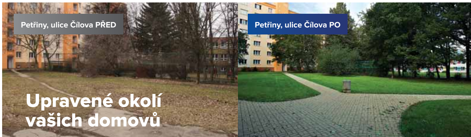
Petřiny, ulice Čílova PŘED