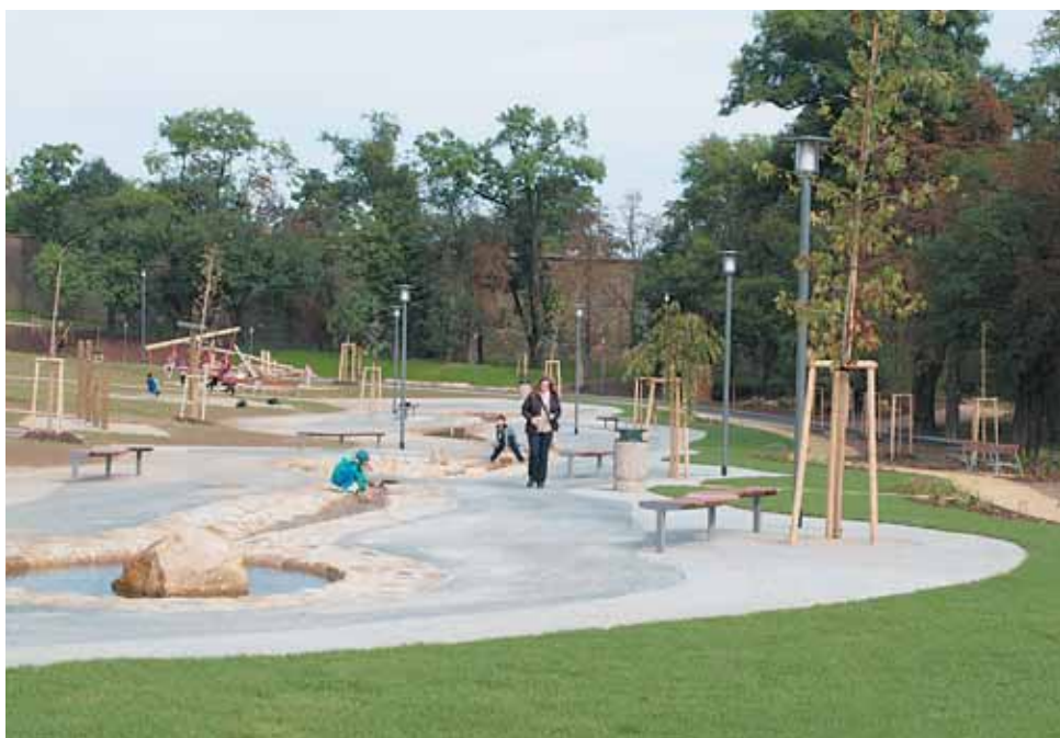
Podél Patočkovy ulice vznikl v místě, které sloužilo v posledních letech jako staveniště pro tunel Blanka, park pro všechny generace. Praha 6 přispěla na zajímavé herní prvky.