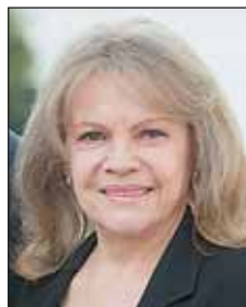
Eva Pilarová, zpěvačka a čestná občanka Prahy 6

Vždy se řídim svým osobním pojetím "konzervatismu" a to mi mj. říká, že by bylo dobré, kdyby to, co radnice Prahy 6 pod vedením ODS dokázala, zůstalo takové, jaké to je. Jsem spokojen zejména s tím, jak se ODS při vedení radnice Prahy 6 stará o moderní historii, což se projevuje např. v jejím vztahu k letcům druhé světové války, péčí o politické vězně z 50. let, ke kterým má trvalý vztah, až po to, že umožňuje existenci muzea bigbítu.