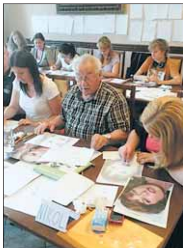
Kreslení může být pro každého.