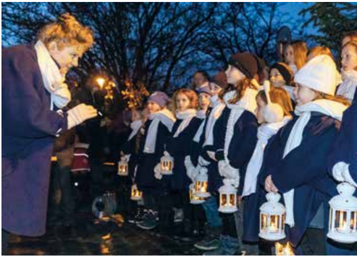
Vánoce v Praze 6