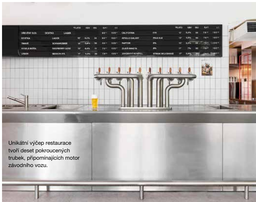
Unikátní výčep restaurace tvoří deset pokroucených trubek, připomínajících motor závodního vozu.