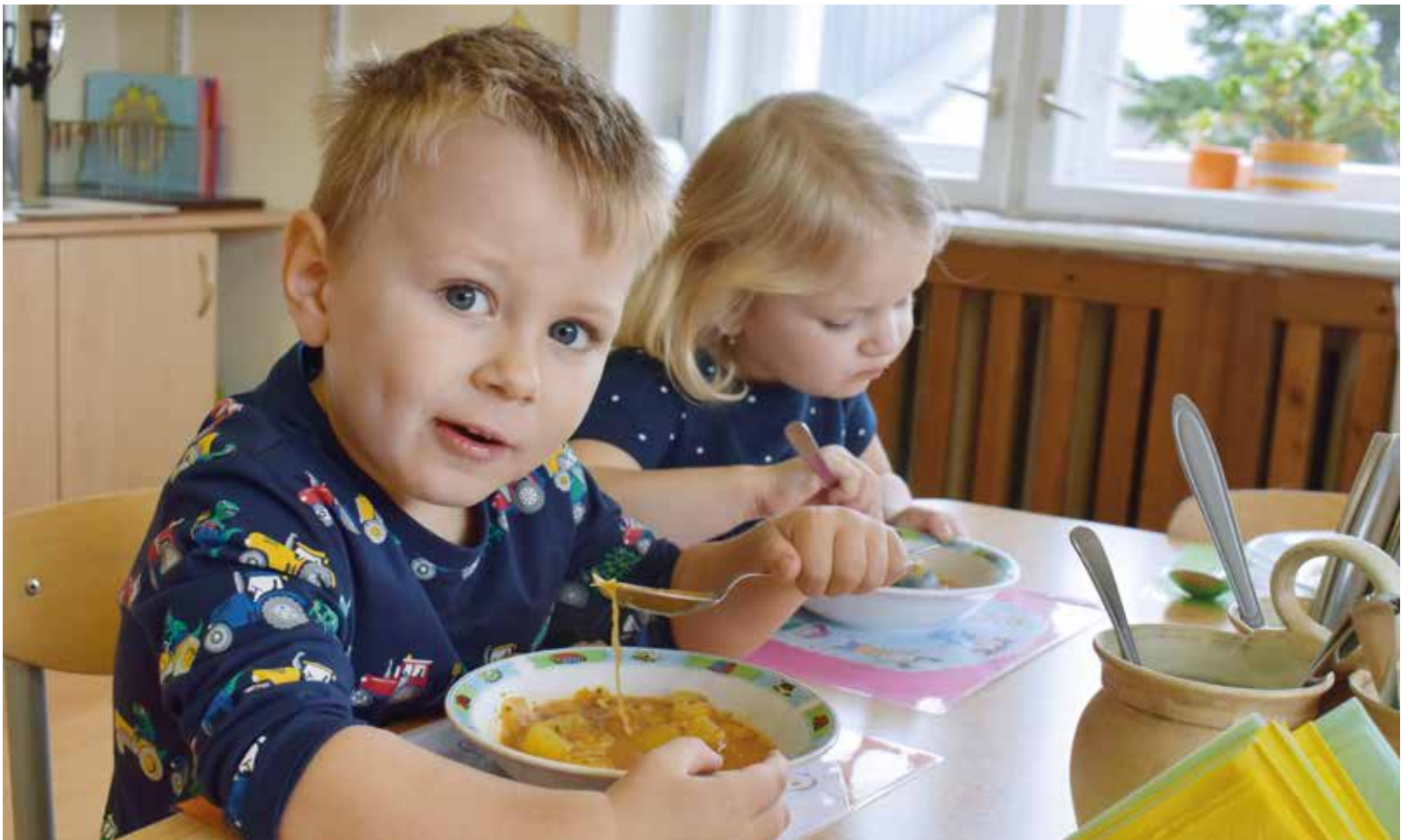
Radnice pomůže rodičům, zaplatí dětem obědy