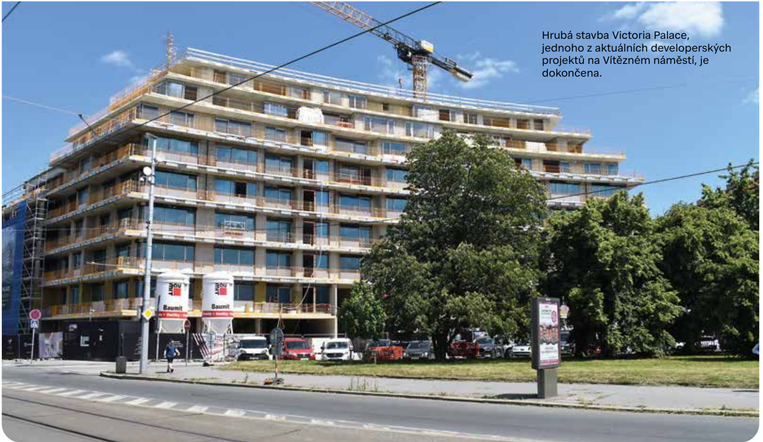
Hrubá stavba Victoria Palace, jednoho z aktuálních developerských projektů na Vítězném náměstí, je dokončena.