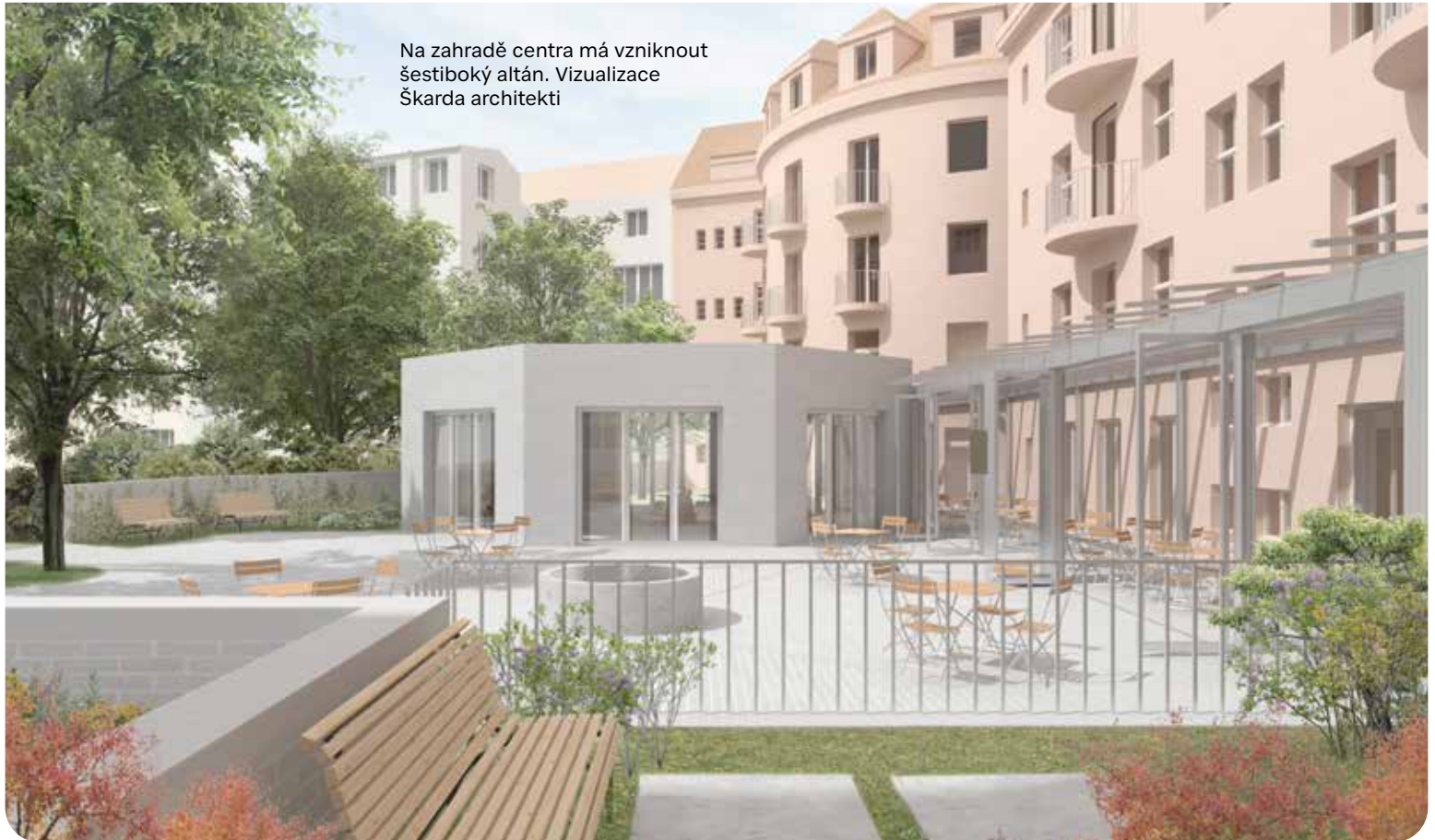
Na zahradě centra má vzniknout šestiboký altán. Vizualizace Škarda architekti