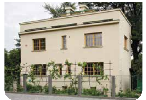
Rothmayerova vila. Muzeum města Prahy. Autor: Martin Polák

Mohli zde navštívit hned několik pozoruhodných ukázek české avantgardy a moderny, především Müllerovu vilu ve Střešovicích a Rothmayerovu vilu na Břevnově. Obě společně s dalšími deseti domy v různých částech Česka patří do prestižní mezinárodní sítě Iconic Houses, která sdružuje téměř dvě stovky výjimečných staveb 20. století po celém světě. Experti si také prohlédli vilu Palička na Babě a celé sídliště Baba. Přednášky probíhaly v Národní technické knihovně, jedné z nejlepších staveb české moderní architektury. Vrcholem konference letošního roč-