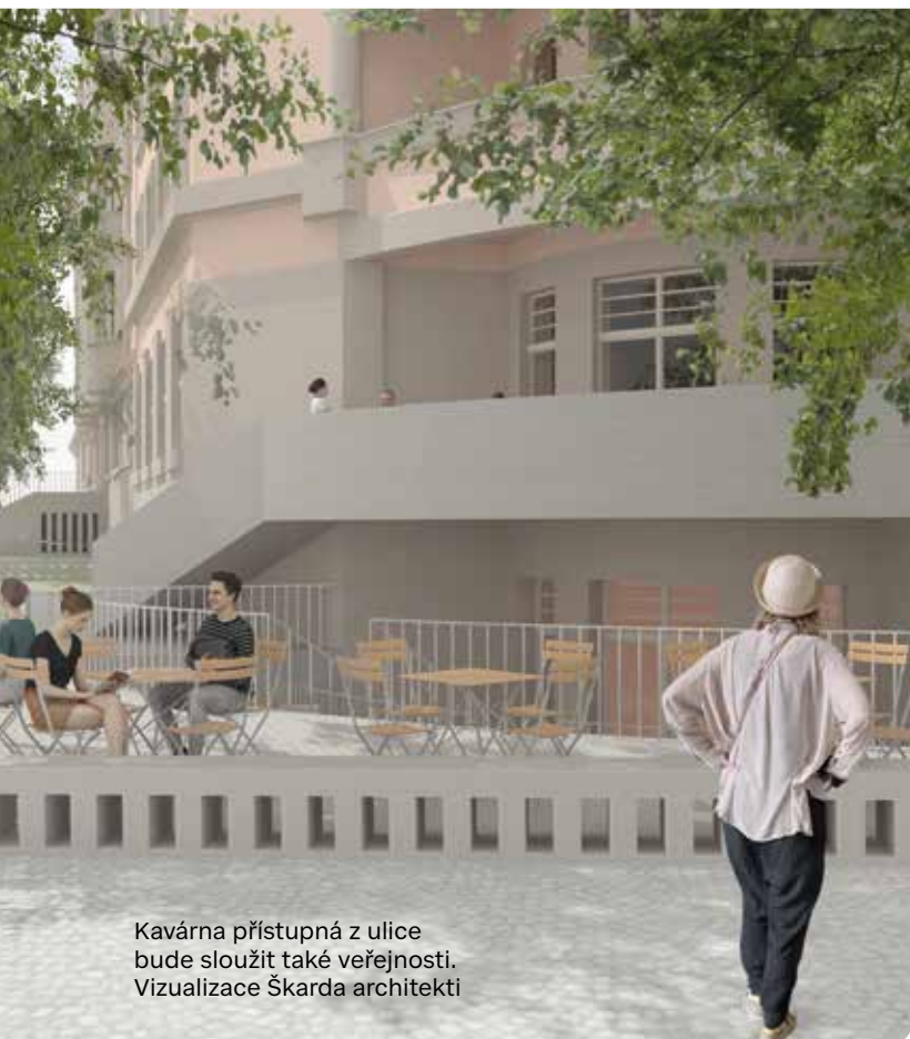
Kavárna přístupná z ulice bude sloužit také veřejnosti. Vizualizace Škarda architekti

Seniorské centrum Šatovka – projekt, který počítá s opravou staré usedlosti a dostavbou několik domů s malometrážními byty, prošel několika úpravami, a to po diskuzi městské části a obyvatel Šáreckého údolí. Nyní Praha 6 čeká na novou změnu územního plánu, poté bude pokračovat příprava potřebných dokumentací na základě vítězného architektonického návrhu.