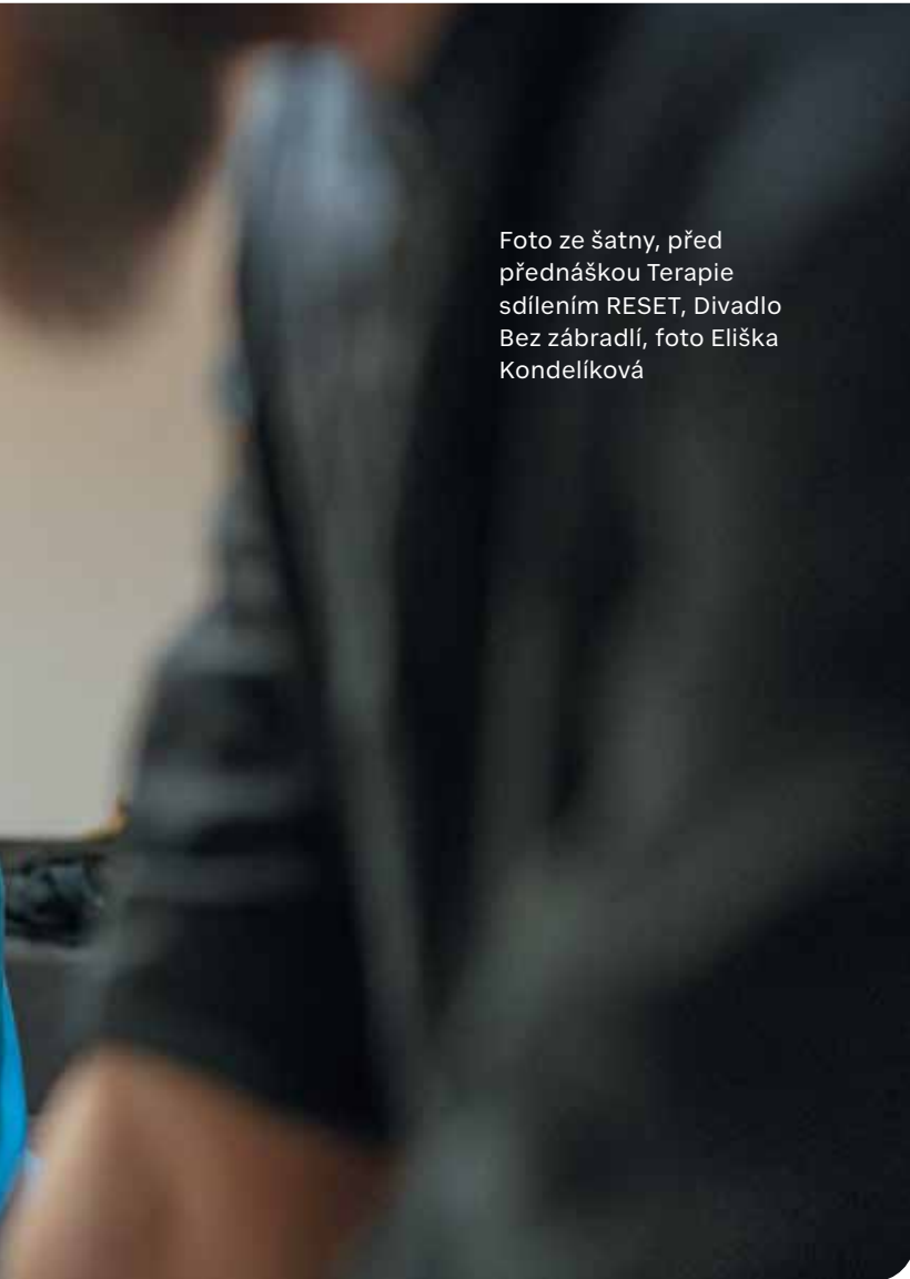
Foto ze šatny, před přednáškou Terapie sdílením RESET, Divadlo Bez zábradlí

kam chodíme venčit fenku Lišku. Je prázdný a holý, což je mi na jednu stranu příjemné, takových míst moc v Praze nemáme, ale myslím si, že kdyby se tam vysázely nějaké rostliny nebo vysoké trávy, bylo by to elegantnější.