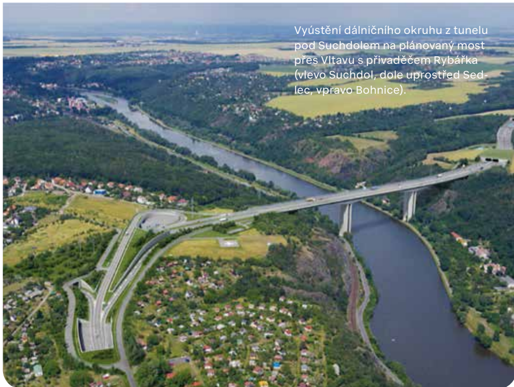
Vyústění dálničního okruhu z tunelu pod Suchdolem na plánovaný most přes Vltavu s přivaděčem Rybářka (vlevo Suchdol, dole uprostřed Sedlec, vpravo Bohnice).