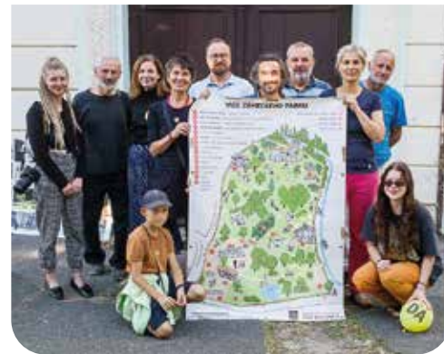
Tým organizátorů Dne architektury zámek Veleslavín

Součástí Dnů architektury ve Veleslavíně byly již tradiční prohlídky veleslavínského zámku a parku včetně výstavby obrazů od spřátelených umělců. Akce proběhla úspěšně a opět za velkého zájmu veřejnosti. Přišlo přes 350 návštěvníků, z nichž naprostá většina byla v zámku poprvé. V rámci výkladu jsme se snažili dát informace o nejstarší historii Veleslavína a okolí, o historii zámku i jeho architektuře, o parku i o významu areálu