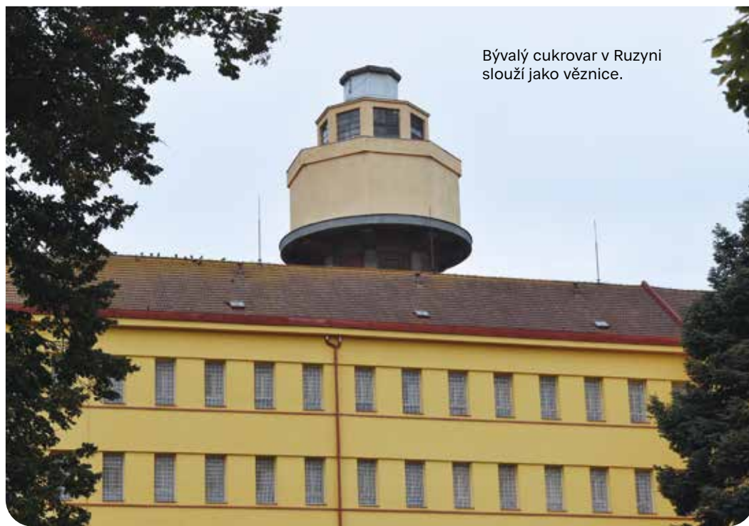
Bývalý cukrovar v Ruzyni slouží jako věznice.