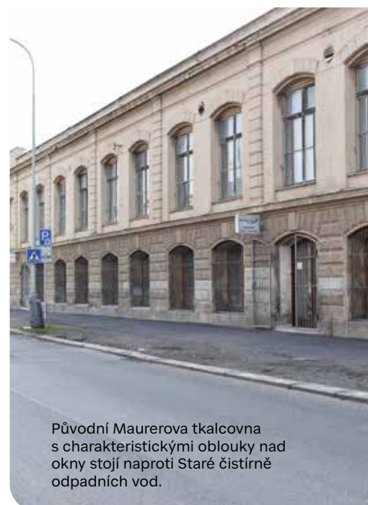
Původní Maurerova tkalcovna s charakteristickými oblouky nad okny stojí naproti Staré čistírně odpadních vod.