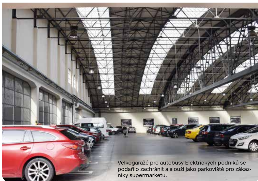
Velkogaražé pro autobusy Elektrických podniků se podařilo zachránit a slouží jako parkoviště pro zákazníky supermarketu.

Ruzyňský cukrovar založila firma Hugo von Strassern v roce 1836 na pozemcích staršího hospodářského dvora. Provoz cukrovaru však skončil v roce 1921, tedy ani ne po sto letech. Poté se sem stěhuje zemská donucovací pracovna, jak se tehdy říkalo výchovnému zařízení. Část budov byla ve 30. letech 20. století zbořena, ale část se zachovala včetně vily původních majitelů a komína, přebudovaného na vodárenskou věž. Cihlový komín byl podle návrhu Karla Domanského – mimo jiné autora přehrady ve Vraném na Vltavě – ubourán na výšku 47 metrů a obestaven osmi železobetonovými pilíři podpírajícími vodojem ve výšce 36 metrů. Prostor mezi oběma konstrukcemi se vyzdil tak, aby uvnitř zůstala dostatečně velká mezera pro točité ocelové schodiště, které vedlo k nádrži. Jde o ojedinělé řešení, které nemělo v českých zemích obdobu. Nejbližší podobný komín se zásobníkem vody se v té době nacházel až u Berlína. Podle projektové dokumentace má věž výšku 47 metrů. Od roku 1968 byl vodojem připojen na městský vodovod, od roku 1990 se nepoužívá. Ačkoli byla věž upravena tak,