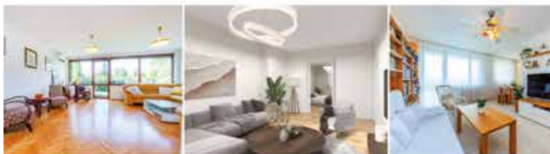
Rodinný dům 5+kk/T/G Matějská 2106 Praha 6 Dejvice