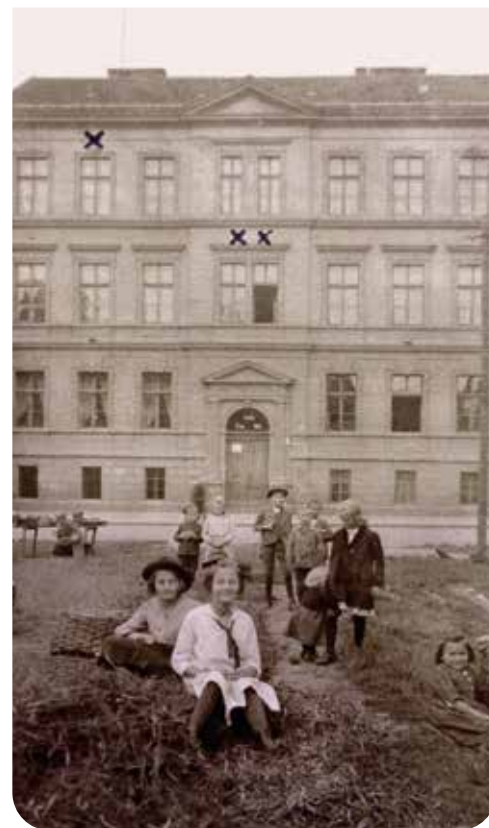
↑ Budova obecné školy ve Školské ulici v Bubenči, x - první prima, xx - ředitelna

Po komunistickém puči v roce 1948 se v budově vystřídala řada různých typů škol od základních devítiletých až po gymnasia. Po roce 1989 začaly přípravy na přeměnu školy na polyfunkční instituci, jejíž součástí mělo být opět gymnázium, a to s esteticko-výchovným zaměřením na výtvarnou a hudební výchovu. To zahájilo svůj provoz v roce 1993 se snahou navázat na slavné historické tradice. Ústav tak dnes pokračuje s názvem Vyšší odborná škola pedagogická a sociální, Střední odborná škola pedagogická a Gymnázium, Evropská 33. ■