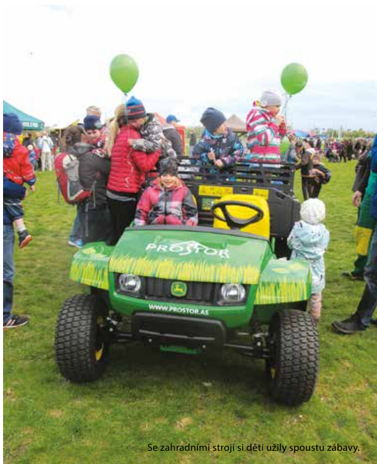
Se zahradními stroji si děti užily spoustu zábavy.