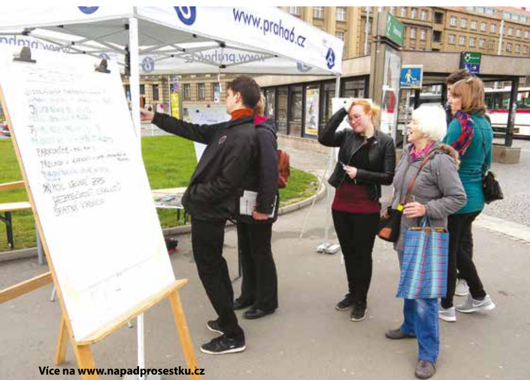
Více na www.napadprosestku.cz

prostory vypadají a co by se do nich hodilo, si mohou lidé udělat už 14. května, kdy zde spolek Živé město připravil od 14 do 21.30 kulturní program. Půjde tak o jednu z prvních příležitostí vidět nádraží zevnitř poté, co přestalo fungovat ke svému původnímu účelu.