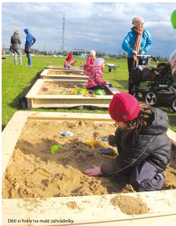
Děti si hrály na malé zahrádky.