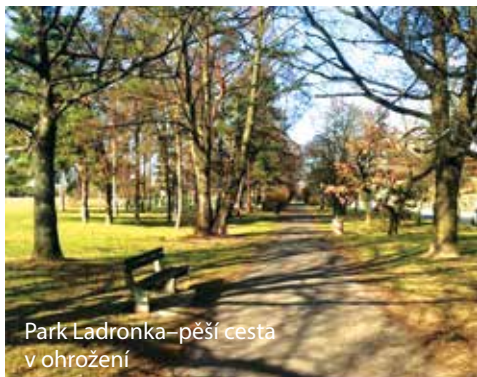
Park Ladronka—pěší cesta v ohrožení

Radnice překrucuje výsledky ankety, ve které se obyvatelé jasně vyjádřili proti rozšiřování bruslařských drah podél Tomanovy ulice (proti 173 hlasů, pro pouze 98). Místo uspořádání slibované, ale stále neuskutečněné veřejné debaty, zadala radnice v tichosti vytvoření studie, která tento nešťastný nápad rozpracovává. Domníváme se, že in-line dráha nepatří do této části parku, kterou hojně využívají—právě i jako azyl před bruslaři—rodiče s dětmi (je tu umístěno dětské hřiště), senioři, pejskaři. Rozšíření bruslařské in-