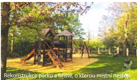
Rekonstrukce parku a hřiště, o kterou místní nestojí