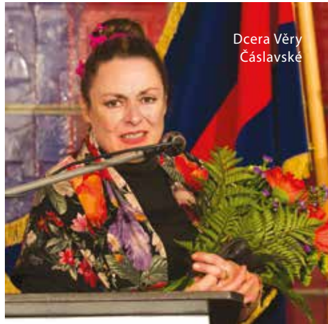
Dcera Věry Čáslavské

Československá sportovní gymnastka, trenérka a významná sportovní funkcionářka, sedminásobná olympijská vítězka, čtyřnásobná mistryně světa, jedenáctinásobná mistryně Evropy a čtyřnásobná Sportovkyně roku Československa Věra Čáslavská se narodila v r.1942. Po sametové revoluci byla v letech 1990 – 1996 předsedkyní Československého olympijského výboru a v letech 1995 – 2001 také členkou Mezinárodního olympijského výboru. Spolu s Ruskou Larisou Latyninovou je jednou ze dvou gymnastek historie, kterým se podařilo získat zlaté medaile ve víceboji na dvou po sobě jdoucích olympijských hrách. V roce 1968 se zapojila do politického života a podepsala petici Dva tisíce slov. Později se věnovala trenérské činnosti, a to i v Mexiku. V lednu 1990 se stala poradkyní