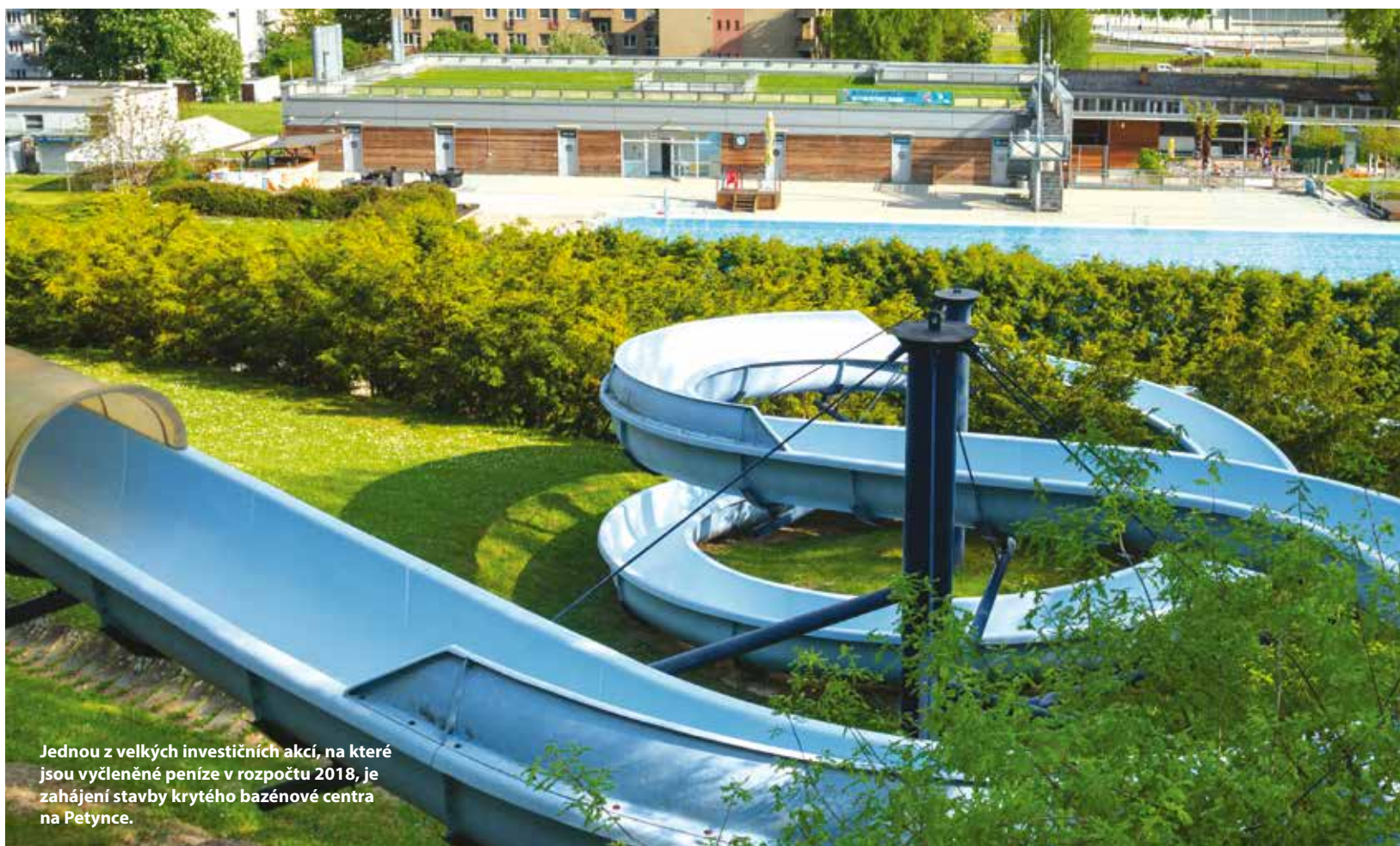
Jednou z velkých investičních akcí, na které jsou vyčleněny peníze v rozpočtu 2018, je zahájení stavby krytého bazénového centra na Petynce.