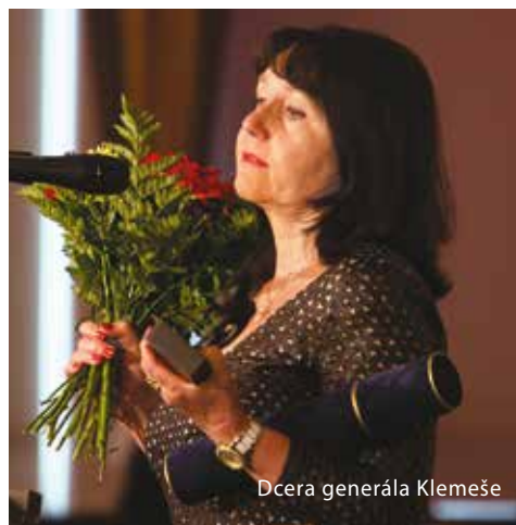
Dcera generála Klemeše

plukovníka a později plukovníka v záloze. Dne 8. května 2010 byl prezidentem republiky jmenován do hodnosti brigádního generála. Jaroslav Klemeš zemřel 7. srpna 2017.