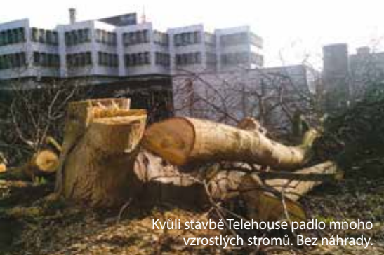
Kvůli stavbě Telehouse padlo mnoho vzrostlých stromů. Bez náhrady.

Nejzávažnější skutečností je, že v březnu 2017 padla výstavbě za obět veškerá zeleň, která telefonní ústřednu obklopovala a která – byť neudr-