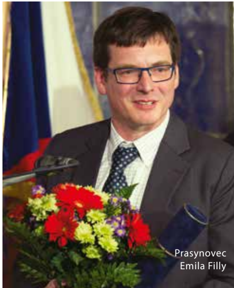
Prasynovec Emila Filly

Emil František Josef Filla, jak zní celé jeho jméno, se narodil v roce 1882. Významný český kubistický malíř, grafik a sochař žil v Praze na Ořechovce v Lomené ulici, kde obýval polovinu dvojevy postavenou v takzvaném holandském stylu s režným zdívenem na fasádě. Vedle intenzivní malířské tvorby se soustředil také na práci v českém odboji, působil v tzv. České Maffii. První den 2. světové války byl zatčen a převezen do koncentračního tábora v Dachau a později v Buchenwaldu. Na rozdíl od mnoha dalších vězňů přežil a hned v roce 1945 mu byla uspořádána v Mánesu výstava. Po válce pokračoval ve své práci, v malbách i grafikách navázal na předválečné cykly a intenzivně se věnoval zátiší. Od roku 1947 až do smrti vytvářel krajino-malby Českého středohoří. Roku 1998 mu byl in memoriam propůjčen Řád T. G. Masaryka III. třídy. Emil Filla zemřel v roce 1953, ocenění za něj převzal prasynovec.