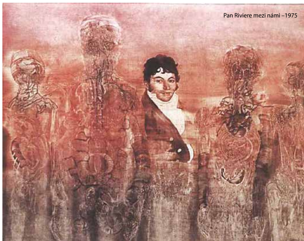
Pan Riviere mezi námi –1975

Víte, že jsem o tom ještě nepřemýšlel? Mám pocit, že nyní prožíváme zlatý věk, máme se velmi dobře. Už jen z toho důvodu, že zde sedmdesát