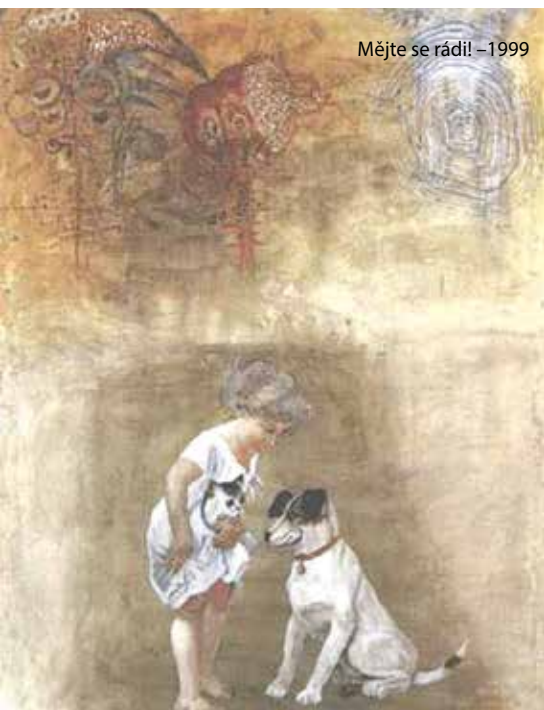
Mějte se rádi! – 1999