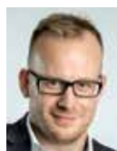
ONDŘEJ KOLÁŘ / TOP 09

Především si musíme být vědomi, že Praha je jedno město. Praha podle zákona vystupuje jako kraj a obec a dále se člení na městské části. Problémem je především různá velikost jednotlivých MČ, podle toho se pak dělí i kompetence. Tady se ukazuje v řadě případů různost názorů. Velký počet malých MČ často svým přístupem umí zablokovat na dlouhou dobu věci důležité pro rozvoj a spokojenost občanů celého města. Typickým příkladem, kdy dochází i k zásadním rozporům, je především doprava (městský a silniční okruh atd.). I když má Praha zřízen Institut plánování a rozvoje, ukazuje denní život, že neplní dostatečně úlohu hlavního architekta města. Trvalým předmětem sporů mezi hl. městem a jednotlivými MČ je samozřejmě i rozdělování finančních prostředků. Vždy jsou důležité vyjednávací schopnosti příslušných týmů včetně toho, jak důrazně umí potřeby MČ prezentovat hl. městu.