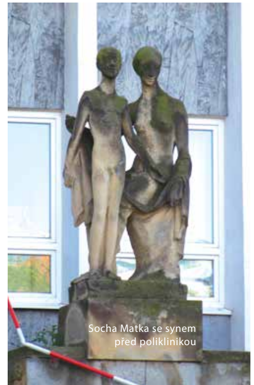
Socha Matka se synem před poliklinikou

Rada městské části zároveň na svém jednání 24. ledna rozhodla, že bude pokračovat v přípravě možné přístavby LDN v areálu břevnovské polikliniky a připraví podmínky pro architektonickou soutěž. Tato přístavba bude řešena samostatně a nezávisle na provozu polikliniky, ačkoli budou obě budovy v nejnižších patrech navzájem propojeny. Vzhledem k udělené pa-