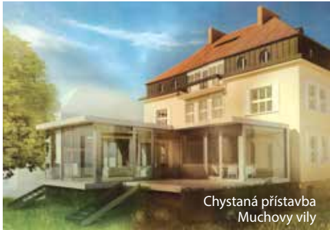
Chystaná přístavba Muchovy vily