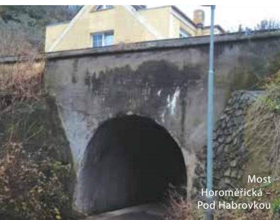
Most Horoměřická – Pod Habrovkou

Most Prašný – Svatovítská Lávka Patočkova Lávka na Císařský ostrov Lávka Mlýnská do Stromovky Most Evropská – Pražský okruh Most Aviatická – K Tuchoměřicům Mosty Horoměřická/Mlýn – Horoměřická / Pod Habrovkou Lávka pro pěší přes Strahovský tunel Most – oba – přes Strahovský tunel Most a lávka přes Diskařskou Lávka Drnovská - Dlouhá Míle / Pražský okruh Lávka Ruzyňská přes Litovický potok Lávka přes Litovický potok u obytného souboru Rybníčnā Lávka přes Litovický potok pod Rybníčnou Lávka u objektu Uniqa ze sídliště Červený vrch Most K Dubovému mlýnu Most v Šáreckém údolí x Ke Kulišce Most v Šáreckém údolí x Pod Mlýnkem Most přes železniční trať Kamýčká