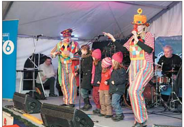
Kromě podvečerních koncertů měl program na Dejvické pobavit hlavně děti.