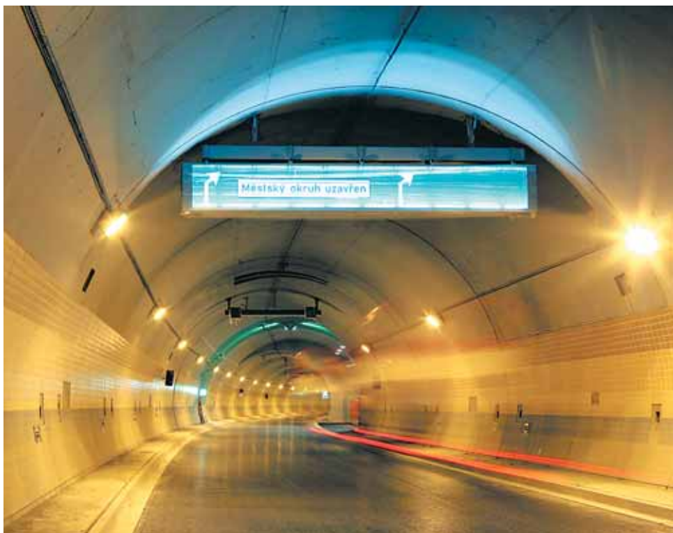
Zprovoznění tunelu Blanka bude pro obyvatele Prahy 6 otázkou letošního roku. Dočkejte se?

Výběr nejdůležitějších událostí, které se staly v uplynulém roce, najdete přehledně na str. 18 a 19.