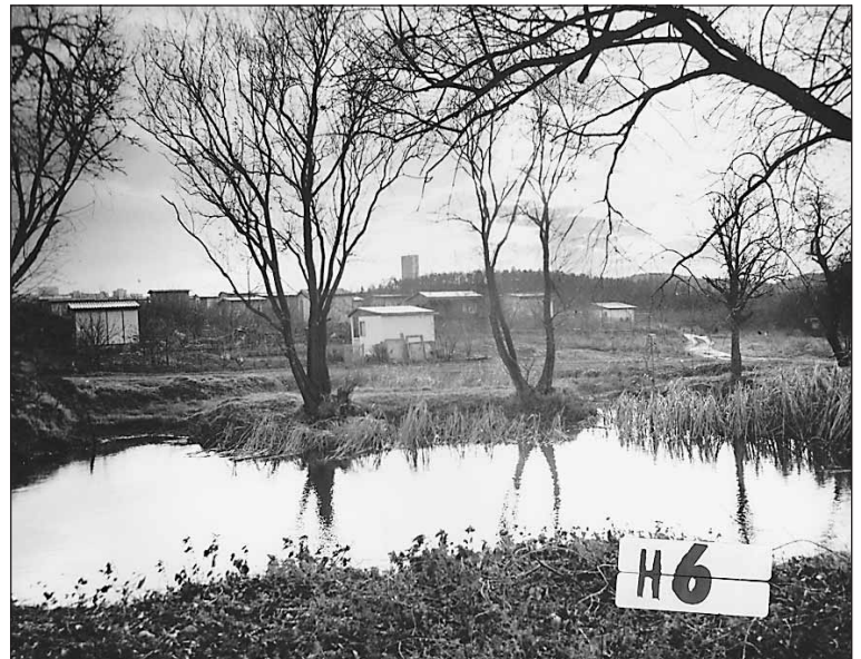
Historický pohled na Osadu Jenerálka.

V souvislosti s přípravou nového územního plánu se začal projevoval tlak developerské lobby na uvolnění pozemků pro výstavbu a navržené změny začaly vážně ohrožovat existenci pražských zahrádkových osad. Dle současného územního plánu hl. města Prahy leží Jenerálka v zastavěném území a současně mimo zastavitelné území obce. Vzhledem ke komplikovaným majetkoprávním vztahům k pozemkům se do dnešního dne nezdáříl úplatný převod pozemků do vlastnictví těch, kteří na půdě hospodaří. Území bylo původně z 60-ti procent ve vlastnictví Královské kanonie řádu Premonstrátů (jako panství Horoměřice), zbytek ve vlastnictví fyzických osob. V současné době se o část území přihlásili dědici bývalých majitelů pole, kteří odešli do Ameriky v roce 1896.