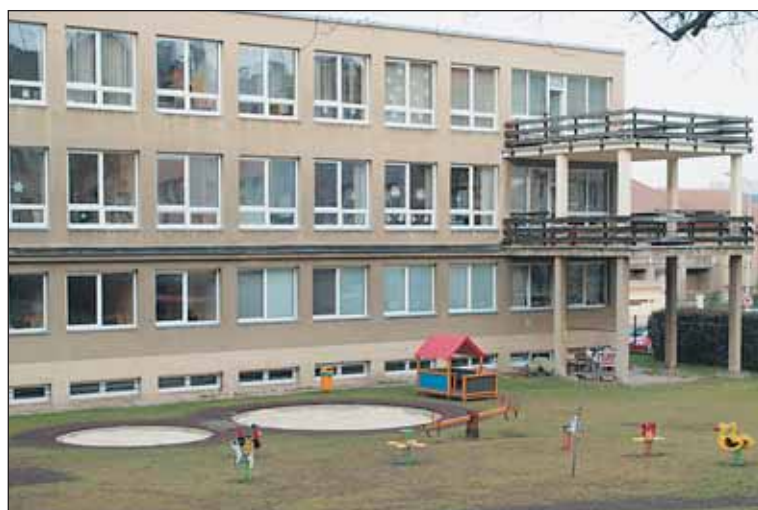
V letošním roce se připravuje rekonstrukce mateřské školy Čínská, díky které dojde k navýšení počtu míst ve školce.