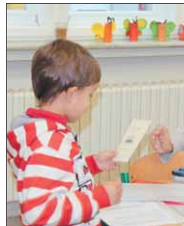
vzdělávacích programů a statistických údajů).

Informace o školách najdou rodiče dětí na webových stránkách jednotlivých škol nebo na webu www.praha6.cz v oblasti školství či na portálu www.jakdoskolky.cz (včetně souhrnného hodnocení škol, přehledu školních