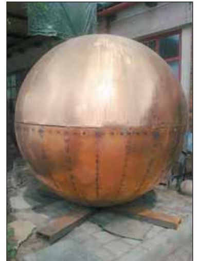
Bronzový pomník autorů Stefan Milko a Jiřího Trojana bude po dokončení symbolizovat elektrický výboj.

Nikola Tesla (1856 až 1943) sestrojil a patentoval četné elektrické stroje a přístroje, například elektrický motor na střídavý proud a takzvaný Teslův transformátor, zdroj vysokého střídavého napětí o vysokém kmitočtu. Byla po něm pojmenována jednotka magnetické indukce. V letech 1936 až 37 pobýval Tesla v tehdejší Česko-