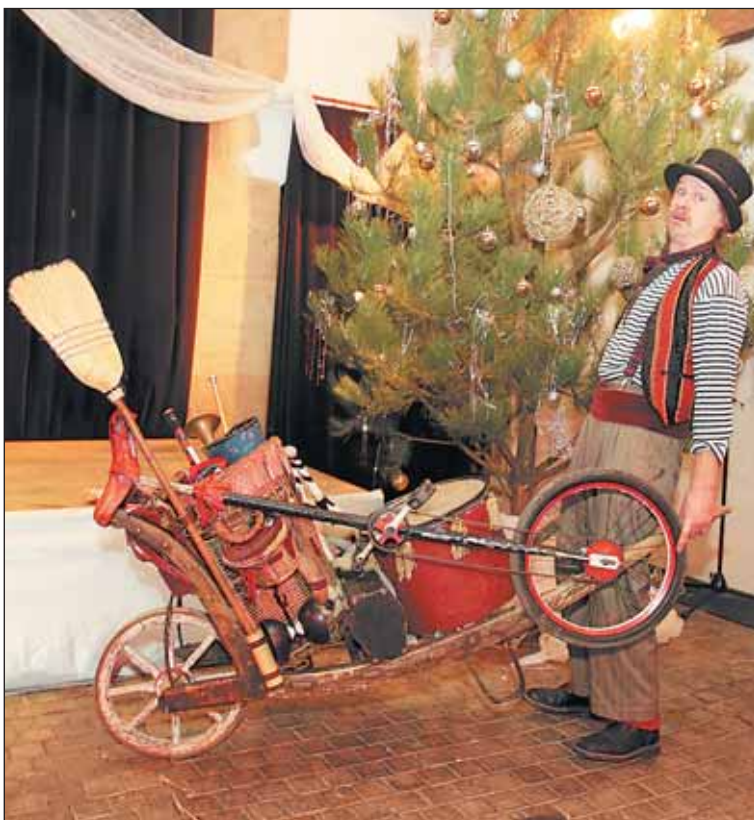
Jeden z nejlepších českých kejklířů a komediantů Vojta Vrtek dokáže vyvolat úsměv na každé tváři.