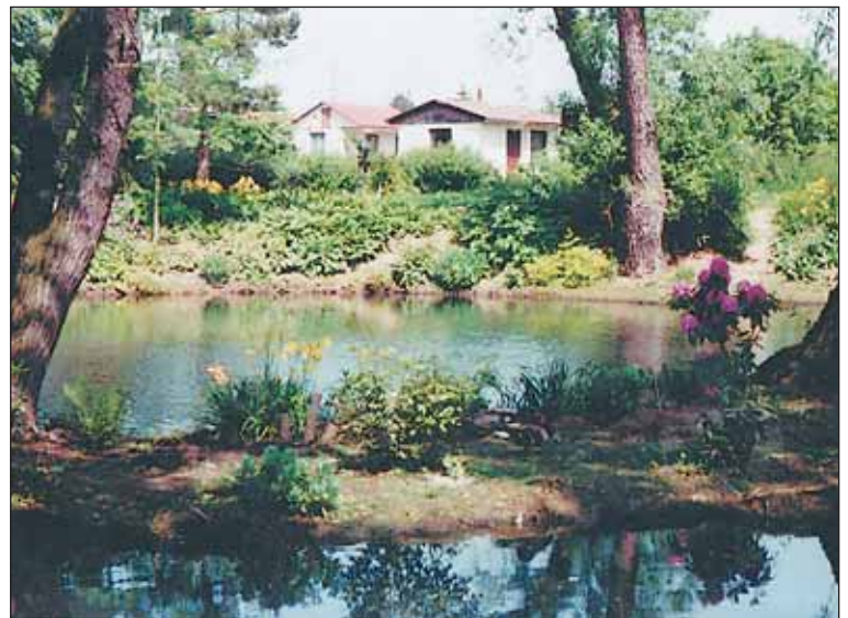
Současná fotografie Osady, která oslavila 50 let od založení. V území se vyskytují chráněné rostlinné i živočišné druhy.

Koupím byt, rodinný dům, pozemek kdekoli v Praze, i ve špatném stavu, na velikosti, ani vlastnictví nezáleží, může být i za odstupné – nájemní, družstevní, LBD, i nečlena družstva, služební, podnikový a pod. Nechám čas na vystěhování, uhradím za Vás případné dluhy na nájmu, exekuce, privatizace atd., vyřídím i právně velmi komplikované případy, podílová spoluvlastnictví, stáhnou soudní výpověď, žalobu atd. Koupím i nemovitost neoprávněně obsazenou, s nežádoucím nájemníkem, příp. dám náhradní byt, či domeček mimo Prahu a doplatek a pod.