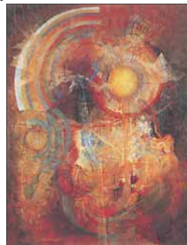
Jiří Anderle: Tvář sv. Jana.