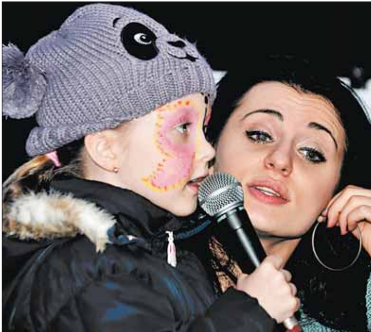
S dětmi si zazpívali protagonisté muzikálu Touha z divadla Kalich.

bandu nebo skupiny Eddie Stoulow. O děti bylo postaráno v hracím koutku, malí návštěvníci měli možnost vyzkoušet výrobu vánočních ozdob nebo zdobení perníčků. Autoři tří neoriginálnějších psaníček v soutěži Dopisy Ježíškovi získali hodnotné dary pod stromček.