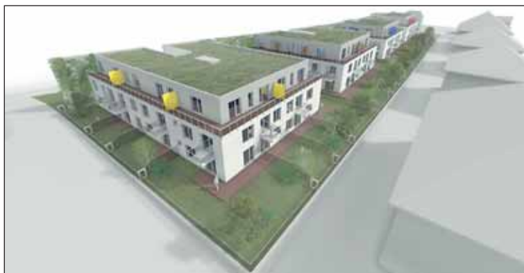
Obecní dům nabídne ubytování seniorům a mladým rodinám. Vizualizace Sneo a.s.