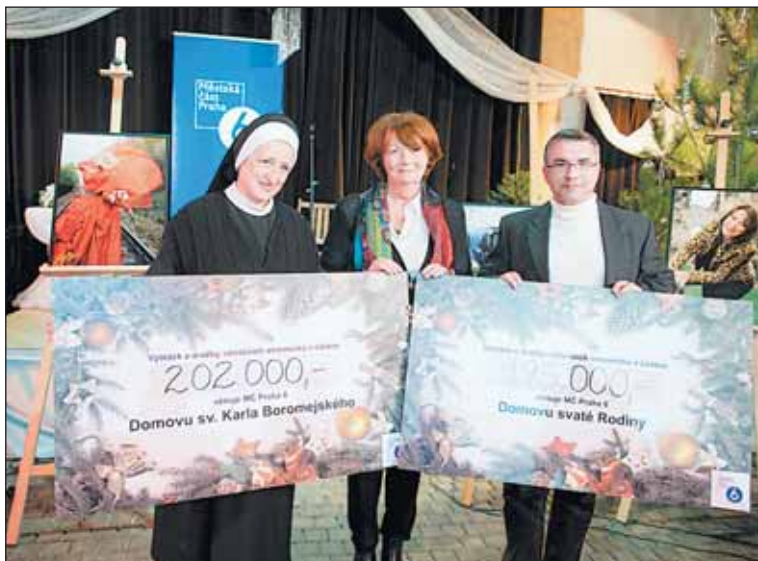
Výtěžek dražby si mezi sebou tradičně rozdělili Domov sv. Rodiny a Domov sv. Karla Boromejského.