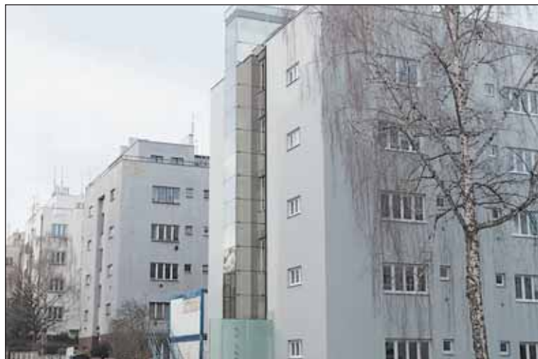
V letošním roce bude městská část pokračovat v komplexních rekonstrukcích obecních domů v ulici Nad Kajetánkou a Patočkova.

Městská část bude investovat do kulturních a sportovních akcí a zaměřit se zejména na ty osvědčené a lidmi oblíbené. Podpoří hudební festivaly Dejvické hudební léto, Motolice, Kytara napříč žánry. Počítá s představením Opery v Šárce, pokračuje koncertní cyklus mladých talentů v NTK. Rozpočet Prahy 6 podpoří tradiční Masopust, Posvícení, velikonoční program, čarodějnice na Ladronce, vánoční koncerty, Den dětí i Den seniorů.