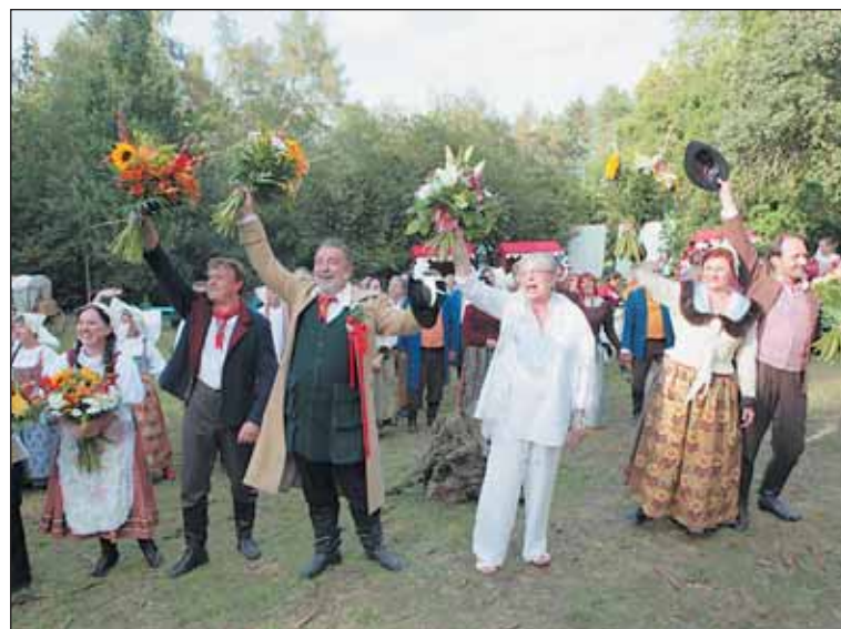
Účinkující společně s organizátory zdraví nadšeně aplaudující obecenstvo.

Chcete spolehlivě upozornit na svou firmu nebo značku?