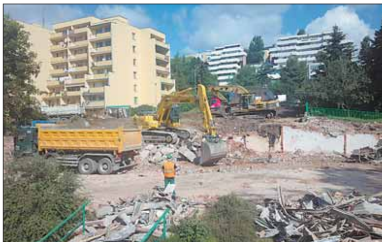
Objekt MŠ Meziškolská byl během prázdnin odstraněn, na stejném místě vyroste v září první modulová stavba školky.

V areálu Základní školy Na Dlouhém lánu začala v letních měsících rekonstrukce sportoviště. V letošním roce bude modernizováno víceúčelové hřiště, odvodnění i osvětlení areálu. Na hřiště pro malou kopanou bude položen umělý trávnik 3. generace. „Hřiště tak bude využíváno pro mladší a starší přípravku mládežnické kopané, pro soutěže Hanspaulské ligy a také na něm mohou být sehraána soutěžní utkání pořádané českou fotbalovou asociací,“ říká radní Ondřej Balatka.