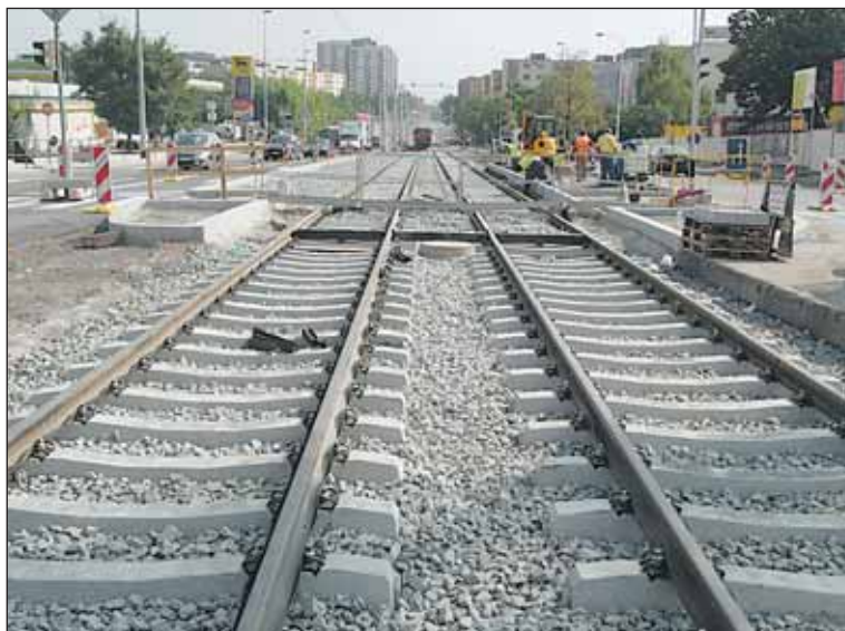
V místě budoucích stanic metra se koleje po úpravách vrátily do původní stopy. K rekonstrukci zbývajících úseků mezi stanicemi dojde na podzim.