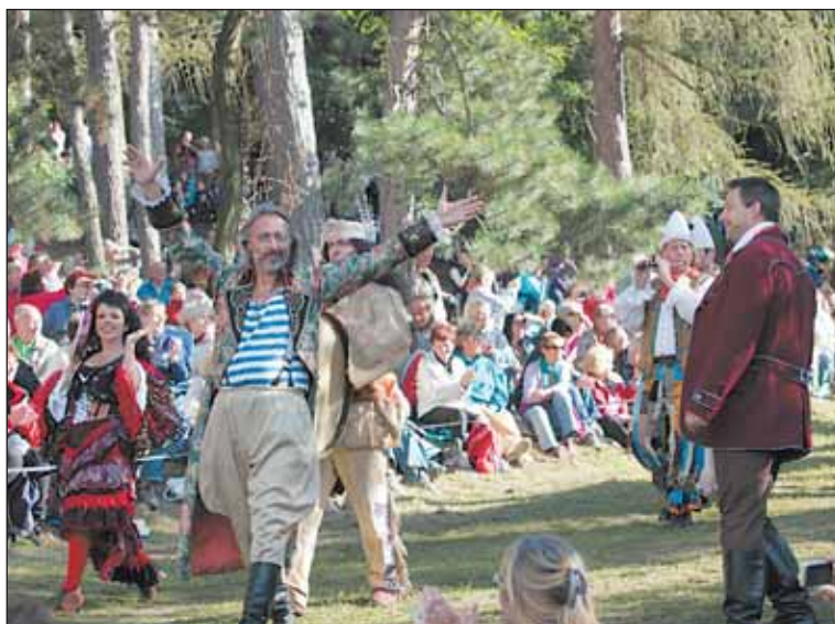
Šestnáct tisíc diváků sedělo na zemi a sledovalo jubilejní představení.