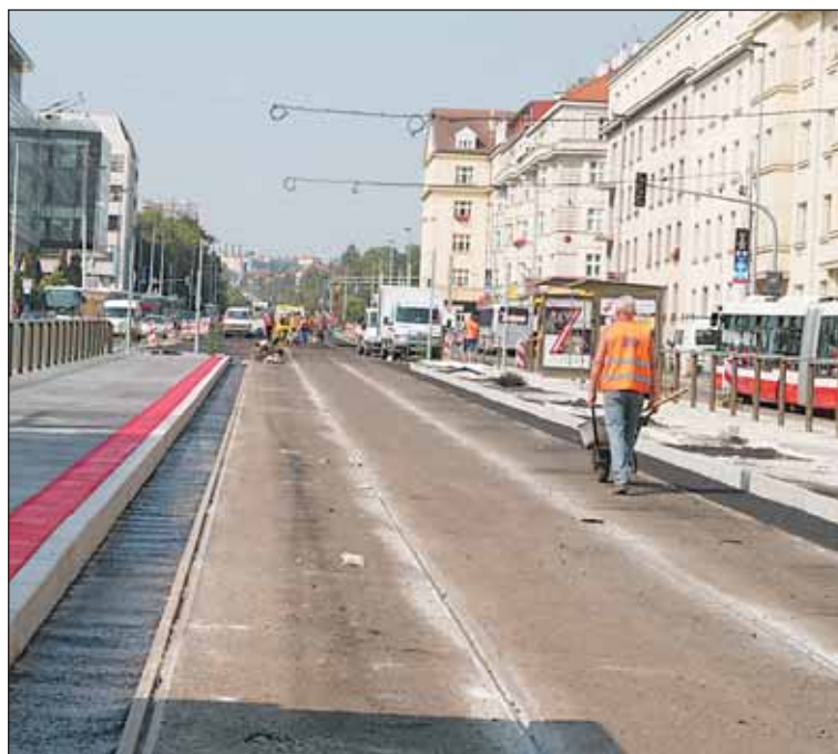
Rekonstrukce v oblasti Vítězného náměstí je těsně před dokončením. Pokračovat ale bude oprava stropní desky.