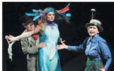
Novinkou sezóny je návrat Kytice .

Novinkou sezóny je návrat Kytice do repertoáru. Oblíbené představení, které divadlo stáhlo z programu z finančních důvodů. Diváci ji uvidí v upravené, poněkud chudší verzi. Předvánoční čas bude patřit adventní opeře Betlém . „Zájem o ni přesahoval o minulých Vánocích reálný počet představení a tak letos ještě přidáme. Budeme hrát mnohdy odpoledne i večer,“ avizuje principál divadla Jiří Suchý.