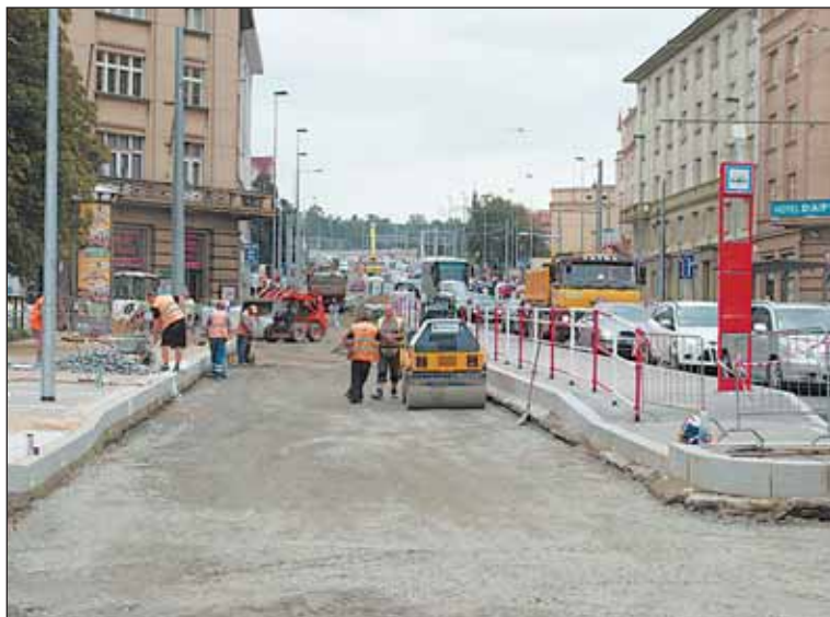
Svatovítská ulice dostává nový asfaltový povrch. Posunutí zastávky umožní bezpečnější přecházení.

Konečná zastávka se přesouvá do obratiště na Špejcharu.