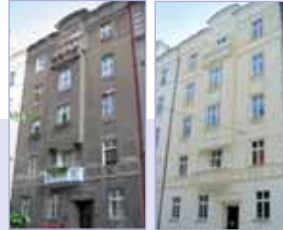
PŘED REKONSTRUKCÍ / PO REKONSTRUKCÍ