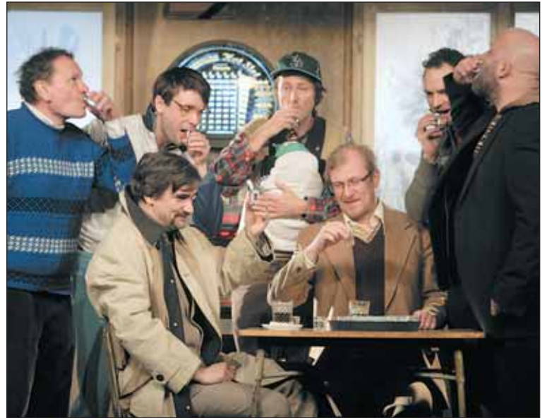
V inscenaci Ucpanej systém hraje téměř kompletní mužské osazenstvo souboru Dejvického divadla.

To chápu. Divadlo má totiž kapacitu necelých 150 míst. Nepřála byste si, aby bylo větší?