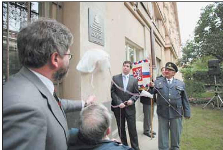
Pamětní deska letci je umístěna na domě, ve kterém žil.

Stíhací letec František Weber se narodil 28. února 1908 a zemřel 1. září 1991. Po tajném odchodu z Prahy v roce 1940 se dostal do Anglie, jako velitel 310. československé stíhací