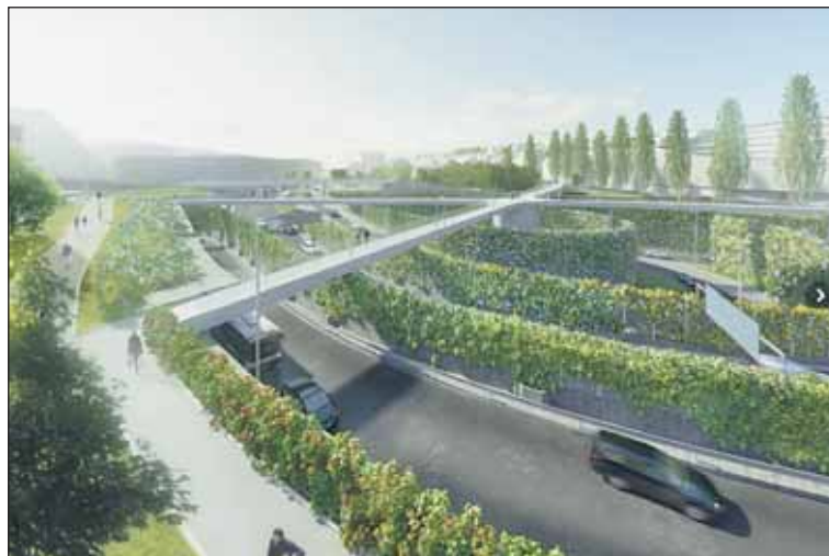
Rozpracovaná varianta „Labyrintu“.

vyslovila souhlas s předfinancováním předprojektové dokumentace z rozpočtu městské části. V září podal magistrát hlavního města žádost o poskytnutí podpory na projekt Zelená Malovanka na Státní fond životního prostředí.