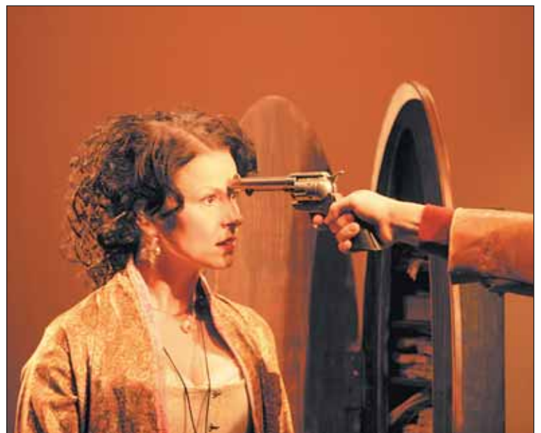
Hra Wanted Welzl patří v Dejvickém k oblíbeným.

Aby to vydrželo i nadále, divadlo bylo dostatečně zabezpečeno finančně, abychom neztratili přízeň sponzorů a především aby se uměleckému souboru dařilo tak, jako doposud. A můj osobní sen? Až půjdu za několik let do důchodu, tak bychom mohla občas sedět v pokladně divadla, prodávat lístky a pozorovat, že zájem diváků o Dejvické divadlo neopadl.