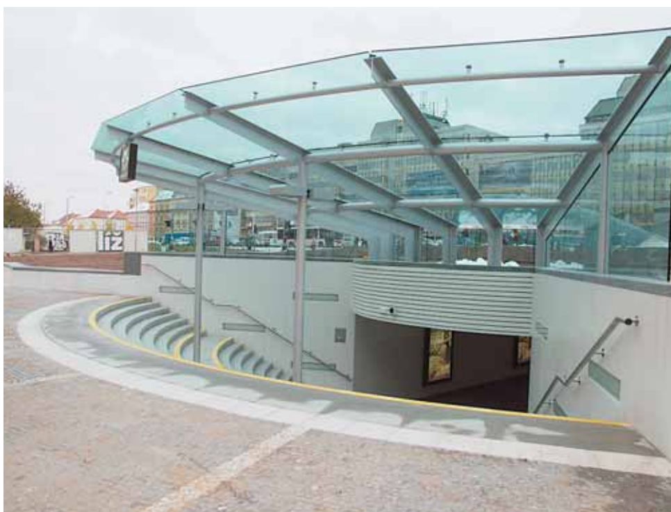
Po letech se cestujícím opět otevřel podchod spojující vestibul metra s Dejvickou ulicí.