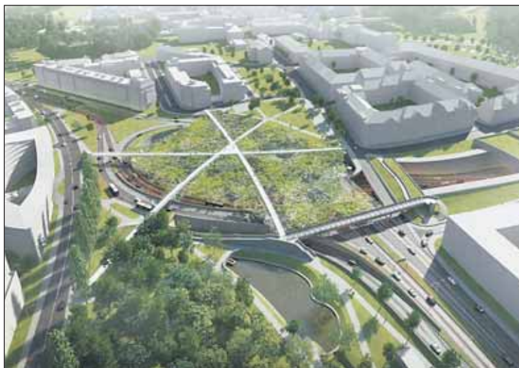
Ověřovací studie „Visutého parku“.

O zazenění Malovanky usilují zejména místní obyvatelé, projekt ale podporuje i radnice Prahy 6, která