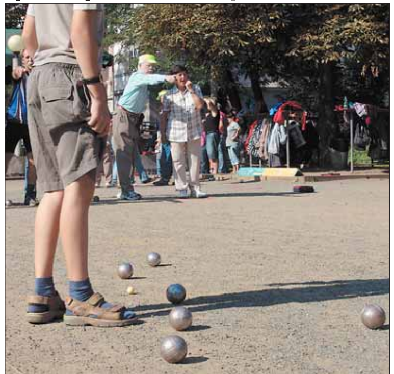
Pétanque, hra s kovovými koulí, je vhodná pro všechny generace od dětí po seniory.

Tréninky se konají za každého počasí vždy od 15.30 hod. Rozpis na další měsíc bude zveřejněn v příští Šestce. Aktuální rozpis najdete na www.petanque-pro-vas.com . Informace podá Petr Fuksa, fuksa@petanque-pro-vas.com , tel. 602 261 925.