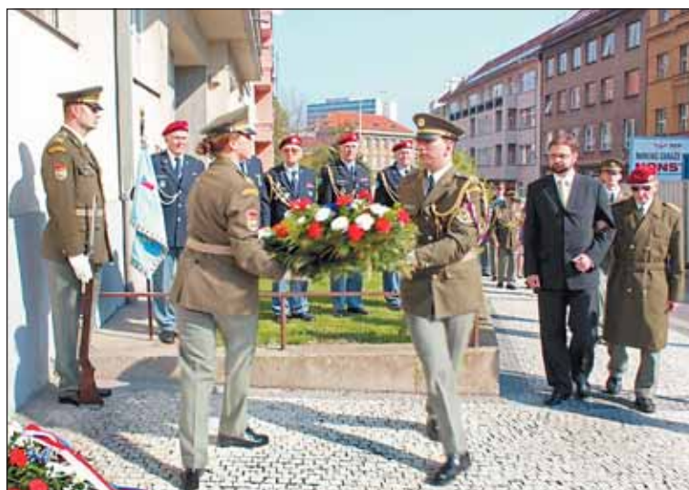
Balabánovo hrdinství už několik let připomíná na domě č. 1 ve Studentské ulici pamětní deska s datem 22. dubna 1941, kdy byl velitel legendární odbojové skupiny „Tří králové“ zatčen gestapem.

Pamětní deska ve Studentské ulici v Praze 6 připomíná místo, kde gestapo postřelilo a pak zatklo Josefa Balabána. Společně s Josefem Mašínem a Václavem Morávkem tvořili skupinu Tří králů. Tak je pojmenovalo samo gestapo. Skupina udržovala spojení s velitelem československé rozvědky v Londýně generálem Františkem Moravcem. Mnohdy svými riskantními operacemi provokovala špičky pražského gestapa a získávala velmi cenné informace. Tito hrdinové patřili mezi zakládající členy vojenské odbojové organizace Obrana národa, kde vytvořili zpravodajskou a diverzní skupinu. Při jedné konspirační schůzce v pražských Dejvicích, která byla konfidentem vyzrazena, padl do rukou gestapa první ze Tří králů –