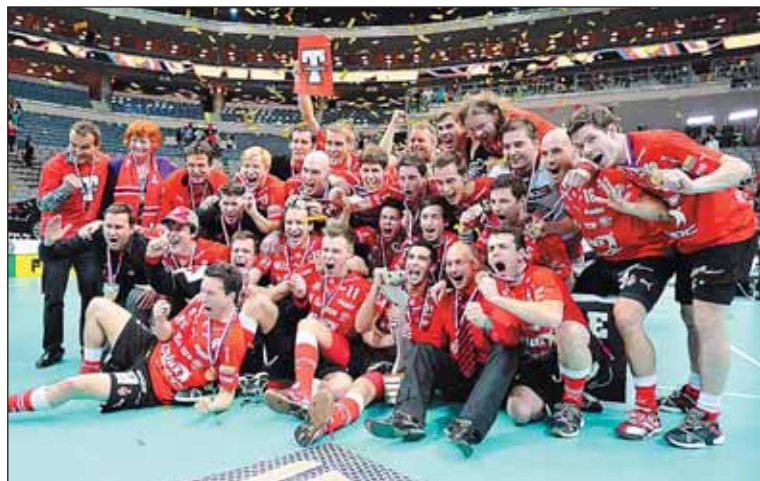
Neporazitelný Tatran Střešovice. Tým oslavil svůj 15. extraligový titul.

pitán. Napínavou podívanou si nenechalo ujít na osm tisíc diváků, kteří od začátku fandili jako o život. „Pro spoustu našich mladých kluků to byl nezapomenutelný zážitek. Diváci si to museli užít, atmosféra byla výborná,“ chválí si superfinále Fridrich.