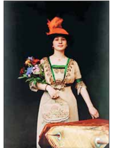
Společenské prostředí Prahy minulého století nabídne fotografická výstava.

Na obrázky historické Prahy naváže výstava TARAS 80, věnovaná nedožitým 80. narozeninám fotografa Tarase Kuščynského. Spolu s o. s. Porte se na organizaci podílela rodina autora za podpory hl. m. Prahy. Kurá-