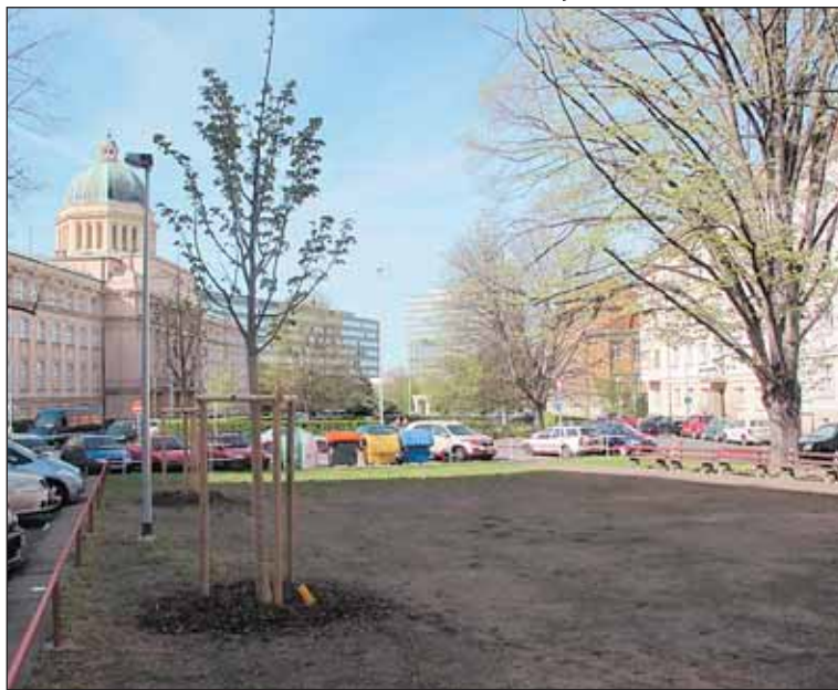
Technická zpráva komunikací v dubnu doplnila chybějící stromy v aleji v Thákurově ulici.

V parku v Thákurově ulici již rostou nové stromy. Mluvčí TSK Tomáš Mrázek potvrdil, že v dubnu došlo k vysazení 12 kusů vzrostlých lip stříbrných.