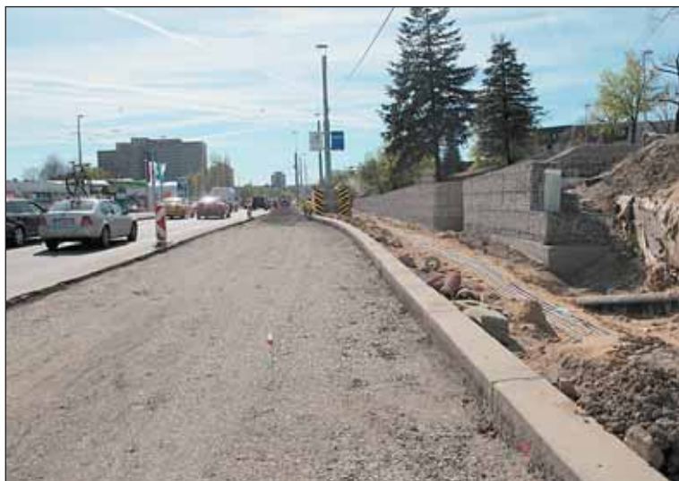
Práce na stanici metra Veleslavin zasáhnou i část vozovky na Evropské. Proto došlo k rozšíření křižovatky o jeden jízdní pruh.

Noční provoz: linka č. 51: Odkloněna do Podbavy a zavedena linka NAD X51 v trase Vítězného náměstí – Bořislavka – Červený Vrch – Nádraží Veleslavin – Divoká Šárka