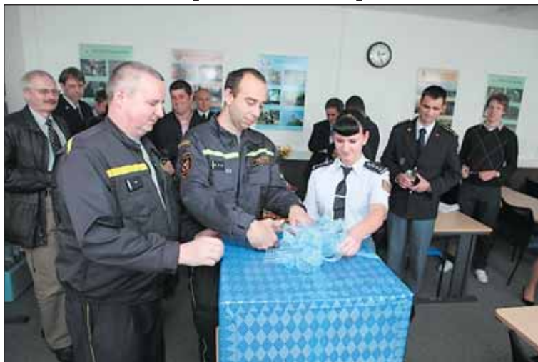
Hasiči si v nové učebně převzali tiskárnu, dárek od Prahy 6.

Hasičská stanice na Petřinách má novou interaktivní učebnu. Budou se v ní konat přednášky pro veřejnost o prevenci kriminality, o nutné obraně, o bezpečnosti. Učebna je součástí Centra bezpečnosti.