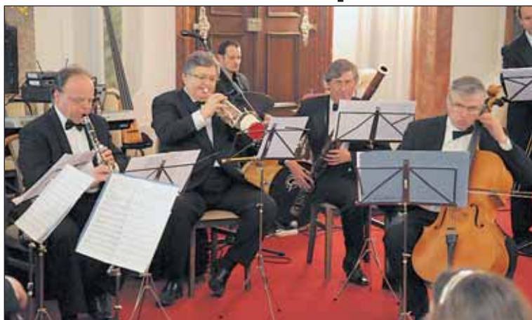
Salonní orchestr učitelů ZUŠ Charlotty Masarykové.

V březnu se konal v Tereziánském sále Břevnovského kláštera již VII. ročník koncertu učitelských osobností ZUŠ Charlotty Masarykové.