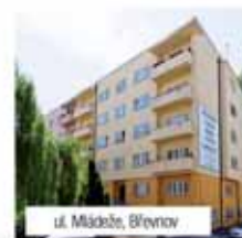
ul. Mládeže, Břevnov

ul. Za Hládkovem, Střešovice 1+kk/B, 24,4 m 2 1.899.000,-Kč 2+kk/B, 54,3 m 2 3.040.000,-Kč 3+kk, 98,8 m 2 5.195.000,-Kč