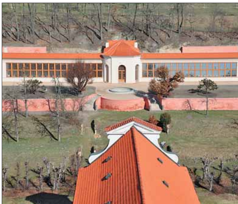
Areál dostavbou oranžerie získal jinou podobu.

ské arcidiecéze sv. Vojtěcha a Markéty. Většinu peněz na opravu získalo ze strukturálních fondů EU z programu Praha – konkurenceschopnost, deseti procenty z celkových nákladů na opravu přispěla městská část Praha 6. Arcidiecéze by chtělo na již dokončené opravy areálu, který je národní kulturní památkou, navázat druhou fází revitalizace. Ta by měla přijít na dalších padesát milionů korun.