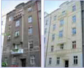
PŘED REKONSTRUKCÍ / PO REKONSTRUKCÍ