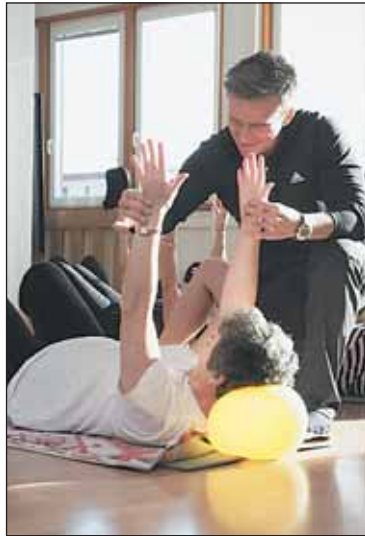
ce. Podrobný plán cvičebních lekcí zveřejníme v příštím vydání Šestky.

Od druhého května se mohou nejen senioři, ale i maminky na mateřské a další zájemci těšit na venkovní cvičení. Dvakrát v týdnu se bude cvičit na hřišti s posilovacími prvky na Petřínách a na hřišti v Mosambické ulici. Jednu týdně se pak lidé mohou zapojit do lekcí nordic walking na Ladron-