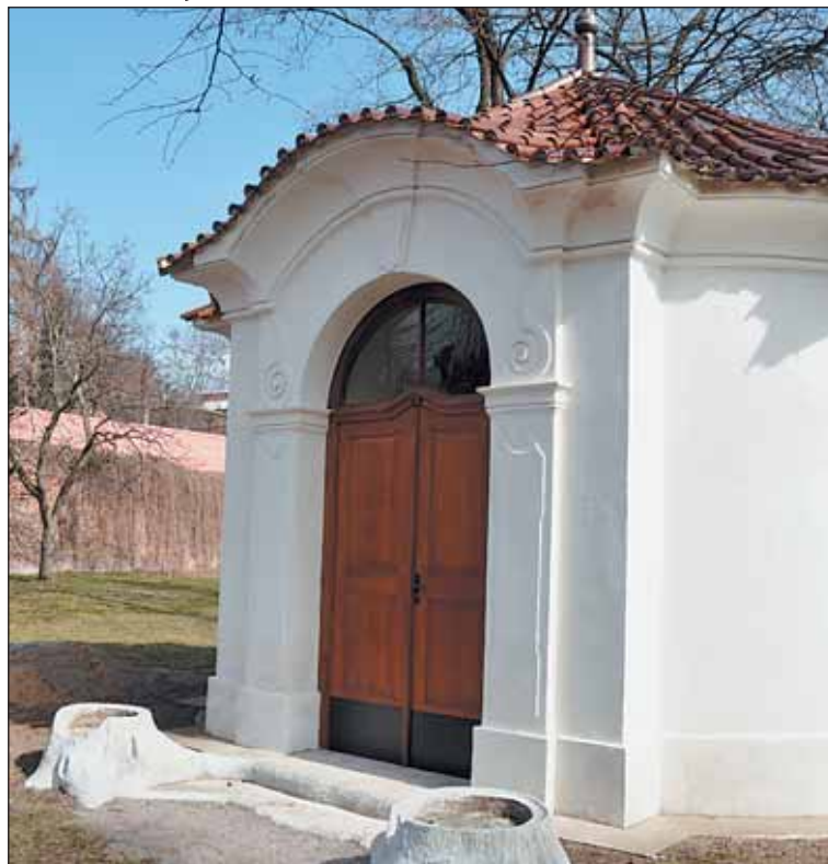
Opravená kaple Josefka.

Po dokončení 1. fáze obnovy klášterní zahrady se ve vstupním nádvoří kláštera pro veřejnost zpřístupní parter se sochou sv. J. Nepomuckého, kde je u terasové zdi vytvořena klidová zóna s lavičkami pod zeleným loubím, poskytující dnes neznámé pohledy na západní průčelí baziliky sv. Markéty. „Cílem obnovy zahrad bylo především zachování a respekt ke klidu a důstoj-