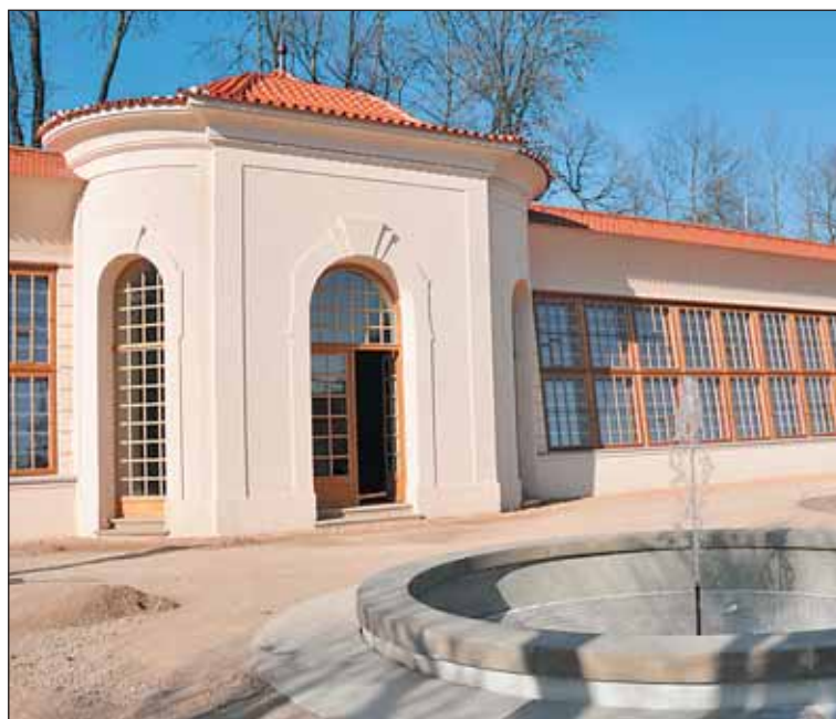
Před oranžerií nechybí i původní fontánka.