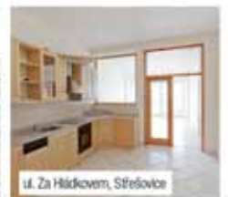
ul. Za Hládkovem, Střešovice