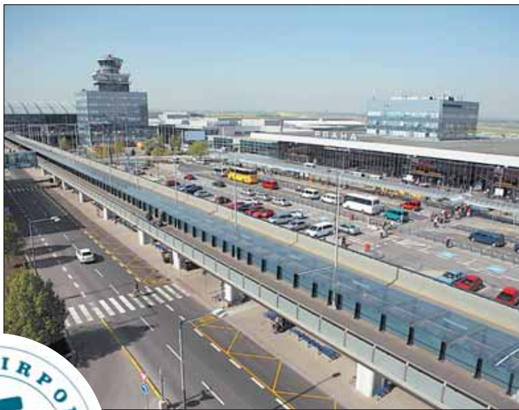
Letiště se za 75 let rozrostlo a získalo prestiž.

Za 75letou historii bylo na letišti odbaveno celkem okolo 201 milionů cestujících a bylo uskutečněno více než 4 miliony civilních letů. Dnes mají cestující k dispozici nabídku 49 leteckých společností spojujících Prahu přímou linkou s více než 128 destinacemi po