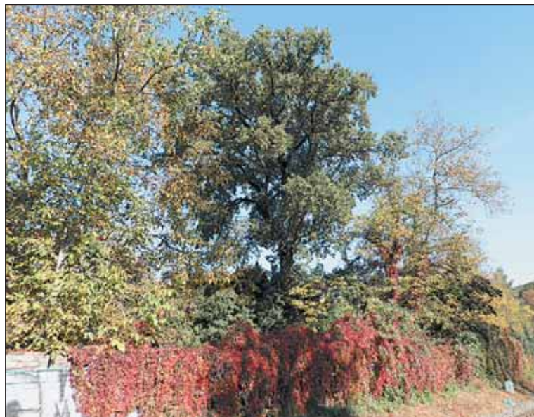
Suchardův dub v Bubenči je významný především z kulturně historického hlediska.

Památným stromům Prahy 6, ale i všem dalším v celé metropoli, se věnuje velkolepá výstava „Památné stromy Prahy se představují“. Koná se od 3. do 25. března v Botanické zahradě v Troji. K vidění bude řada foto-