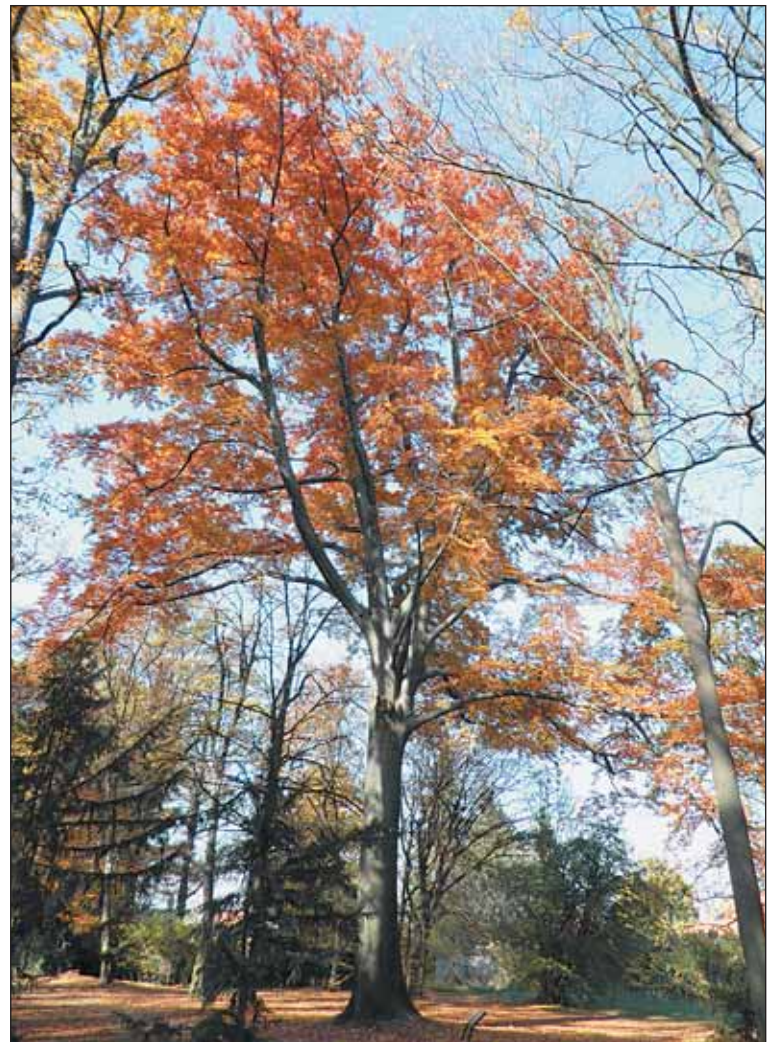
Buk lesní při severozápadní spojce v oboře Hvězda v zářícím podzimním zbarvení.