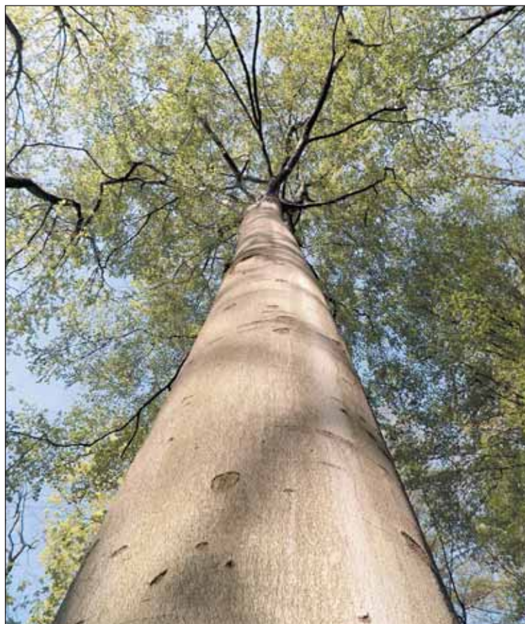
Buk lesní naproti Ruzyňské bráně má nádherný rovný kmen nesoucí bohatou korunu.

Text a foto: Ing. Aleš Rudl, autor výstavy a webových stránek