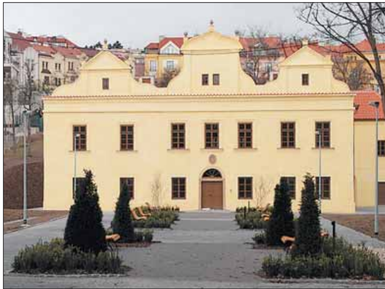
Zrekonstruovaný zámeček Kajetánka se spolu s parkem na jaře otevře veřejnosti.

Společnost Sneo se stará o obecní bytové domy, některé postupně rekon-