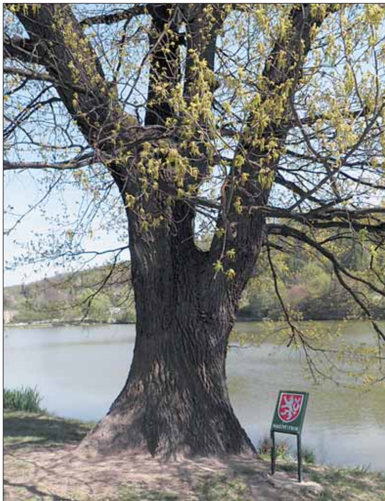
Na hrázi Libockého rybníka mnohé upoutá solitérní dub letní.

Praha se tím připravila o velkou raritu. Zářící památný buk jinde v republice nenajdeme.