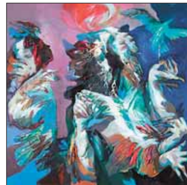
R. Riedlbauch: Kouzelník.

V kabinetu In Camera lze vidět obrazy Rudolfa Riedlbaucha, které zaujmou nejen expresivními barevnými kombinacemi, dramatickými ději, ale i lyrikou. Charakteristickým rysem pro Riedlbauchovu malbu se stalo rozkládání tvaru do menších kaleidoskopických ploch, které v divákovi snadněji evokují jeho vlastní vzpomínky a dojmy. Jedním z inspiračních zdrojů autora je hudba; obrazy mají silný hudební charakter nejen zásluhou hudebních námětů, ale také zvůčností barev, muzikálností celé kompozice. Dalším zdrojem tvorby je příroda. V obrazech nacházíme náměty rybníků i jednotlivé stromy, keře, květiny.