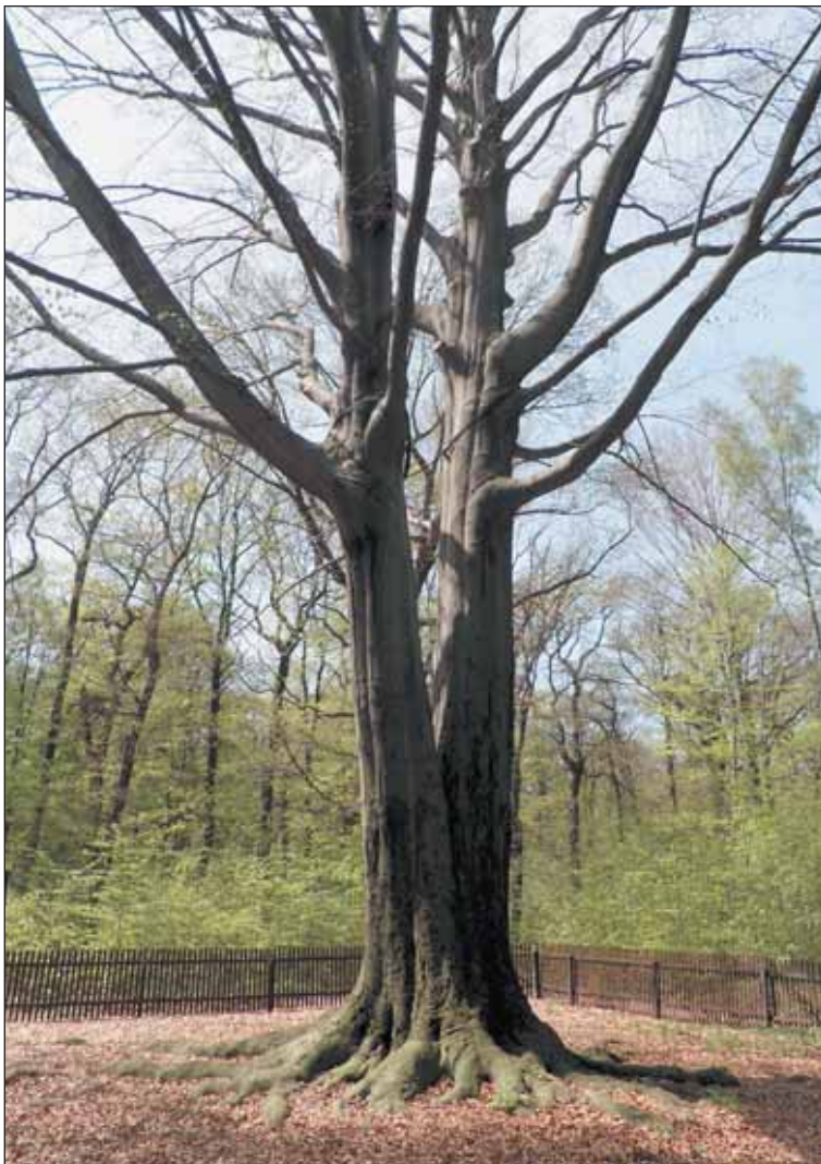
Nejvyšším památným stromem Prahy je buk lesní v oboře Hvězda.

Hned vedle dubu při křižovatce cest kraluje pro změnu statný buk. O jeho nadprůměrném vzrůstu není pochyb. Strom přitahuje návštěvníky často i v zimě. O Vánocích bývá osvěcen žárovíčkami a vždy tím zpestřuje podvečerní vycházky oborou. Uplynulé Vánoce bohužel rozsvícen nebyl, což zdůvodňoval magistrát úsporou peněz.