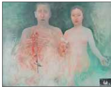
J. Anderle: Iluze a realita léta osmdesátá II.

rané vzpomínky na památník obětem první světové války v rodné vsi. Malířský přepis citované fotografie přitom ukazuje, čeho je schopna klasická malba, ať již ve ztišených polohách až renesančního estetismu nebo zase ve vypjaté drastičnosti připomínek dramatu krvavých zranění a smrti vojáků. Do patosu vojákých poz a lesků významování se vkrádají stíny obav, strachu a hrůz tragického osudu jednotlivců. Vidět současnost z hlubin historických zkušeností je jednou z výsostných možností malby. A právě Jiří Anderle toho ve svém cyklu bohatě využívá.