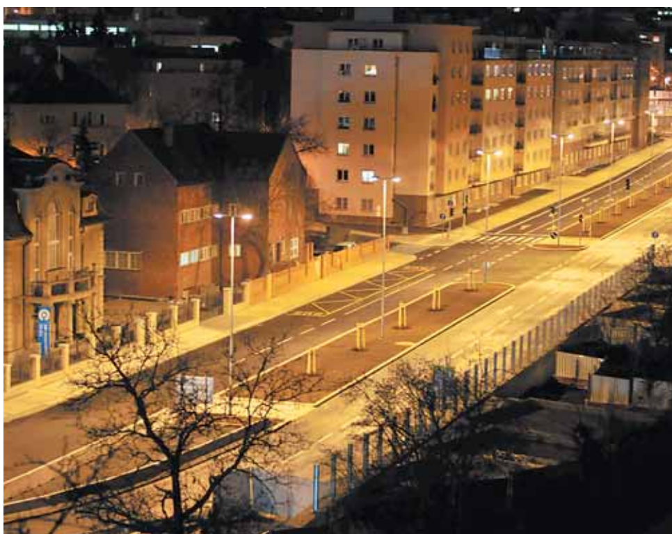
Zprovoznění Patočkovy ulice v předstihu uleví Břevnovu.