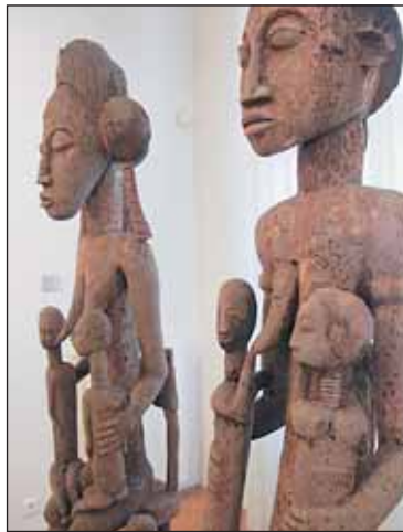
Dřevěné sochy ze sbírky afrického umění si mohou nevidomí osahat.