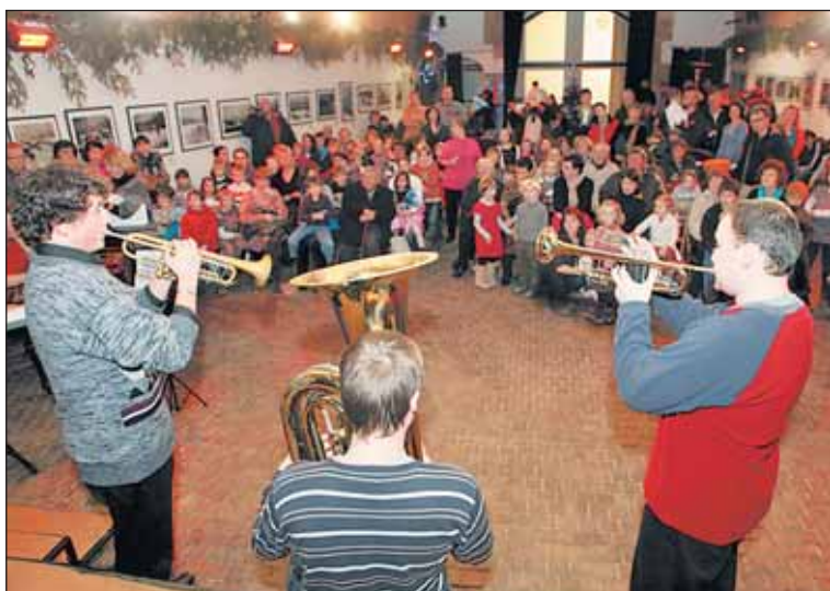
Adventní koncerty škol. Divácký úspěch slavili žáci škol a školek. Na podiu postupně vystoupily děti ze základních škol Dědina, Norbertov, Petřiny-jih, Hanspaulka, J. A. Komenského, nám. Interbrigády a školek Čínská, Tychonova a Šmolíkova.