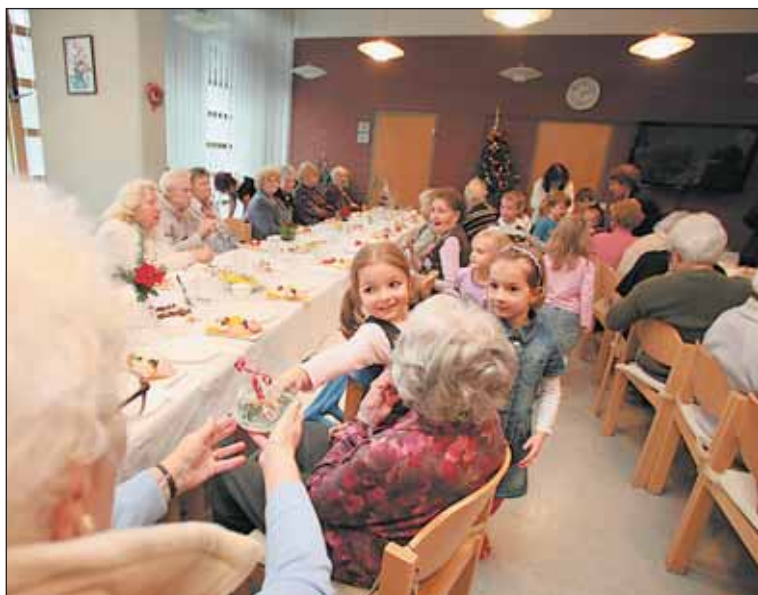
Senioři v domově ve Šlejnické ulici strávili vánoční besídku společně s dětmi z nedaleké mateřské školy. Zpívání odměnili napečenými perníčky.

Pro svoje klienty žijící v domech s pečovatelskou službou pořádá pečo-