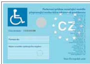
Vyobrazení přední strany.