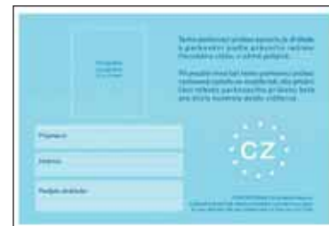
Vyobrazení zadní strany.