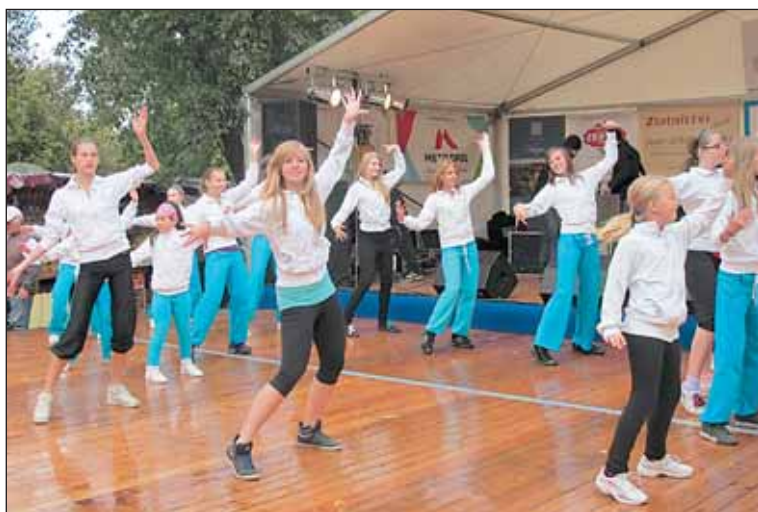
Svoje umění na pódiu předvedly děti ze základních i mateřských škol.