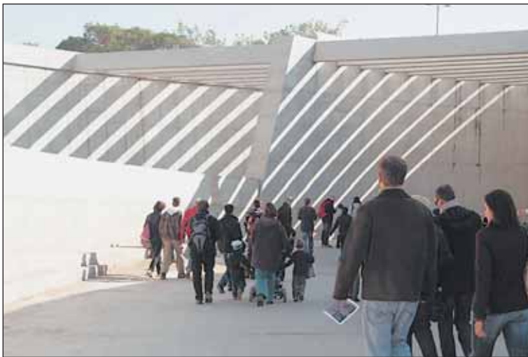
Vstup do tunelů byl v místě budoucí křižovatky U Vorlíků na Letné.