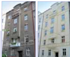
PŘED REKONSTRUKCÍ / PO REKONSTRUKCÍ