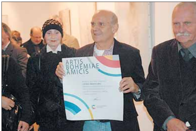
Cena ministra kultury grafika překvapila a potěšila.

Poukazují na podstatu malířova výtvarného díla, založeného právě na dynamické kresbě v její groteskně figurální i znakově abstrahující podobě. Výstavy potrvají do neděle 22. ledna 2012.