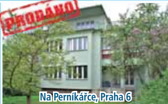
Na Pernikářce, Praha 6

Pro neuspokojené zájemce o koupi hledáme podobné nabídky.