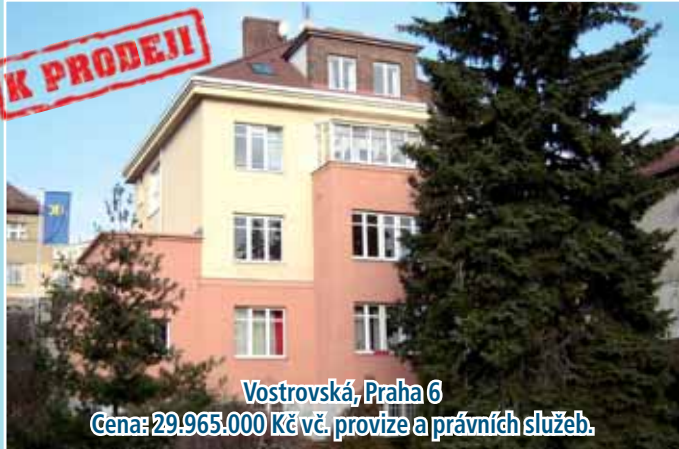
Vostrovská, Praha 6

Cena: 29.965.000 Kč vč. provize a právních služeb.