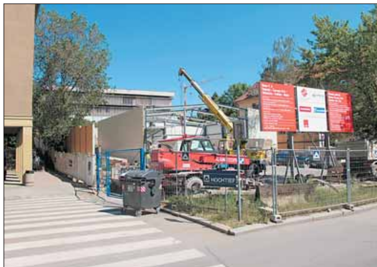
Lidem z okolí Kladenské by od hluku ze stavby metra měla ulevit hala dočasně postavená nad stavebním dvořem.

Místní lidé totiž nesouhlasí s tím, aby výstup z výtahu byl v chodníku před jejich domem. Aby se stavba nezpозdíla, bude nutné najít řešení, razící štít Tonda se k první stanici z Vypichu blíží. Má za sebou už 100 metrů hotového tunelu a druhý štít Adélka se na Vypichu montuje.