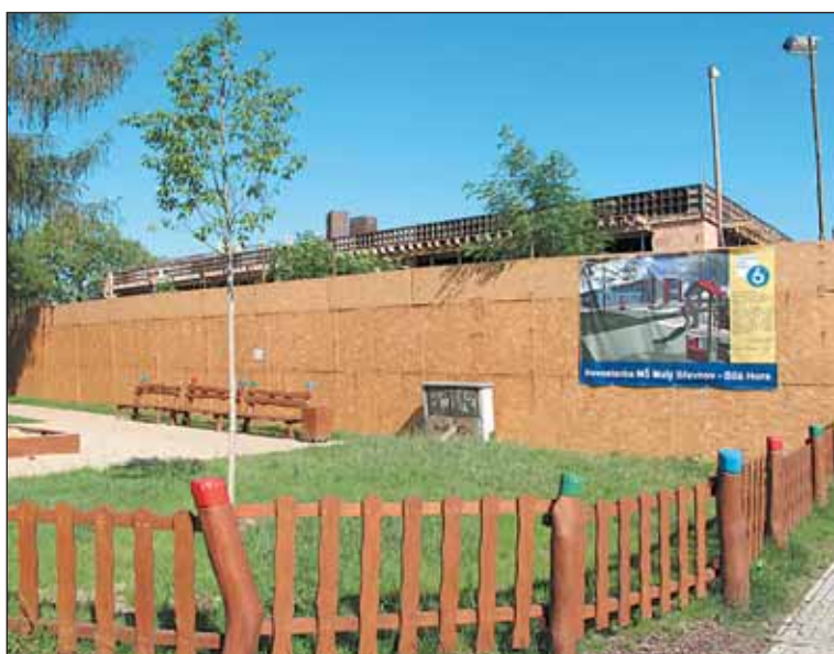
Nová školka v ulici Za Oborou na Malém Břevnově nabídne od nového školního roku dalších 112 míst pro předškolní děti.

V případě, že podobný trend bude pokračovat, uvažuje radnice i o stavbě kontejnerových školek, které mají zhruba poloviční náklady na stavbu.