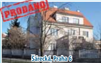
Šárecká, Praha 6