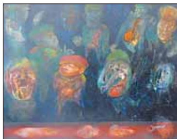
Jiří Anderle: Tváře

Po cyklu Mezilidské vztahy a zejména obrazovém triptychu Žrouti, následovala témata zabývající se problematikou hudby plynoucí v čase. Tento fenomén plynoucího času řeší v abstraktním cyklu Vizualní partitury. Logicky následuje cyklus Portrét v čase, který zahajuje etapu Anderle-