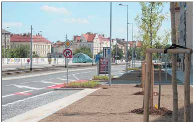
Kromě opravené vozovky, která už je od června v provozu, je upraveno i okolí Hradčanské.

Úsporu má přinést snížení počtu parkovacích stání v podzemních garážích na Prašném mostě, a to ze 430 na 280 míst.