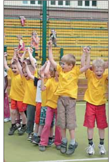
Radost z dobrých výsledků provázela obě sportovní klání.

4. ročník Břevnovských sportovních her mateřských škol pořádala MŠ Meziškolská na hřišti ZŠ J. A. Komenského. V soutěžních disciplínách štafeta, překážková chůze s míčem v kelímku v ruce, skoky v pytlicích, skok do dálky a hod tenisovým míčem na plechovkovou pyramidu se za nemalé divácké kulisy utkalo v šesti družstvech 60 dětí z pěti mateřských škol a mimo soutěž družstvo místní základní školy. 1. místo obsadila pořadající MŠ Meziškolská, 2. MŠ Mládeže, 3. MŠ Bělohorská, 4. MŠ Parlérova a 5. MŠ Jíl-