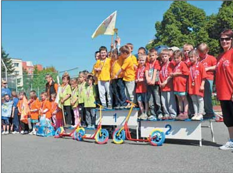
Děti nastoupily do závodu v dresech barvy své školky a se svojí „olympijskou vlajkou“.