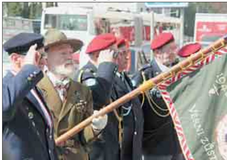
Památku J. Balabána uctili 22. dubna v místě jeho zatčení, ve Studentské ulici.