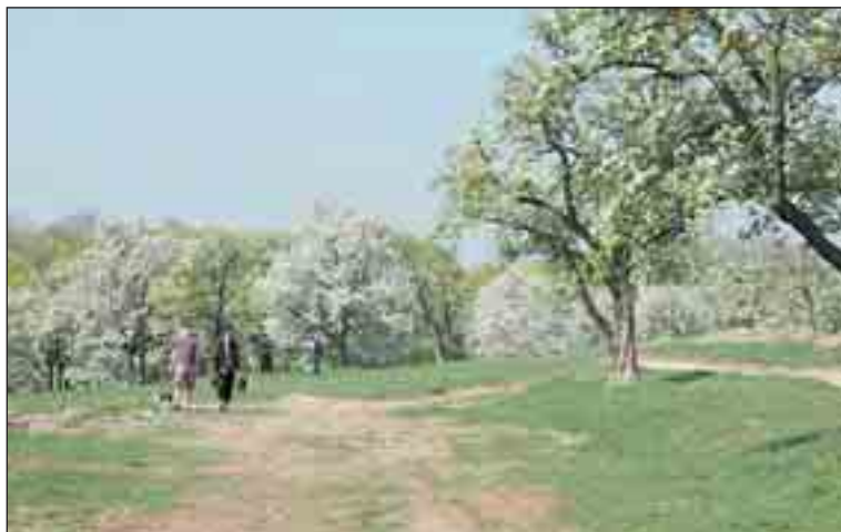
Na podzim bude do ovocného sadu nad oranžerií vysazeno více než 300 nových ovocných stromů.

základě dendrologických posudků, projektu a povolení vykáceny nemocné a dožilé stromy a stejně tak i náletové dřeviny. Na podzim zde budou vysazeny vysokokmenné ovocné stromy, staré odrůdy jablek, hrušní, třešní a slivoní, dále moruše, kaštanovníky, jeřáby oskeruše,“ popisuje Petr Linart. V souvislosti s tím dojde k úpravě návštěvního řádu. Zahrada bude od 22 do 6 hodin uzavřena a bude zakázáno volné pobíhání psů. „Psi budou muset být na vodítku. Pokud je lidé nechají volně běhat, komplikuje to pak údržbu celé zahrady,“ dodává Linart.