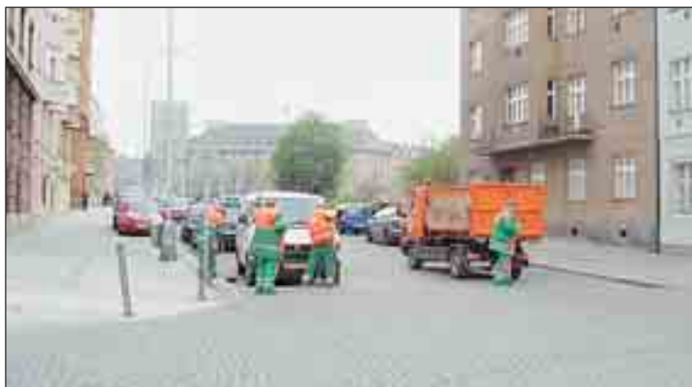
Letos se během úklidu vozy neodtahují, řidiči si se zákazy hlavu nelámou.

O tom, jak kvalitně proběhne úklid, rozhodují právě řidiči. Od rozhodnutí Nejvyššího soudu platí, že vlastník komunikace je povinný auto vrátit na místo, odkud bylo ve veřejném zájmu, což je například čištění silnice, odstranění. Auto se proto raději neodtahují.