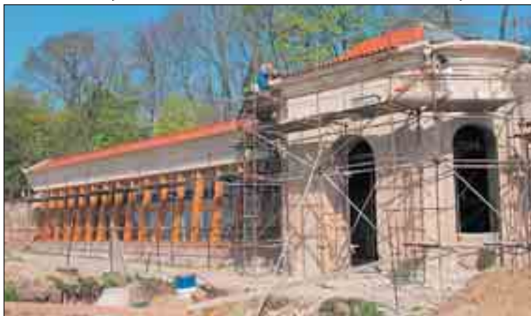
Zřícenina původní barokní oranžerie podle K. I. Dietzenhofera po obnově zvolna nabývá svoji krásu.

Na podzim tak bude vysazeno v ovocném sadu nad oranžerií 340 nových stromů. „Podle projektu dochází k obnově sadu, kde byly na podzim na