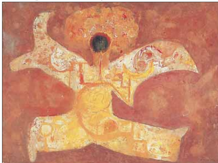
Jiří Anderle: ŽLUTÝ TANEC, rok 1962; olej na papíře.

Anderleho výstavu doplní v prostoru In camera lepty světově proslulého filmového tvůrce Jana Švankmajera. Cyklus Přírodopis odráží atmosféru normalizace, která dusila vše tvůřivé a svobodomyšlné. Hořká realita přinutila Jana Švankmajera vytvářet