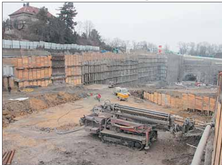
Stavba Blanky omezuje dopravu na povrchu. Praha 6 se snaží vše urychlit.

Praha 6 se zejména snaží prosadit, aby se s předstihem zakryla část Patoč-