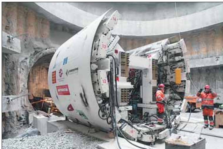
Montáž štítu s číslem 609. Historicky první štít v Čechách se pomalu dává dohromady na Vypichu. Razit začne na konci března.

Povrchové práce vnímají obyvatelé Prahy 6 nejvíce, zejména omezením dopravy na Evropské, kde je doprava do centra na dvou místech svedena do jednoho pruhu a v křižovatce s Horoměřickou a Liberijskou je omezeno odbočení do několika směrů. Směrem z Veveslavína na Petřiny je pak třeba využít objízdnou trasu přes Alžírskou a Kladenskou místo uzavřené Veveslavínské, a to až do konce tohoto roku.