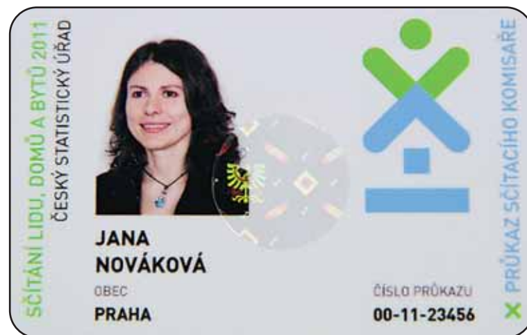
Komisaře poznáte podle průkazu a modré tašky na rameni.

Komisař: Úkolem sčítacího komisaře je také pomoci každému, kdo nebude některé z kolonek rozumět. Komisaři jsou připraveni nechat si údaje např. od nemocného, staršího či nevidomého člověka nadiktovat a formuláře za ně kompletně vyplnit.