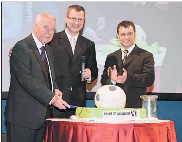
Gratulační večer v hotelu Ambassador.