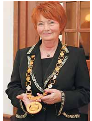
Bude přínosem Praze 6 žena v jejím vedení?

Do Prahy 6 jsem přišla v roce 1963 studovat a bydlela jsem na strahovských kolejkách. Řadu let žijeme v domečku na Petřinách, kde se mi to moc líbí. Do obory Hvězda často chodíme s vnučkami nebo jen sami s manželem a holemi Nordic Walking.