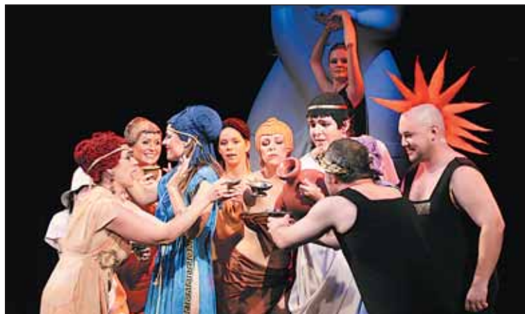
Lysistrata v Semaforu.