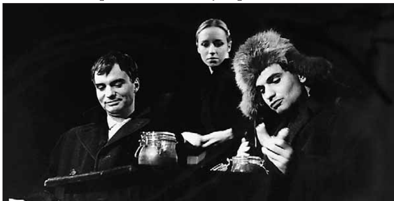
Oblomov končí na scéně DD po devíti letech.

Druhou premiéru sezóny uvidí diváci na jaře. Autorský projekt divadla čerpá ze života, vyprávění a mystifikací slavného českého polárníka a dobrodruha Jana Weltzla. Celosouborové