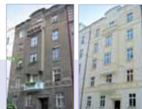
PŘED REKONSTRUKCÍ / PO REKONSTRUKCÍ