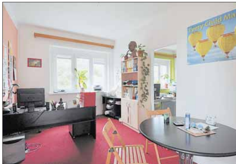
Nové prostory v azylovém domě v Ruzyni poskytla městská část, stala se z nich hernu pro děti i poradna

Pomoc Domu tří přání je zacílena na komplexní práci s ohroženými dětmi a jejich rodinami. Organizace pracuje s rodinami, ve kterých se objevuje zanedbávání dítěte, psychické či fyzické násilí ze strany rodiče. Podporuje rodiče, kteří mají obtíže ve zvládnutí výchovy dětí, či naopak s dětmi, které trpí poruchou chování. Zaměřuje se na pomoc rodinám, ve kterých probíhají