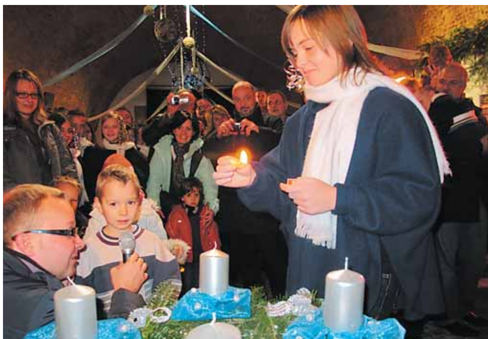
Zapálením první svíce na adventním věnci v Písecké bráně začal pestrý vánoční program.

Praha 6 má za sebou první zásah Sněhové pohotovosti. Dopadl nad očekávání dobře. více na str. 5