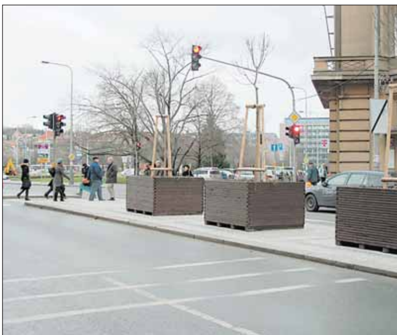
Starou travu ve středovém pásu ulice Čs. armády nahradila dlažba, došlo i na výměnu stromů, které na jaře pokvetou.

tektorů a monitorování vozidel před a v místě přechodu rozeznat, zda vozidlo porušilo předpisy a nedalo chodci přednost. Zaznamenává také situaci, kdy jeden vůz chodci zastaví, a ten ve druhém pruhu přednost nedá. Tak se to stalo například při poslední prázdninové nehodě na tomto přechodu, řidič navíc z místa nehody ujel. „Jízda řidičů, kteří nebudou respektovat chodce v blízkosti přechodu, je zdokumentována a okamžitě postoupena k blokovému nebo správnímu řízení,“ uvedl Záruba. Praha 6, která nové zařízení financovala, si od toho slibuje výrazné