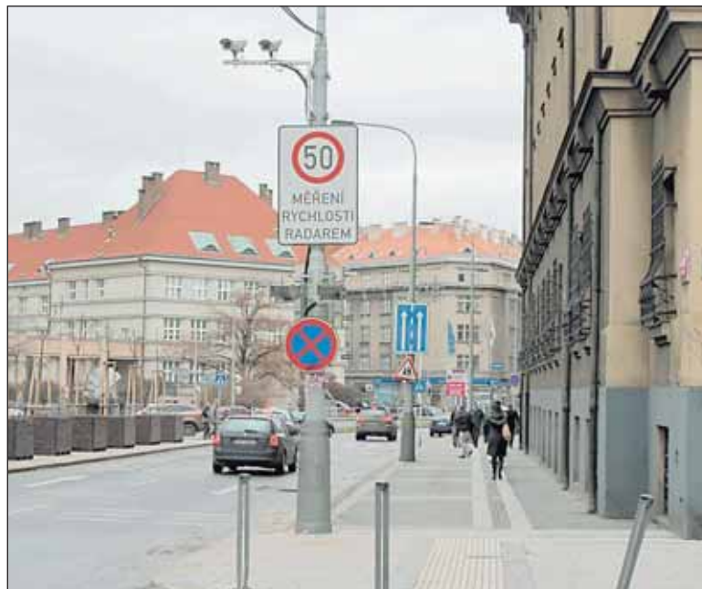
Kamery před i za přechodem pro chodce snímají a vyhodnocují pohyb chodců a chování řidičů. Pokud auto nedá chodci přednost, je to vyhodnoceno jako přešupek.

zvýšení bezpečnosti nejen na tomto přechodu, ale i na ostatních. „Věříme v určitý psychologický efekt. Že budou mít řidiči povědomí o tom, že lze takový přešupek kamerami zdokumentovat, a budou se chovat ohleduplně i na dalších nesignalizovaných přechodech,“ domnívá se radní Záruba.