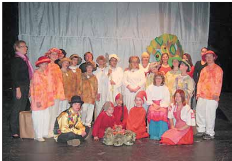
Děti ze základní školy speciální vědí, že malý hendikep v hraní divadla nevadí.

z divadelního kroužku Přepestro při ZŠ speciální Rooseveltova a z tanečního kroužku těžce školy, a také klienti Speciálního domova pro mládež v Sedlci.