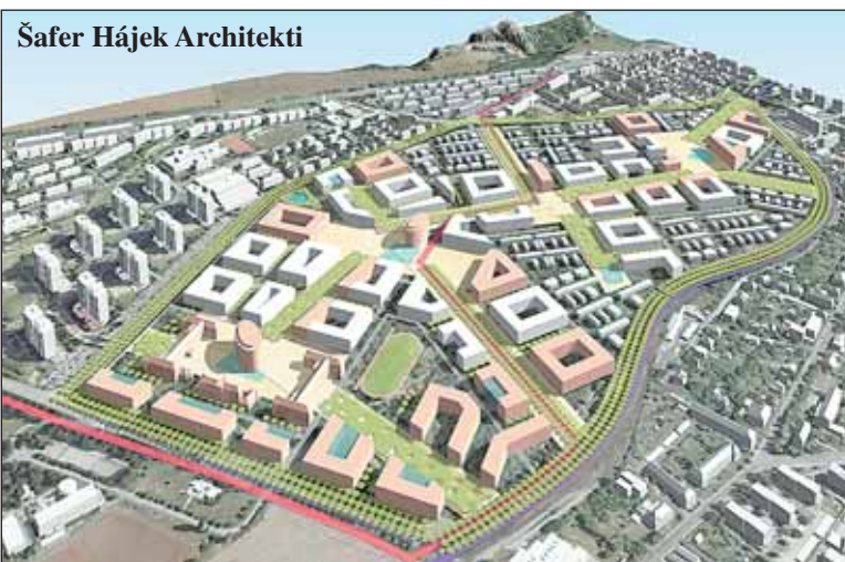
Šafer Hájek Architekti