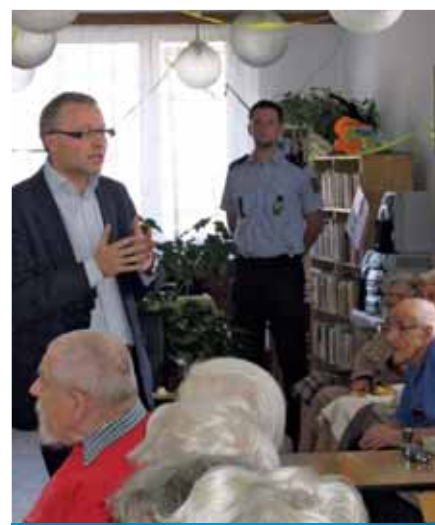
V diskusí se seniory domu s pečovatelskou službou U Stanice

Ani nevíte, jak bych si přál umět praštit do stolu a říci ano a kdy. Bohužel, tady naše radnice stále zůstává neúspěšná a prosadit náš návrh se nám nedaří. Věřím nicméně, že nakonec se nám jej podaří dotáhnout do vítězného konce. Jen se trochu bojím, abychom v případě radikální změny obsazení na Magistrátu nemuseli ve vyjednávání našeho požadavku začínat zas od úplného začátku.