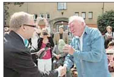
Čestný občan Gustav Mahler.