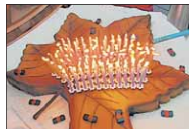
Narozeninový dort Prahy 6.