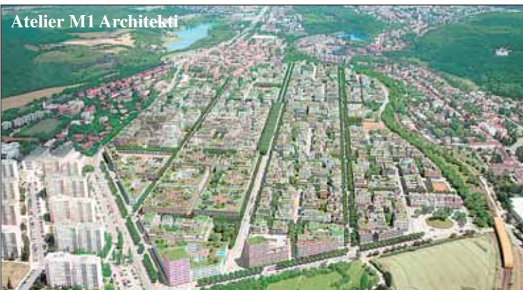
Atelier M1 Architekti