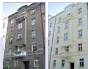
PŘED REKONSTRUKCÍ / PO REKONSTRUKCÍ