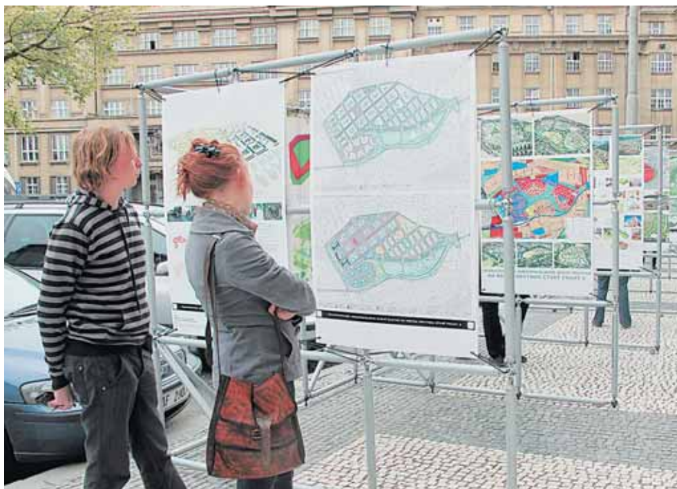
Výstavu Perspektivy Prahy 6 lze vidět na nám. Svobody do 10. 10. Výsledky soutěže pak i na Dědině.

Dvě oddělení pro padesát dětí otevřela MŠ Červený vrch ve zrekonstruovaném pavilonu při základní škole. V opravené budově je i místo pro školní družinu. více na str. 6