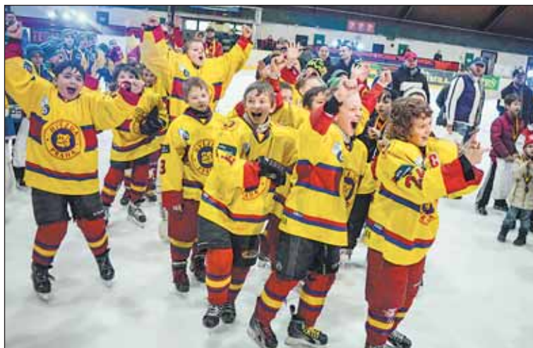
Radost vítězného týmu nad zaslouženě vybojovaným vítězstvím byla nefalšovaná.