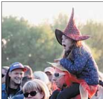
Tato malá čarodějnice nepřiletěla na koštěti, použila spolehlivějšího prostředku - svého tatínka.