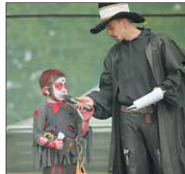
Mezi davy čarodějnic se objevilo i několik čarodějnických učňů.