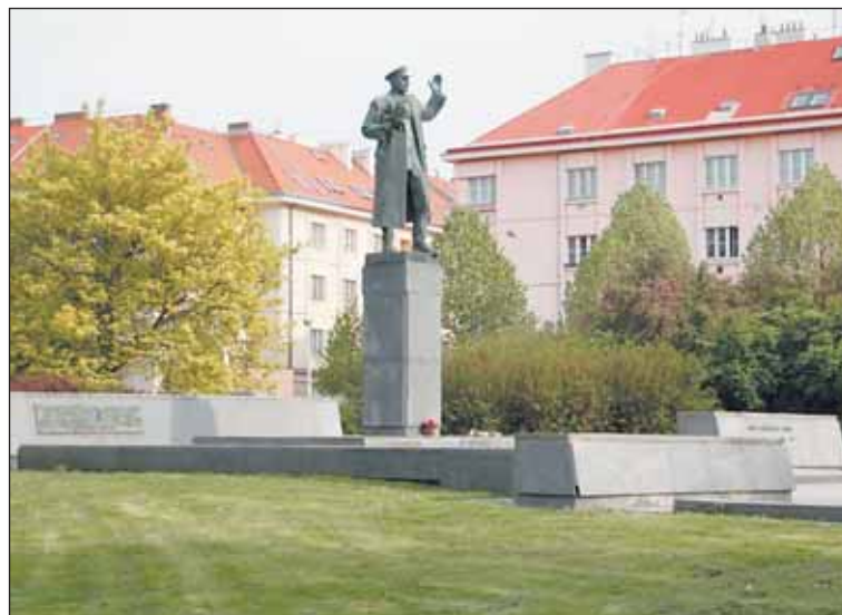
Podaří-li se projekt parku Liberátorů realizovat, mělo by v něm zůstat místo i pro pomník kontroverzního maršála I. S. Koněva.