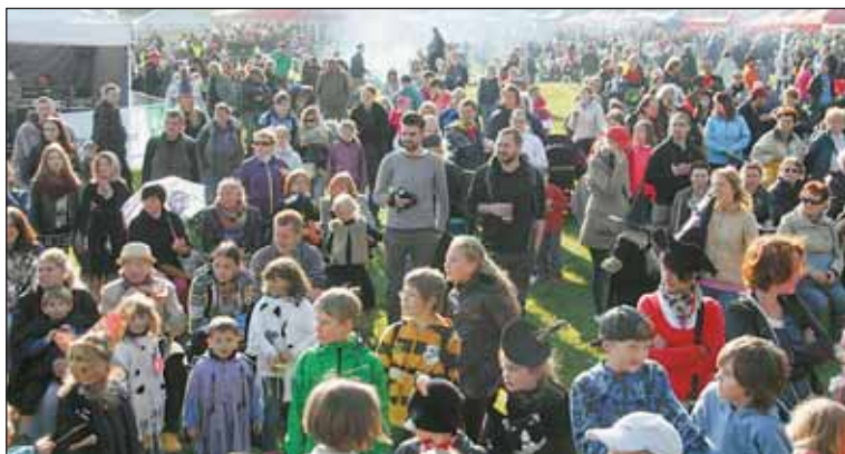
Desátý ročník Pálení čarodějnic si užily tisíce návštěvníků všech věkových skupin.