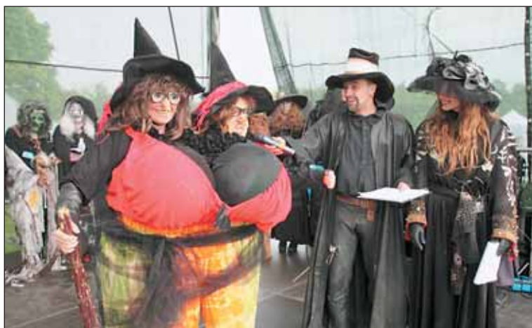
O titul Miss se na Ladronce ucházela i tato historicky první siamská čarodějnická dvojčata.