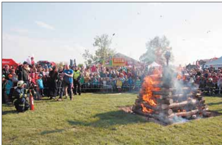
Původním smyslem zapalování ohňů v noci ze 30. dubna na 1. května bylo zahánění zlých sil.