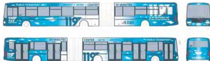
Jeden z návrhů předpokládá úpravu stávající linky 119, cestující by měla upoutat odlišným designem.

„Letiště Václava Havla Praha vždy chtělo co nejvíce přizpůsobit svým potřebám linku 119, například zrušit všechny nácestné zastávky mimo areály letiště, v tomto ohledu je výsledkem od 7. 4. změna charakteru většiny zastávek na znamení. Případná speciální