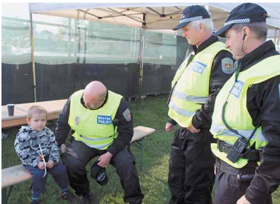
Bezpečnostní situace na Praze 6 je podle analýz odborníků příznivá.