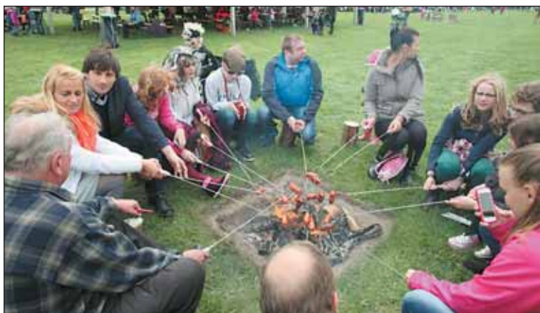
Zatímco na jiném místě Ladronky plála velká hranice určená k pálení čarodějnic, na tomto ohni se pekly a připalovaly špekáčky.