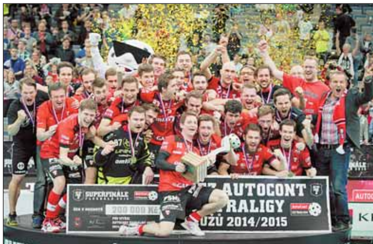
V sobotu 18. dubna se Tatran Střešovice svým výkonem v superfinále suverénně vyhoupl na florbalový Olymp

Působivé vítězství Tatrana Střešovice motivovalo Městskou část Prahy 6 k velkorysému gestu. Tým dostane za svůj výkon jednorázovou finanční odměnu. „Protože Tatran reprezentuje vzorně naši městskou část, rozhodli jsme se poskytnout neúčelovou dotaci sto tisíc korun,“ informoval starosta Prahy 6 Ondřej Kolář. Oficiální předání šeku proběhne 14. května.