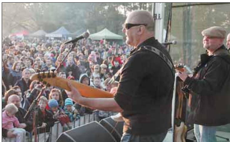
Kapela Buty na Ladronce odehrála svůj vůbec první letošní koncert.

Akce probíhala od 10.30 až do 20.00 večer.