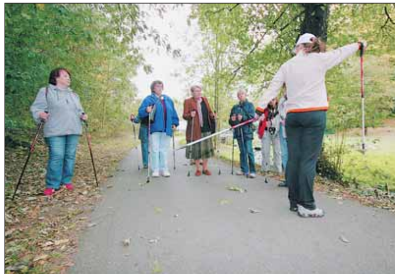
Mezi seniory je velmi oblíbenou fyzickou aktivitou nordic walking, chůze se speciálními holemi. V Divoké Šárce se jich sešla necelá stovka.