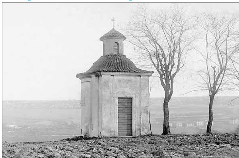
Pohled na kapli sv. Michala kolem roku 1920.

kompletní opravu a záchranu objektu včetně úprav nejbližšího okolí a osvětlení dvěma zemními reflektory. Stavební práce byly zahájeny v červnu, a pokud počasí dovolí, hotovy by měly být do konce roku. Kaplička již má položenou novou krytinu z pálených tašek včetně osazení repliky kovaného křížku, opravené omítky a je chráněna proti zemní vlhkosti. Barva fasády bude v odstínech, které vycházejí z provedeného restaurátorského průzkumu. Kaple dostane repliky dřevěných oken a dveří a opravenou vnitřní opukovou dlažbu.