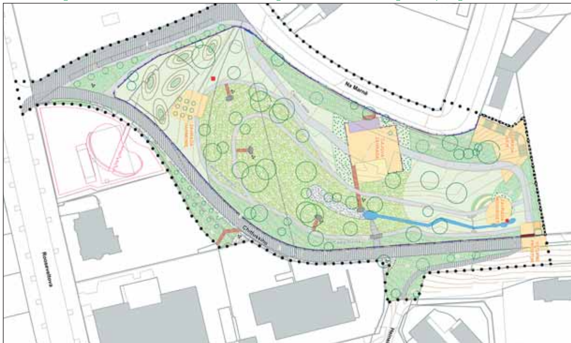
V oploceném parku Ve Struhách by měly vyrůst zahradní altánky, také skladba zeleně bude odpovídat asijskému typu zahrad.

fologii je přístupna pouze malá část této plochy. Proto byly navrženy nové cesty a odpočinková místa, která v parku umožní nerušené posezení a prostor pro meditaci či čtení,“ vysvětluje projektantka Lenka Fischerová ze DHV CR.