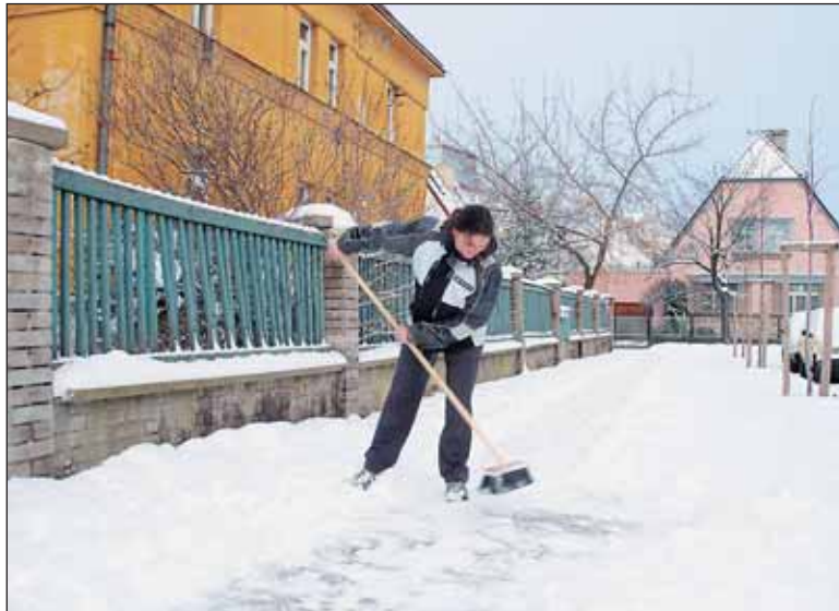
Majitelé přilehlých nemovitostí už za stav chodníků neodpovídají. Radnice Prahy 6 je ale vyzývá ke spolupráci na úklidu sněhu. Za to jim zaplatí.

Lidé se mohou hlásit na radnici, k dispozici dostanou nářadí a za práci dostanou zapláceno. Zároveň mohou za pronájem nabídnout své prostory, např. sklep, k dočasnému uskladnění nářadí a posypového materiálu.