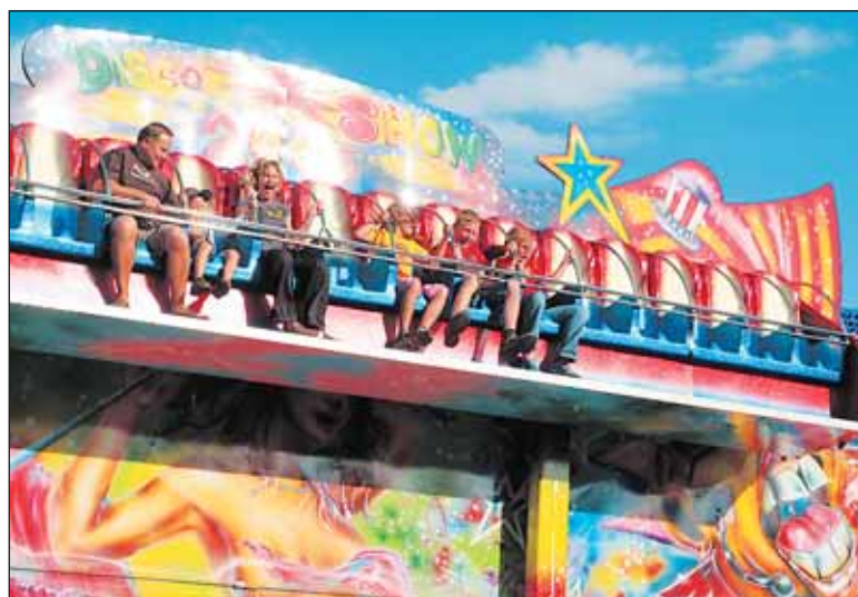
Na atrakci zvané visutá lavice bývá zábava. Tentokrát došlo na ní došlo ke zranění, lidé z ní vypadli. Ilustrační foto