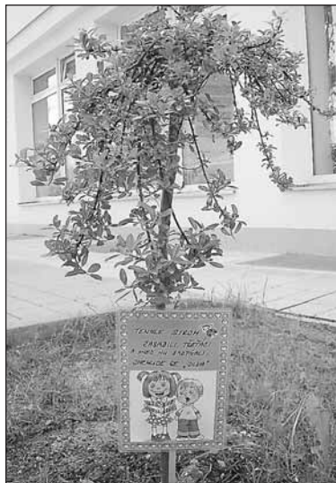
Tento stromek zůstal. Ostatní si odnesl zloděj.