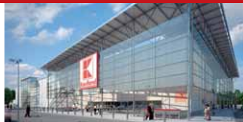
... a takto přivítá své první zákazníky.

Již brzy se budete moci přesvědčit, že nakupovat se dá skvěle a přece levně!