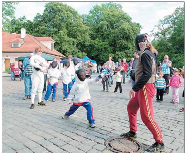
Na akci se předvedli mladí šermíři z pětibojařského oddílu Dukly Praha.

Na pódiu v Písecké bráně děti předvedly skvělou show a dokázaly, že smysluplné trávení volného času se vyplatí. V rychlém sledu se střídala hudební, taneční a dramatická vystoupení a nechyběly ani sportovní exhibice.