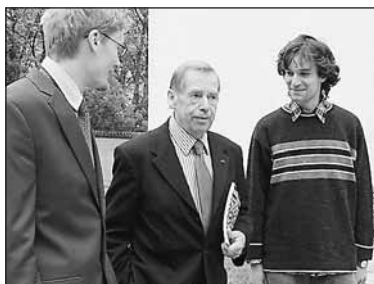
Vernisáž navštívil jediný žijící z vystavovaných autorů, Václav Havel.

cesu tvorby. Oni sami se prostřednictvím vlastní fantazie stávají tím nejdůležitějším prvkem, nástrojem i obsahem projektu. Vcházejí do živého, proměnlivého prostředí a v různých časech při rozdílných konstelacích mohou zažívat nejruznější asociativní řetězce. Proto se návštěvníci do prostředí expozice často vracejí, vždy znovu objevují a spoluvytvářejí nové souvislosti.“ vysvětluje Petr Nikl. Výstava probíhá do 14. července a pro děti do 15 let je zdarma. Otevřeno je od pondělí do neděle 10 – 18 hodin.