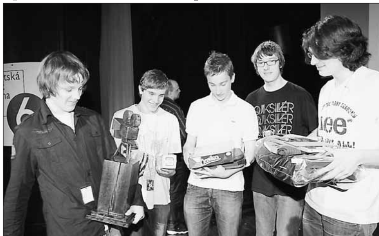
Divácká cena i postup do pražského kola patří skupině ze ZŠ Pod Majánkou s filmem o homosexualitě.

Po těžkém rozhodování poroty postoupuje do pražského finále z 1. místa originálně zpracovaný film Wrong side