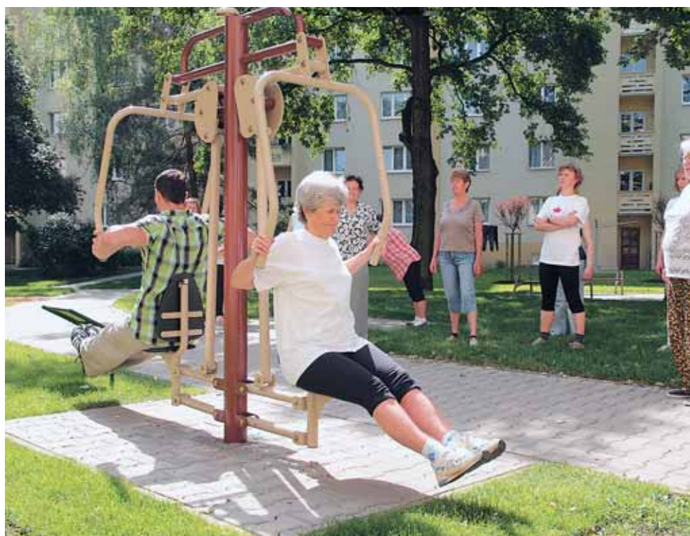
Aktivní senioři z Prahy 6 zaplnili venkovní posilovnu. Pod vedením trenéra posilují svaly v rámci akce Zacvičte si s Prahou 6 . Cvičební lekce zdarma se konají i v červnu.