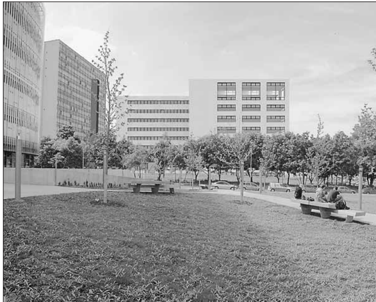
Nová budova vyrostе během 18 měsíců. ČVUT tak bude mít možnost přijmout více studentů, zejména oboru architektury.