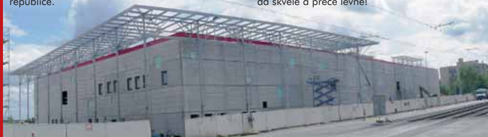
Takto vyrůstá největší Kaufland v ČR (květen 2009) ...