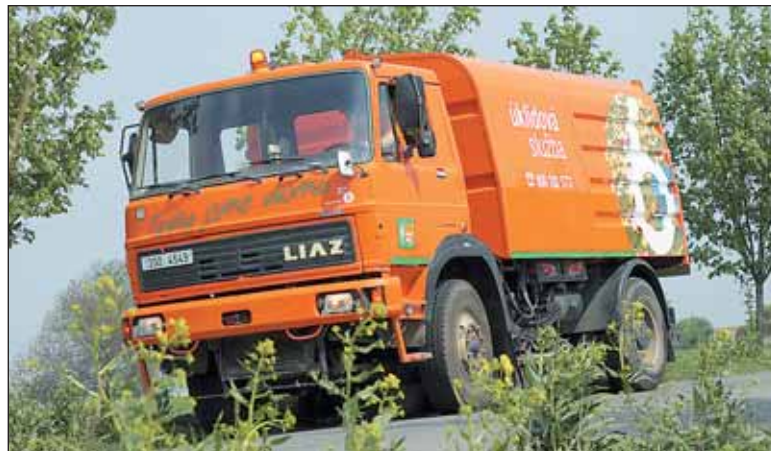
Úklidová auta budou označena logem Prahy 6 a číslem bezplatné linky 800 182 573

S novým systémem úklidu chce radnice zavést i důslednější kontrolu. Proto budou mít zaměstnanci firmy, která se o vzhled Prahy 6 bude starat, jednotné oblečení. Na uniformě bude logo Prahy 6 a telefonní číslo bezplatné linky 800 182 573, na které lze zavolat,