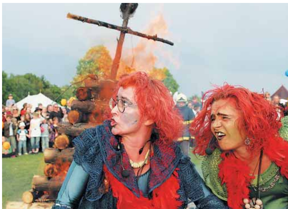
Přes deset tisíc lidí přišlo pálit čarodějnice na Ladronku. O ty nebyla poslední dubnový den na břevnovské pláni nouze. Akci pořádala Praha 6.