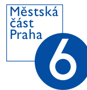
Tomáš Chalupa starosta Prahy 6

„Pohyb je prospěšný pro každou věkovou kategorii. Velký význam má zejména pro lidi v pokročilejším věku, kdy je aktivní životní styl důležitý pro delší a zdravější život. Zapojení pohybu do rekreačních aktivit pro dospělé, tak jak to nyní nabízí Praha 6, pomáhá nejen utužovat zdraví, ale je zdrojem společenského vžití a zábavy.“