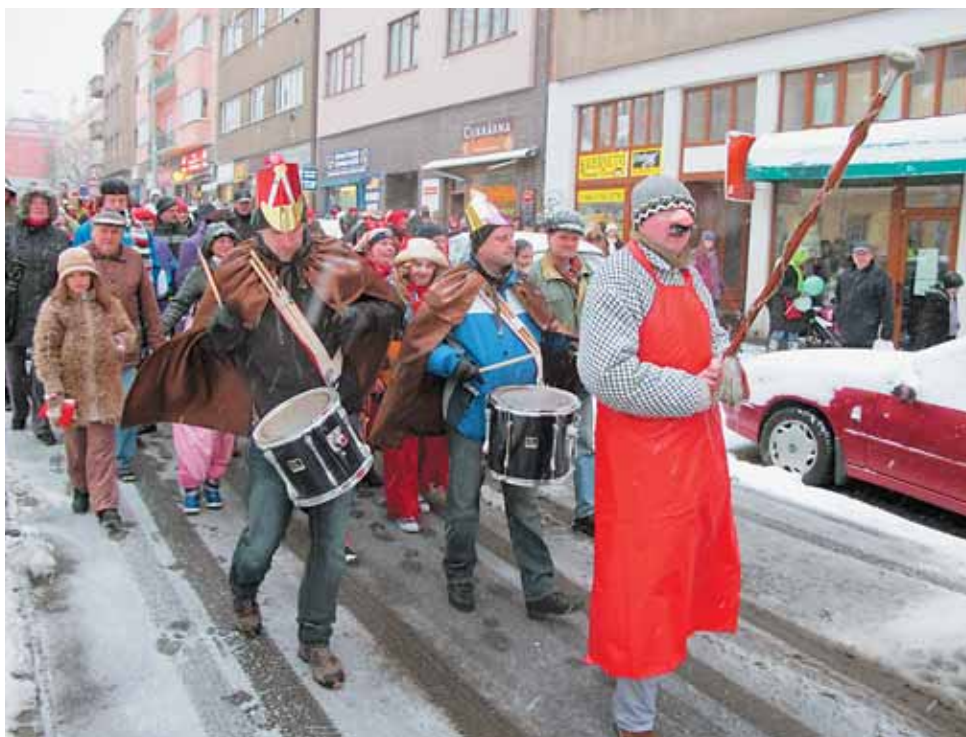
Masopustní průvod šel poprvé za devatenáct let po Bělohorské ulici směrem dolů. Tématem masopustu byla hudba.

Zastupitelé na mimořádném jednání debatovali o dostavbě Vítězného náměstí, kde by měla do roku 2015 stát polyfunkční budova Line. více na str. 5