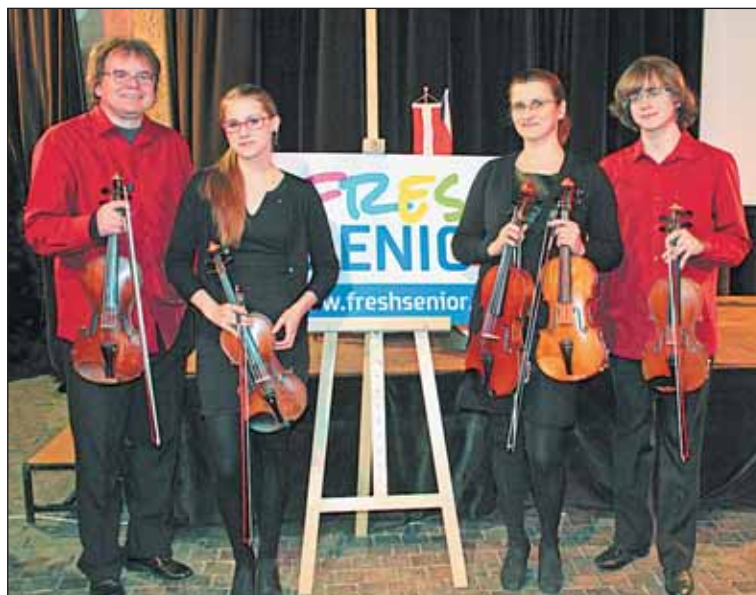
Hudba Wolfganga Amadea Mozarta zazněla v podání komorního souboru slavné pražské hudební rodiny Verner Collegium.

Pište nám na info@porteos.cz , volejte na 724 559 965 nebo 224 325 224.