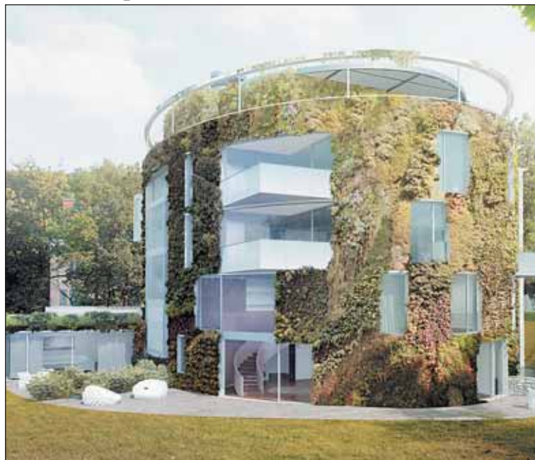
Rezidenční projekt Bubeneč Gardens má ambice zařadit se mezi ostatní významné a architektonicky zajímavé stavby v Praze 6.

Hlavním cílem pro vznik projektu Bubeneč Gardens bylo především postavit rezidenční dům, který by splňoval nejnáročnější požadavky na zdravý a kvalitní životní styl. Ojedinelá budova bude tvořena sedmi bytovými jednotkami. Při realizaci projektu budou použity vyspělé technologie a obnovitelné zdroje v kombinaci se „smart home“ řízením bytu, díky čemuž bude dosaženo velmi nízkých