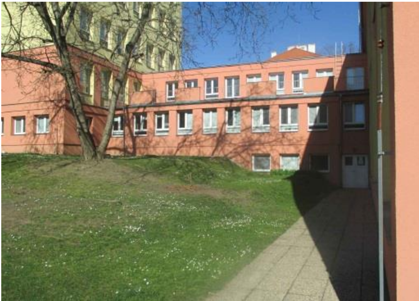
MŠ při ZŠ Na Dlouhém lánu – zřízení v objektu školy; navýšení o 21 míst