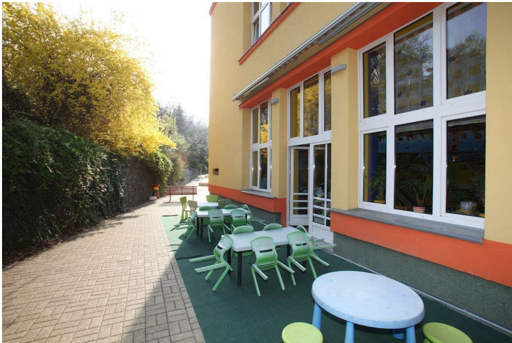
MŠ Sbíhavá – zřízení lesní třídy; navýšení o 15 míst