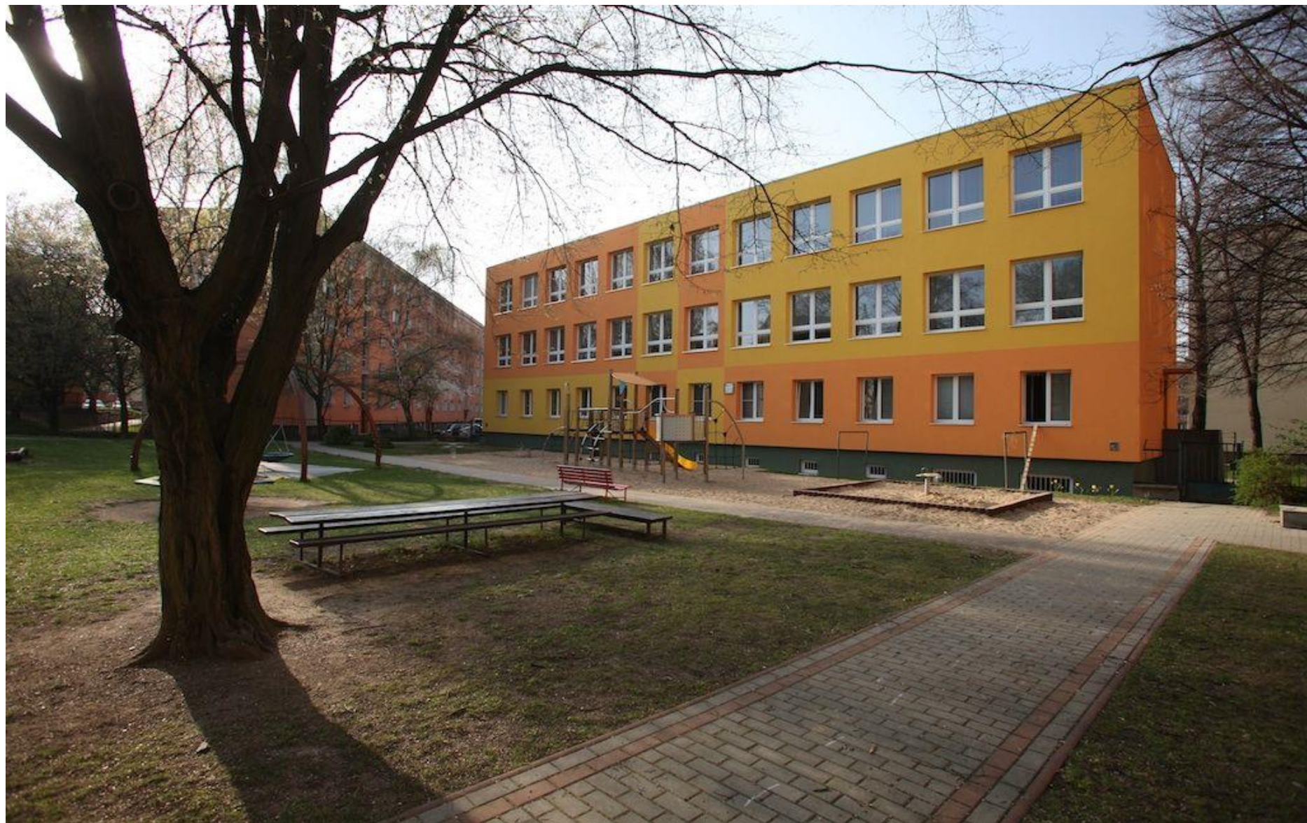
MŠ Volavkova – zateplení objektu