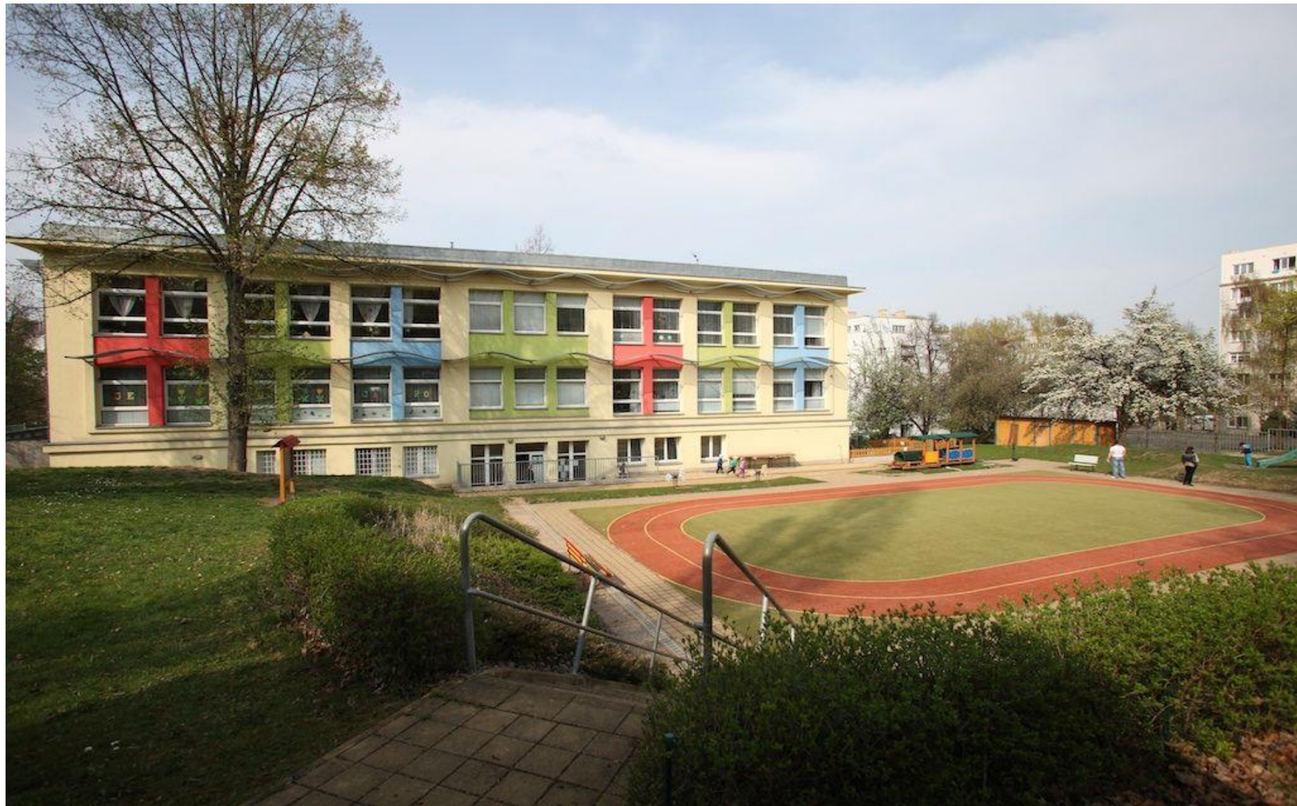
MŠ Jílkova – rekonstrukce objektu