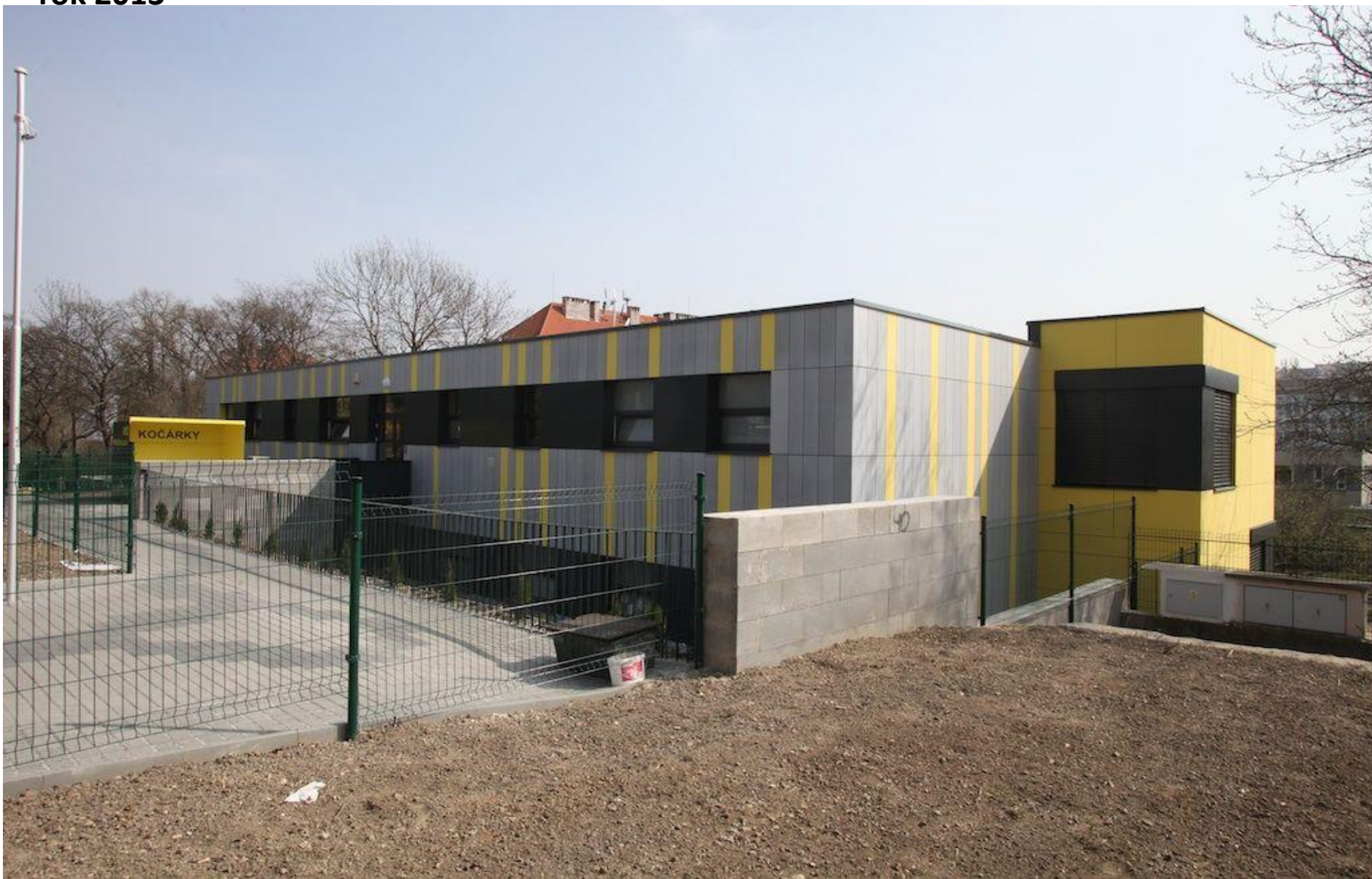
MŠ Meziškolská – modulová novostavba; první ve vnitřní Praze