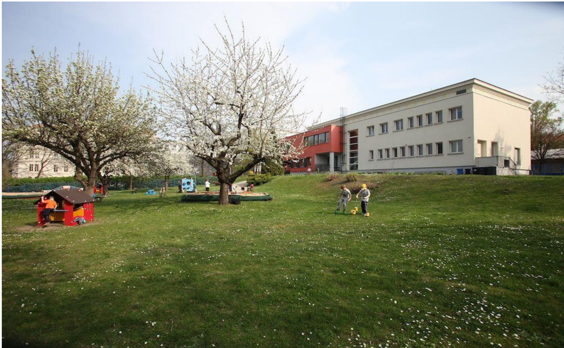
MŠ Parlérova – rekonstrukce a navýšení kapacity o 20 míst