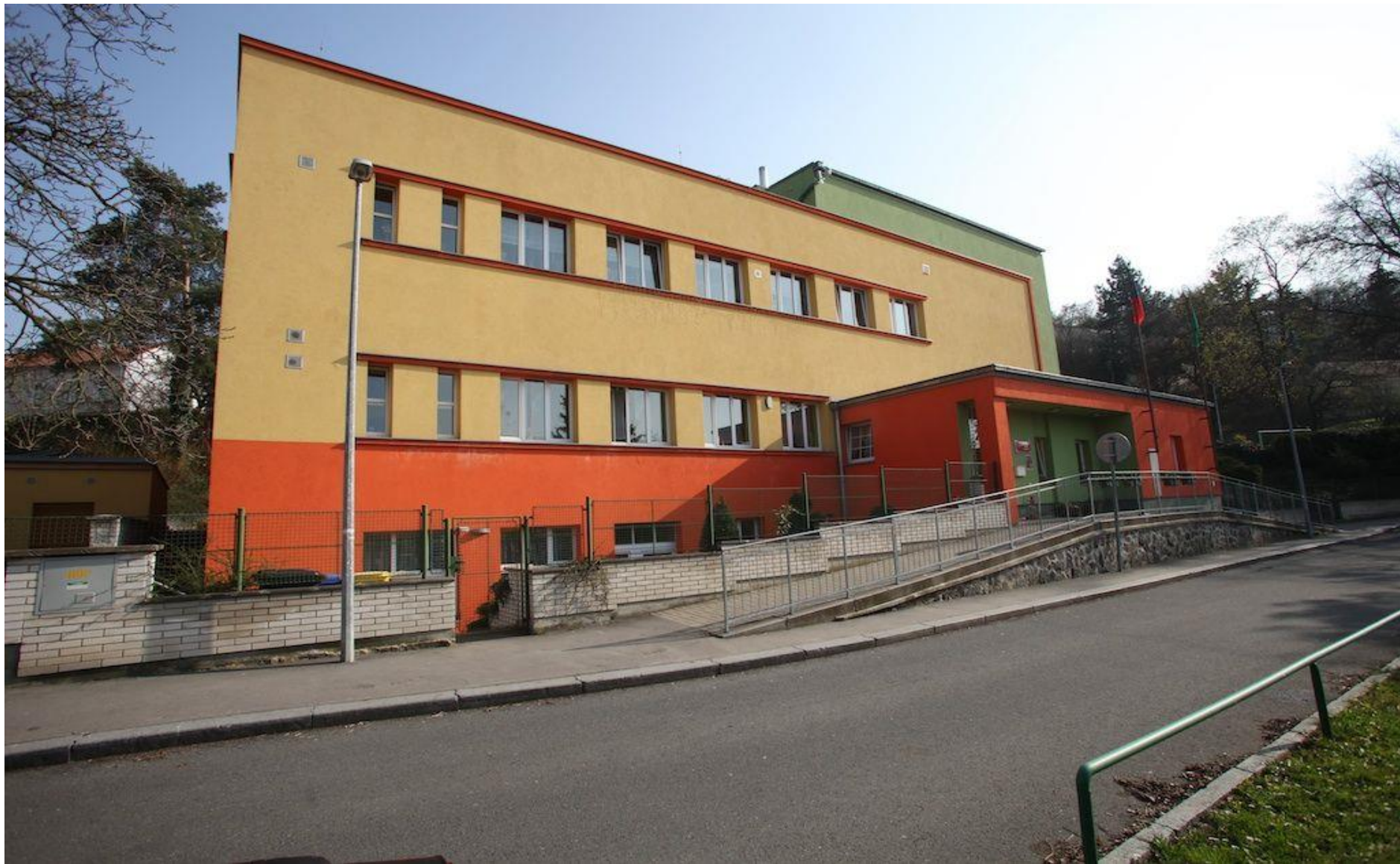
MŠ Sbíhavá – rekonstrukce objektu; navýšení kapacity o 11 míst