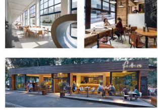
INSPIRAČNÍ FOTKY INTERIÉRU A EXTERIÉRU KAVÁRNY