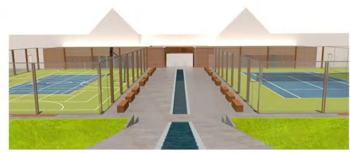
PERSPEKTIVA Z POHLEDU CHODCE NA JIŽNÍ FASÁDU OBJEKTU

MATERIÁLOVÉ ŘEŠENÍ REFLEKTUJE OKOLNÍ ZÁSTAVBU PRŮCHOD, KTERÝ SPOJUJE BUDOVU KAVÁRNY A TENISOVÉHO KLUBU A PROPOLUJE ÚROVŇ ULICE PŘED CENTRÁLNÍ BUDOVOU S ÚROVŇÍ VEŘEJNÉHO PROSTRANSTVÍ S HRŠTÍ ZVÝŠUJE PŘÍCHOVNOST ÚZEMÍM, AKCENTUJE CENTRÁLNÍ BOD PŘED HLAVNÍ BUDOVOU, ALE NEKONKURUJE JÍ HMOTA BUDOVY ZPŮSOBUJE HMOTU LOUŽE BUDOVY KINA TAK, ABY DOTVÁŘELA ZAVŘENÝ A PEVNÝ ULIČNÍ PROSTOR ULICE ZASTAVĚNÁ PLOCHA 330 M 2 HFP 330 M 2 OBESTAVĚNÝ OBJEM 1469 M 3